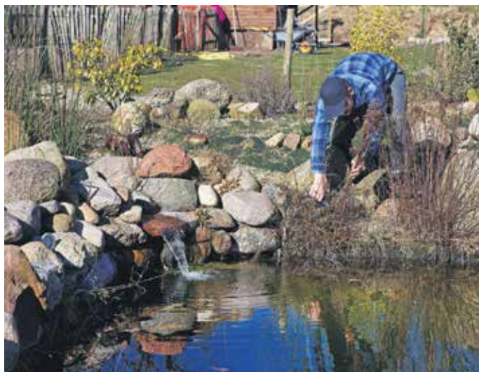
Durch die Auswirkungen des Klimawandels benötigt der heimische Gartenteich besondere Pflege, um Flora und Fauna nicht zu gefährden.

Temperaturen jenseits der 30-Grad-Celsius-Marke sind nicht nur für den menschlichen Organismus eine Belastung, sondern auch für Flora und Fauna im Gartenteich. Je mehr die Wassertemperaturen steigen, desto geringer wird der Sauerstoffgehalt im feuchten Element. Fische benötigen aber in wärmerem Wasser mehr Sauerstoff. Dieser Teufelskreis kann zum echten Überlebenskampf für die Tiere werden. Daher sollten Teichbesitzer mit nützlichen Helfern wie Oxydatoren dem Teichwasser zusätzlichen Sauerstoff zuführen. Die Geräte, die es vom Anbieter Söchting Biotechnik für unterschiedliche Biotop-Größen gibt, enthalten eine spezielle Sauerstofflösung, die sich an der Spezialkeramik in Wasser und aktivierten Sauerstoff aufspaltet. Das bringt zusätzlichen Sauerstoff und verbessert die Wasserqualität entscheidend. Unter www.oxydator.de gibt es Informationen dazu, dass sich diese Form des Sauerstoffs schneller im Wasser verteilt als seine gelöste Variante. Die Geräte können flexibel eingesetzt werden und arbeiten ohne Stromzufuhr oder Kabel.