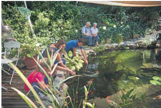
Je mehr die Wassertemperaturen steigen, desto geringer wird der Sauerstoffgehalt im feuchten Element.

(DJD). 1,4 Millionen Gartenteiche mit Zierfischen gibt es in Deutschland. Dies ist das Ergebnis einer aktuellen Studie des Industrieverbands Heimtierbedarf (IVH) e.V. Doch die Auswirkungen des Klimawandels machen sich auch bei den Unterwasserbewohnern im heimischen Biotop bemerkbar. Die Pflege des Gartenteichs muss sich daher diesen neuen Herausforderungen anpassen, damit die feuchten Idyllen nicht aus dem Gleichgewicht geraten.