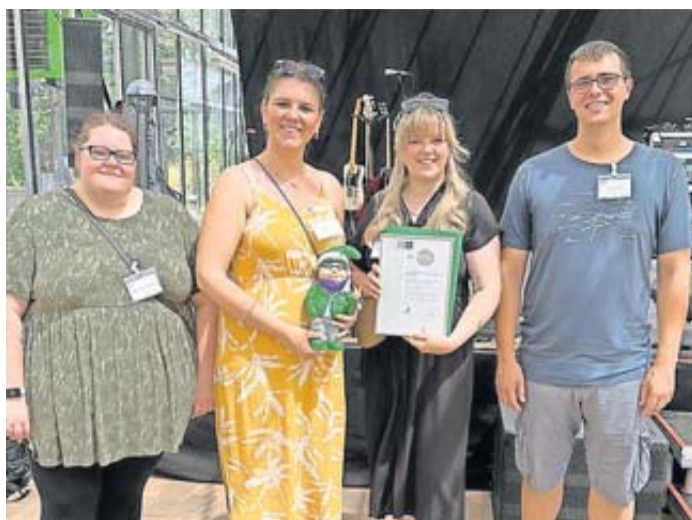
Das Team der Flüchtlingshilfe freut sich über die Auszeichnung.

Auszeichnung für das Team der Flüchtlingshilfe