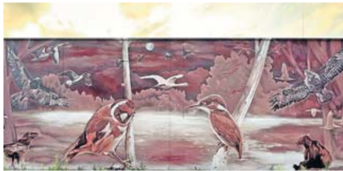
So wie Kinder und Jugendliche in das Leben erwachen, erzählt das neue Wandbild am Efzet Heilsberg die Geschichte vom Wachen und Erwachen.

Bad Vilbel. Ab der Kalenderwoche 37 werden in Bad Vilbel 77 Straßenbeleuchtungsmaste neu gestrichen. Im Zuge dieser Arbeiten werden alle festmontierten Schilder entfernt. Verkehrsschilder werden für die Zeit der Maßnahme mobil aufgestellt, etwaige Hinweis- oder genehmigte Werbeschilder werden abgenommen und nach Fertigstellung wieder angebracht. Da es nicht gestattet ist, private Schilder an den Beleuchtungsmasten anzubringen, werden etwaig angebrachte Schilder im Zuge der Maßnahme entfernt. Alle Bürgerinnen und Bürger werden für die Zeit der Maßnahme um Achtsamkeit und Verständnis gebeten.