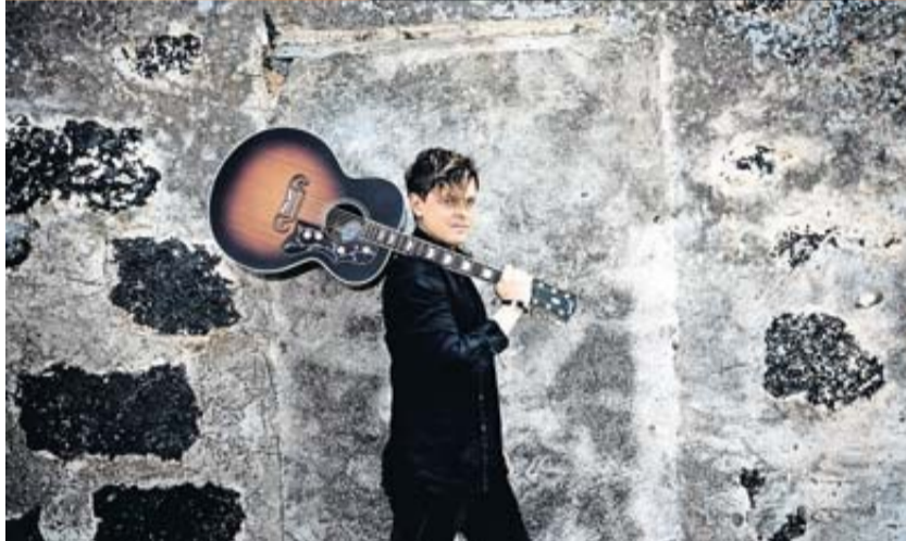
Große Namen beim „Gießener Kultursommer“ auf dem Schiffenberg.