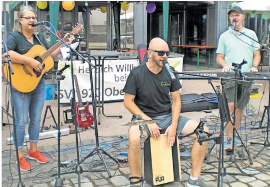
Für die erste musikalische Unterhaltung am Samstag sorgte ab 19.30 Uhr die heimische Mundartband „s'Kapellsche“.

Viel Unterhaltung und Musik im Schlosspark und Schlosshof