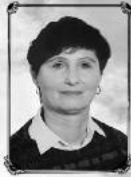
Brachtal, im August 2023

Im Trauerfall sind wir auch nach Redaktions- schluss (Dienstag, 17 Uhr) für Sie da und versuchen, Ihre Anzeige noch unterzu- bringen – rufen Sie ein- fach an! Tel. 06054-1318