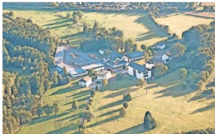
Das Wasserwerk in Inheiden lädt zum Tag der offenen Tür ein.