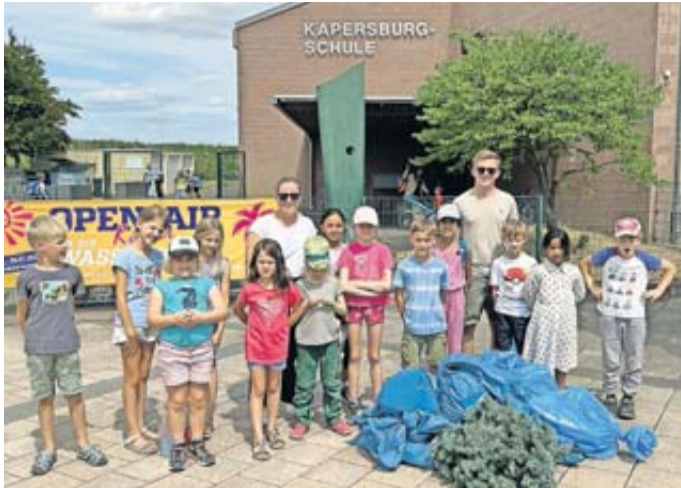
Die fleißigen Helfer der Aktion.

Umweltaktion in Rosbach ein voller Erfolg