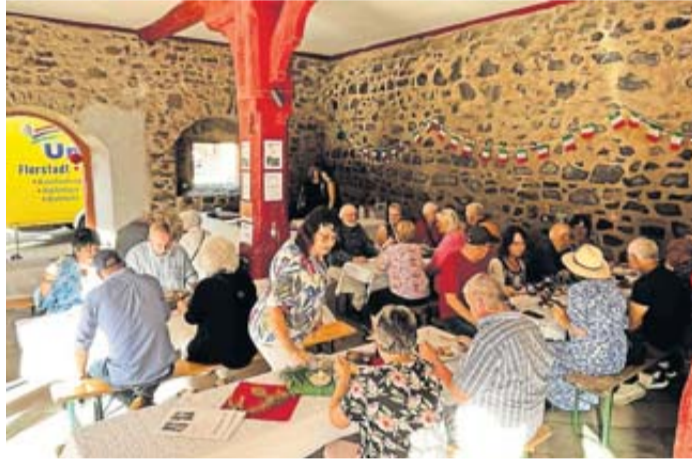
Gemütlicher Abend mit Landtagskandidaten.