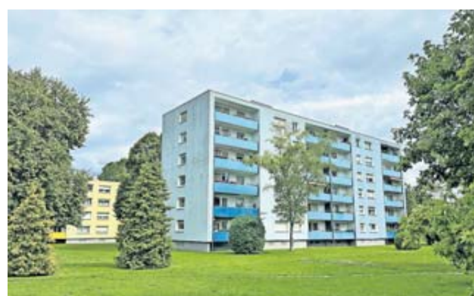
Das Grießbreiviertel nimmt bei der energetischen Quartierssanierung in Bad Nauheim die Vorreiterrolle ein.