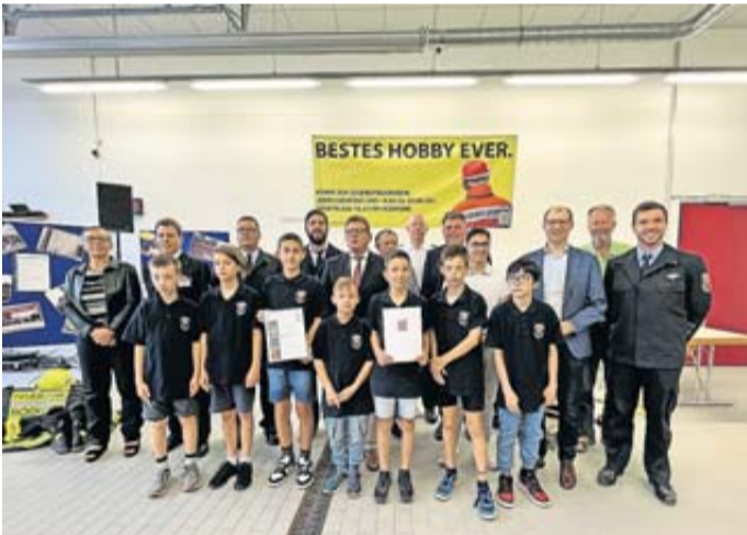
Der Nachwuchs wird für seine Kampagne geehrt.

Freiwillige Feuerwehr des Monats April 2023