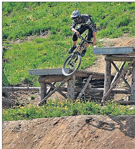
Kinder und Jugendliche wünschen sich einen Bikepark in Eppstein.

Für das Areal, das über den Eppenheimer Weg zugänglich ist, gibt es noch keinen Bebauungsplan. Die Verwaltung habe deshalb in den vergangenen Monaten einige vom Main-Taunus-Kreis geforderte Gutachten anfertigen lassen und rechtliche und sachliche Fragen geklärt. So wurden in einer faunistischen Untersuchung die Lebensstätten einiger Brutvögel und geschützter Tierarten untersucht und eine landschaftspflegerische Beschreibung des Geländes vorgenommen.