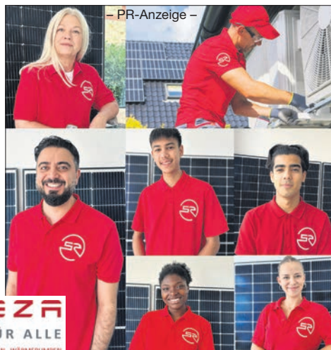
Das Team von Solareza berät zu nachhaltigen Energie-Lösungen.