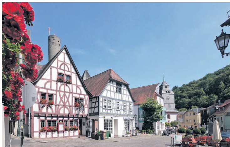
Blick über den Wernerplatz in der Altstadt.

Zu reinigen sind: Die Fahrbahnen einschließlich Radwegen, Parkplätzen, Straßenrinnen und Einflussöffnungen der Straßenkanäle, Gehwege, auch Treppenanlagen, Überwege, Böschungen, Stützmauern und ähnliche Einrichtungen. Gehwege im Sinne dieser Satzung sind die für den Fußgängerverkehr ausdrücklich oder bestimmte und äußerlich von der Fahrbahn abgegrenzten Teile der Straße, ohne Rücksicht auf ihren Ausbauzustand und auf die Breite der Straße (etwa Bürgersteige, unbefestigte Gehwege, Seitenstreifen) sowie räumlich