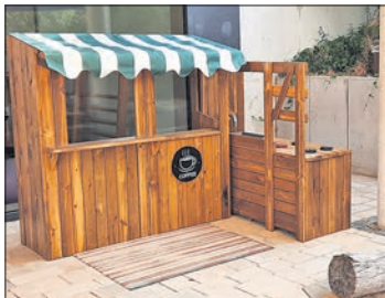
Snackbar mit Küche in der Zwergenburg.

Die Kita wurde 2005 als erste Krippe für unter dreijährige Kinder in Eppstein von Müttern und Vätern gegründet. Bis 2012 kümmerte sich der Förderverein um den Betrieb, dann übernahmen die Familiendienste des Deutschen Roten Kreuz. Die Organisation betreibt die Krippe für bis zu 36 Kinder im Alter zwischen drei Monaten