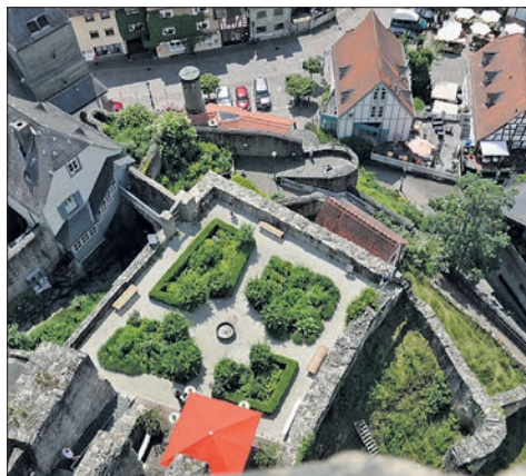
Blick vom Bergfried in den Altangarten.

Verein zur Förderung von Existenzgründungen e.V.