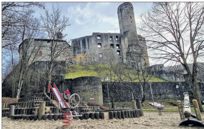
Der Spielplatz in der derzeitigen Ausgestaltung.

aus dem Stadtgebiet. „Ich freue mich, dass eine ortsansässige Firma den Auftrag ausführen wird“, so Bürgermeister Alexander Simon. Die Baukosten betragen rund 180000 Euro, die Planungskosten rund 20000 Euro. Aus dem Landesprogramm Zukunft Innenstadt gibt es eine Zuwendung in Höhe von 85000 Euro. Die Spielgeräte sind bereits bestellt. Wegen einer hohen Produktionsauslastung und Lieferschwierigkeiten bei der Spielgerätefirma, können die Geräte nicht mehr in diesem Jahr geliefert werden. Der Spielplatzneubau wird im Frühjahr 2024 beginnen. „Den Wunsch der Kinder werden wir erfüllen: wir bauen eine neue Ritterburg in Eppstein“, so der Bürgermeister.