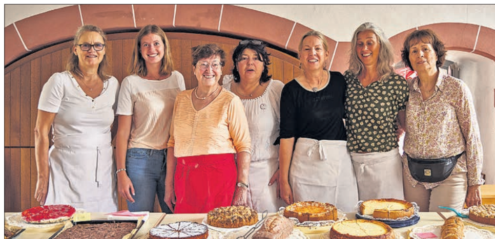
Ein Garant für gute Einnahmen ist das Kuchenbuffet in der Kemenate. Dafür sorgen die vielen Kuchenbäckerinnen und das erfahrene Thekenteam.