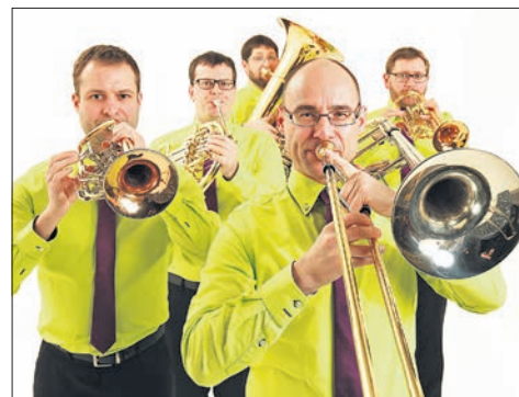
Konzert von emBRASSment in der Kirche St. Michael Niederjosbach

Der Eintritt zum Konzert in der Talkirche ist frei. Die Veranstalter freuen sich über Spenden für die Musiker.