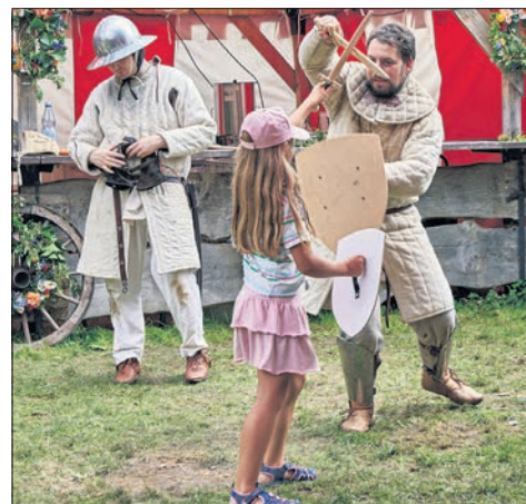
Im Ritterlager im Ostzwinger durften die Kinder Schwert und Schild ausprobieren.