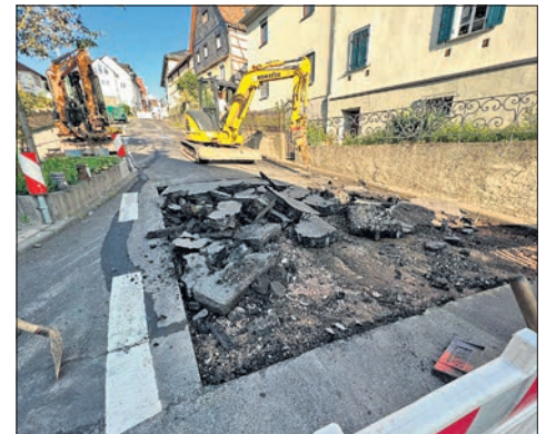
Oberflächenansanierung in der unteren Wiesbadener Straße.

Durch diese gemeinsame Anstrengung von Stadt und Land sollen die Verkehrssicherheit und die Qualität der Straße bis zur geplanten umfassenden Erneuerung sichergestellt werden. Die Stadt Eppstein ist dankbar, dass