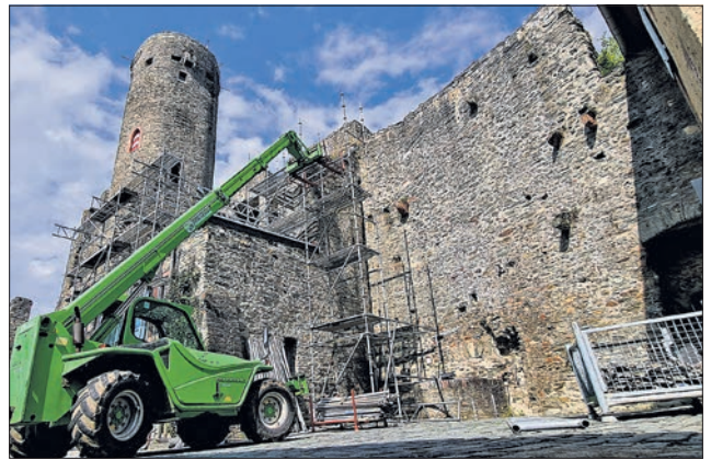
Aufbau des Gerüsts im Burghof.

Die Arbeiten vom Innenhof aus sollen in diesem Jahr abgeschlossen werden. Im nächsten Jahr finden die Arbeiten an der Außenseite