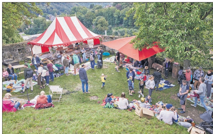
Mit 17 Anbietern war der Kinderflohmarkt am Sonntagmorgen im Ostzwinger gut bestückt.