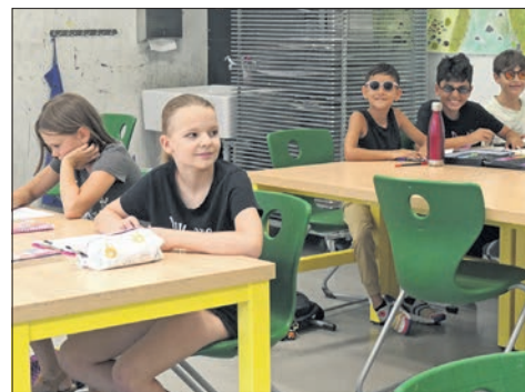
Mangas Zeichnen war Thema eines Workshops in der Freiherr-vom-Stein-Schule.

Im Herbst, verrät Kunz, feiert die Zwergenburg ihr zehnjähriges Bestehen mit einem Laternenfest. bpa