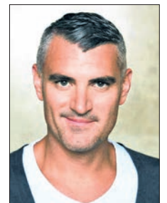
Tim Frühling

Alle Veranstaltungen beginnen um 19.30 Uhr. Der Eintritt kostet 8 Euro, mit Weinprobe am 27. Oktober 13 Euro. Mitglieder des Kulturkreises erhalten eine Ermäßigung. Veranstalter sind der Kulturkreis und die Stadt Eppstein.