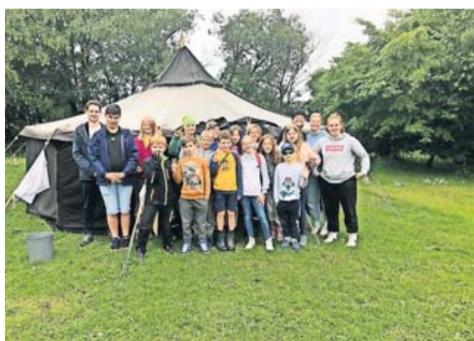
Abenteuer und Spaß im Zeltlager.