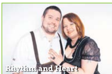
Rhythm and Heart