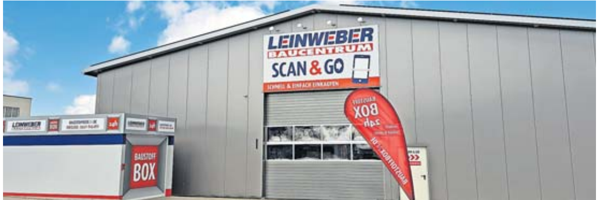
Der neue Markt in Hünfeld befindet sich in der Industriestraße 15.

Baumaterialien einkaufen ist nun noch schneller und einfacher. Nach der erfolgreichen Eröffnung in Petersberg im April diesen Jahres und der positiven Resonanz unserer Kundschaft, eröffnen wir zum 1. September einen weiteren Markt in Hünfeld in der Industriestraße 15. Wir laden Sie herzlich zur Neueröffnung am 1. und 2. September in Hünfeld ein. An diesen Tagen gibt es Essen und Trinken