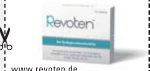
Abbildung Betroffenen nachempfunden REVOTEN. Wirkstoffe: Acidum silicicum Trit. D4, Calcium carbonicum Hahnemannii Trit. D4. Die Anwendungsgebiete entsprechen den homöopathischen Arzneimittelbildern. Dazu gehört: Bindegewebsschwäche. www.revoten.de • Zu Risiken und Nebenwirkungen lesen Sie die Packungsbeilage und fragen Sie Ihren Arzt oder Apotheker. • Remitan GmbH, 82166 Gräfelfing

Für Ihre Apotheke: Revoten Tabletten (PZN 18405588)