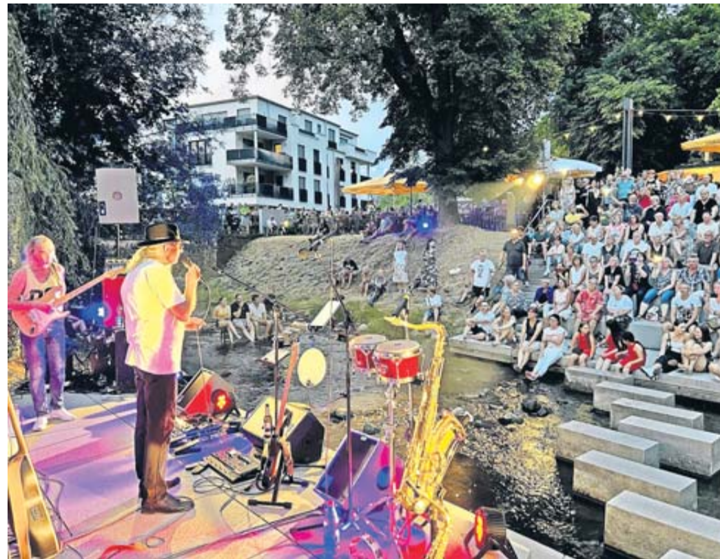
Die Künstler begeistern das Publikum.