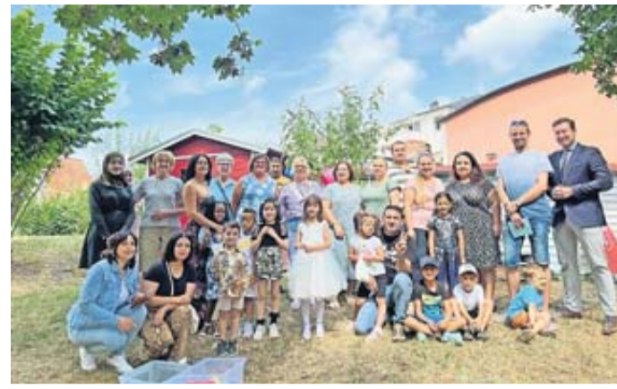
Gelebte Vielfalt beim Sommerfest im Kindergarten Weitzelstraße.

Buntes Sommerfest im Kindergarten Weitzelstraße