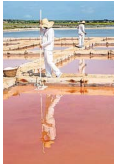
Arbeit in praller Sonne: Salzwerker in den Salinen von Es Trenc bei der Ernte der «Salzblume».

Warum selbst in der Hauptsaison kaum etwas los ist, liegt nicht an Corona und erklärt sich recht einfach: Die wirklich schönen Strände sind nur zu Fuß erreichbar. Un-