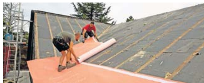
Ältere Dächer sollten regelmäßig überprüft und bei Bedarf instand gesetzt werden, bevor es beim nächsten Sturm zu teuren Schäden kommt.

Der erste und wichtigste Schutzschild des Zuhauses gegen die Unbilden der Witterung stellt das Dach dar. Über mehrere Jahrzehnte der Nutzung ist es jederzeit allen Wetterbedingungen von sengender Hitze bis Frost, von intensiver UV-Einstrahlung bis zu Starkregen, Hagel und Schnee ausgesetzt. Die