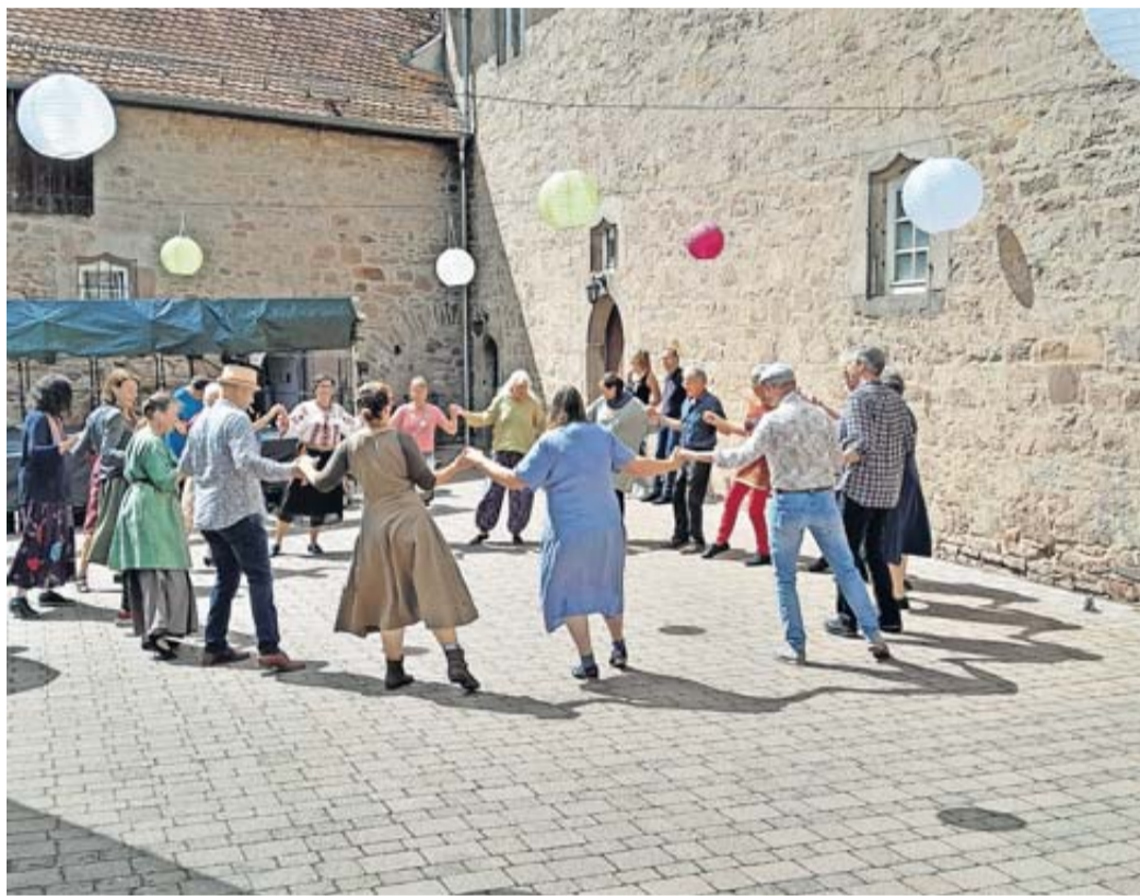
Beim Märchensonntag wurde auch getanzt.

Steinau. Ein sonniges Intermezzo nutzte die Internationale Tanzgruppe „Spirit of Dance“ aus Vollmerz. Sie zeigte Tänze aus der Bretagne, Rumänien, Israel und Libanon, sowie auch Roma und Klezmer Stücke, und luden das Publikum, inklusive Tänzer der neuen Salmünsterer Gruppe, zum mittanzen ein. Wetterbedingt ging es dann im Marstallgebäude weiter, wo alle viel Spaß hatten. Im Wechsel trat auch die Renaissance-Tanzgruppe auf, die das Publikum mit einer Auswahl historischen Tänze erfreute. Wer Interesse hat, die Vielfalt der internationalen Kreistänze kennen zu lernen, kann sich gerne an Tanzleiterin Carola Fischer wenden (Tel. 06664-8246). Leiterin der Renaissance-Tanzgruppe ist Gertraud Klätte (Tel. 06056-3194). Neue Teilnehmer sind bei allen Gruppen willkommen.