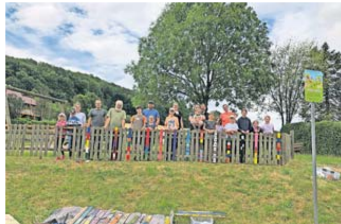
Alle Helfer auf dem Spielplatz des DGH Klosterhöfe vereint.

Ortsbeirat lädt zur Verschönerungsaktion