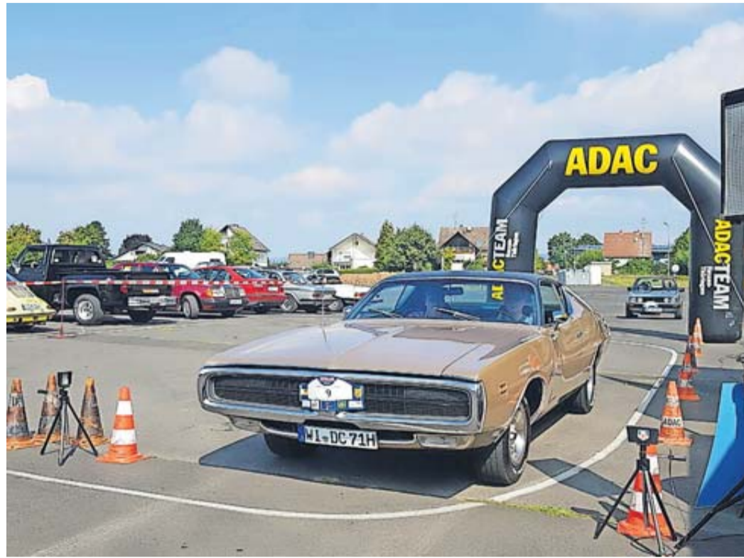
Sowohl Autofahrer als auch Besucher werden auf ihre Kosten kommen.

Das Nenngeld in Höhe von mindestens 40 Euro pro Fahrzeug wird zu 100 Prozent der Hilfe für krebskranke Kinder Frankfurt gespendet. Im Nenngeld sind für alle Teilnehmenden ein Frühstück und alle Fahrtunterlagen enthalten. Auf eine Wertung und Ehrenpreise wird verzichtet. Anmeldungen zur Benefiz-Sternfahrt werden gerne noch bis zum 3. September