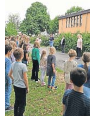
Die Kinder präsentierten stolz die Tänze.

Im Anschluss folgte die große Abschlussshow. Zwei Stunden hatten die Gruppen Zeit um ihre Auftritte vorzubereiten: Von der „Jim-Knopf-Moden-