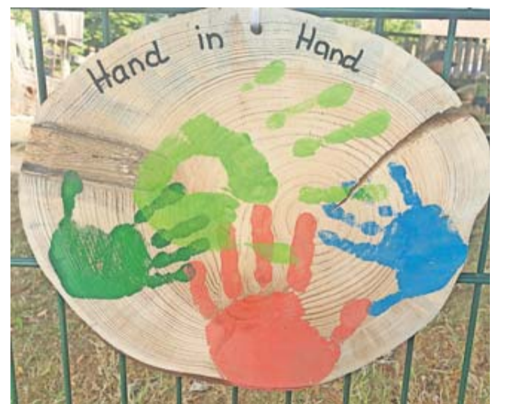
Eine der bemalten Holz-scheiben.

Kitas und Grundschule arbeiten in Münzenberg künftig noch enger zusammen