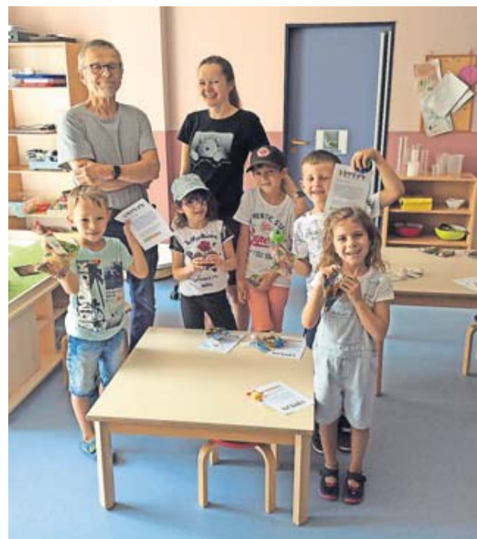
Übergabe an die Kinder.

Weltladen Bad Nauheim überrascht Vorschulkinder