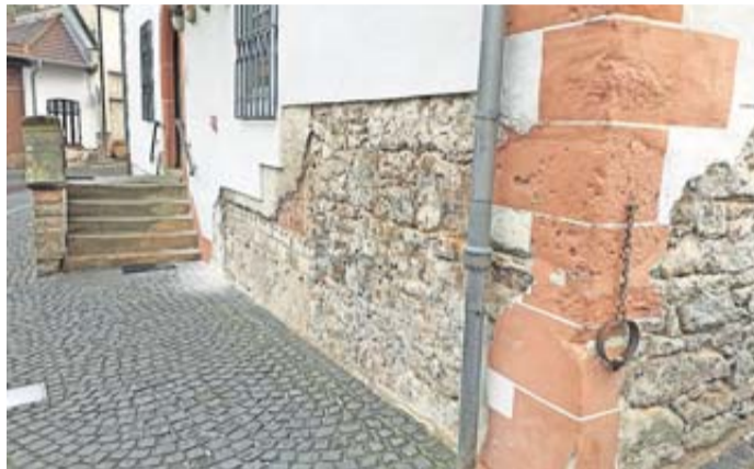
Der schadhafte Putz an der Außenwand des historischen Rathauses Münzenberg ist entfernt. Vor dem Neuauftrag muss das Mauerwerk jetzt erst einmal trocknen.

Jetzt sind die nötigen Renovierungen in vollem Gange. Die zweiadrig Elektrik kommt raus, neue Sanitäranlagen kommen rein und auch die in die Jahre gekommene Küche wird ersetzt. Eine dauerhafte Lösung für die in den Außenwänden festgestellte Feuchtigkeit wird es leider nicht geben – doch das Ziel ist eine Verbesserung des aktuellen Zustands. Ein Problem hier ist allerdings die Lage des