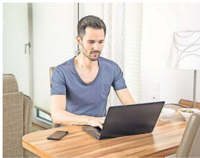
Bloß nicht ins Bockshorn jagen lassen: Zahlungsaufforderungen von der Finanzverwaltung kommen nicht per E-Mail.

Phishing: Gefälschte E-Mails unterstellen Steuerbetrug