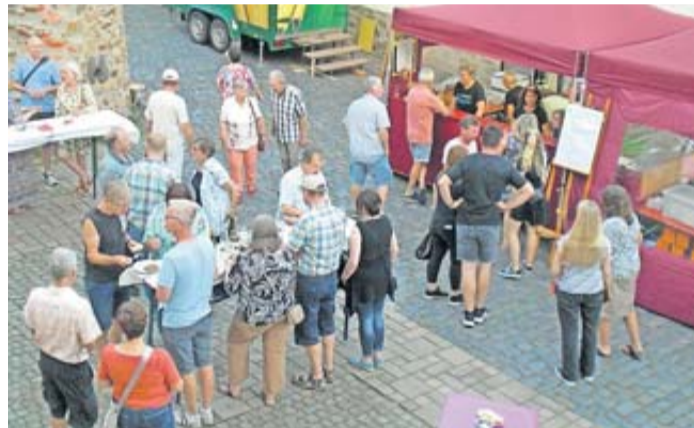
Im Burghof herrschte sehr gute Stimmung.

Rockenberg (js). Das Weinfest des Gesangsvereins „Concordia“ Rockenberg ist nun schon seit vielen Jahren ein fester Termin für alle Liebhaber guten Weines und guten Essens. Kürzlich war es wieder soweit. Bei herrlichem Sommerwetter kamen die Besucher am vergangenen Samstagabend in den Burghof nach Rockenberg. Es gab gute und edle Weine wie Riesling, Grauburgunder, Chardonnay, Portugieser, Rivaner und Dornfelder sowie Longdrinks, Licher Bier und verschiedene alkoholfreie Getränke. Als Snack konnte man Käsewürfel und Weintrauben oder eine Brezel wählen. Als Besonderheit