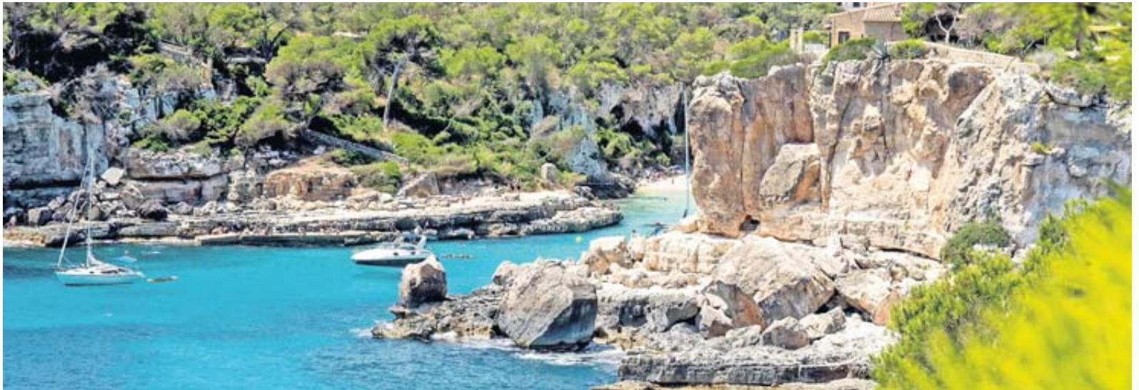
Küstenstrich südwestlich von Cala Santanyi: Mallorcas Südspitze ist vielerorts noch recht ursprünglich.