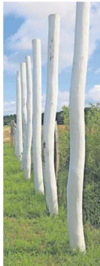
Als Landmarke kennzeichnen weiß gekalkte Stämme den Verlauf des östlichen Wetteraulimes.

Auch in Echzeller Gemarckung lag ein Kleinkastell direkt am Limes, während sich das 5,4 Hektar große Alenkastell mit einer Besatzung von 1000 Mann etwas abgesetzt am Nordwestrand des heutigen Ortes befand. Die zugehörige zivile Siedlung, der Vicus, ist heute weitgehend überbaut. Direkt hier auf den unterirdischen Resten des römischen Ortes steht die „Echzeller Iupitersäule“. Die Säule wurde von einem ehemaligen römischen Soldaten gestiftet, der in der Reitereinheit Ala Indiana seinen Dienst tat. Bei den Soldaten, die für die Bewachung des Limes zuständig waren, handelte es sich um sogenannte Hilfstruppen. Die Legionäre waren in großen Standlagern, in unserem Fall in Mainz, der Provinzhauptstadt von Obergermanien, stationiert. Gut zu un-