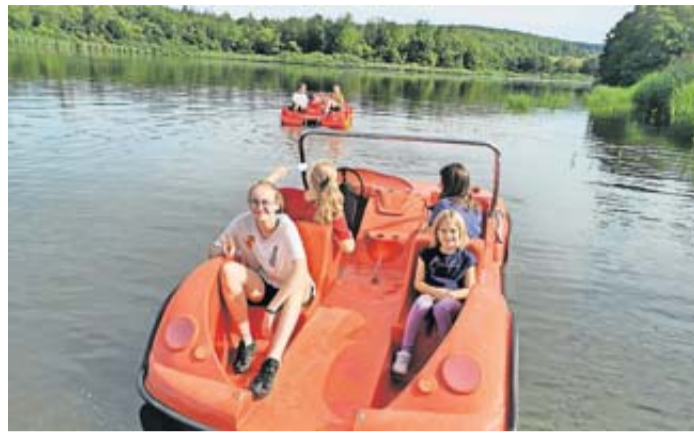
Tretbootfahrt auf dem Gederner See.