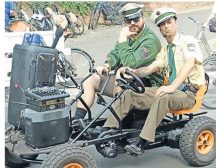
Die Comedy Polizei auf Streife.

Besonders erfreut zeigten sich die Veranstalter, dass es in diesem Jahr trotz des großen Zuspruchs auf der Strecke ohne große Zwischenfälle abließ. Bis auf ein paar harmlose Stürze oder Kreislaufbeschwerden hatten die Rettungskräfte keine besonderen Einsätze im Zusammenhang mit dem Radlersonntag. Auch die Polizei sprach von einem „normalen Verlauf ohne Auffälligkeiten“. Insgesamt 66 Beamtinnen und Beamte hatten an diesem Tag die Strecke gesichert.