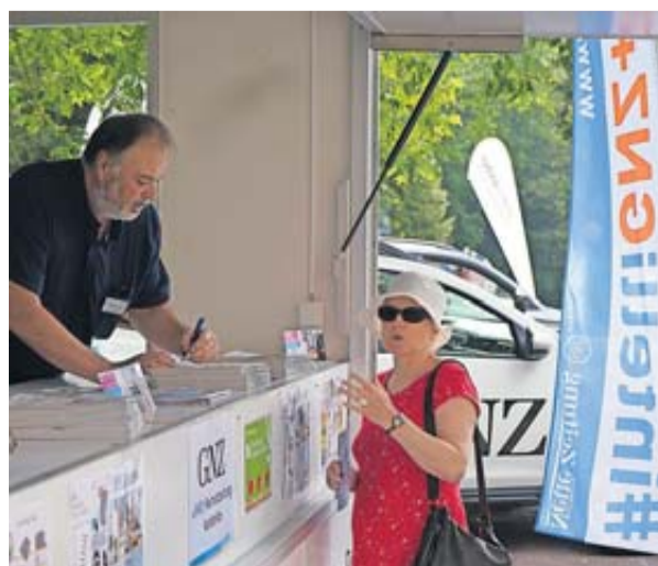
Die GNZ in eigener Sache: Probeabo gefällig?