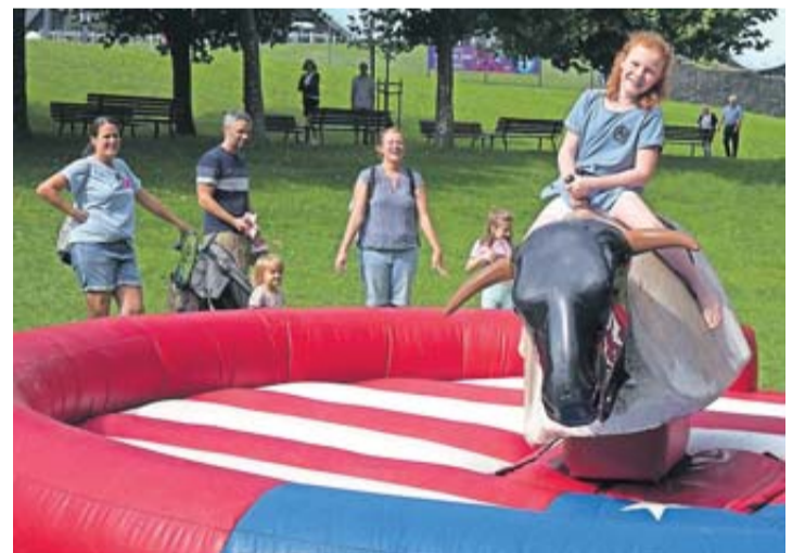
Den Stier beim „Kunterbunten Kinderzelt“ bei den Hörnern gepackt.