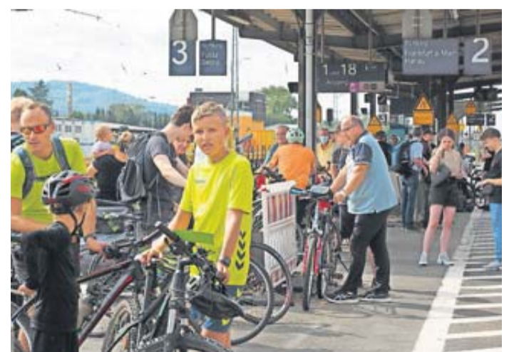
Warten auf den Sonderzug Richtung Sterbfritz.