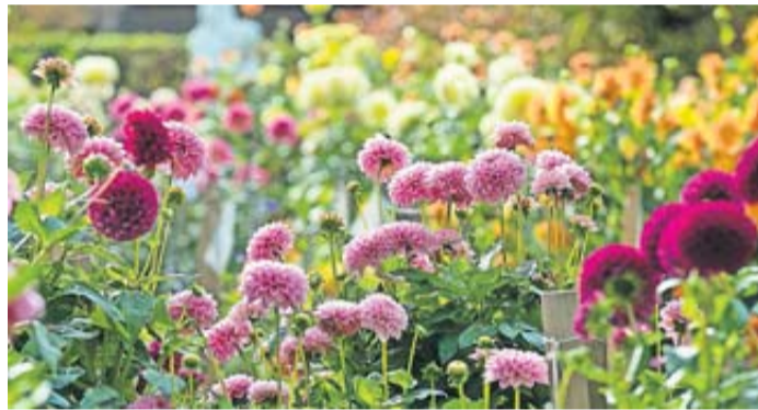
Dahliengarten in Fulda.

Fulda. Der kleine, etwas versteckte Dahliengarten ist schon seit 1994 ein Geheimtipp zur Blütezeit der Dahlien. Dieses Jahr potenzieren am 9. September, in der Zeit von 16 bis 22 Uhr lateinamerikanische Drinks, Fingerfood und Latin-Musik die Wirkung der exotischen Schönheiten - ein Fest der herbstlichen Farbenpracht und noch mehr. Mit der Band Conexión Cubana kommt am Samstag eine wirkliche Größe des Genre Latin-Musik mit überschäumender Lebensfreude und dem traditionellen Son Cubano nach Fulda. Dazu ein passendes Rahmenprogramm: Ab 16 Uhr: Drinks, Fingerfood, Kaffee (Kunstver-