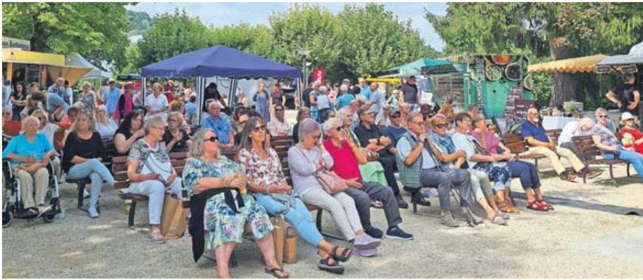
Vor der Bühne genossen die Zuschauer die musikalischen Darbietungen.