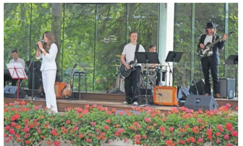
Am Vormittag stand die Band „Iconic Iron“ auf der Bühne.