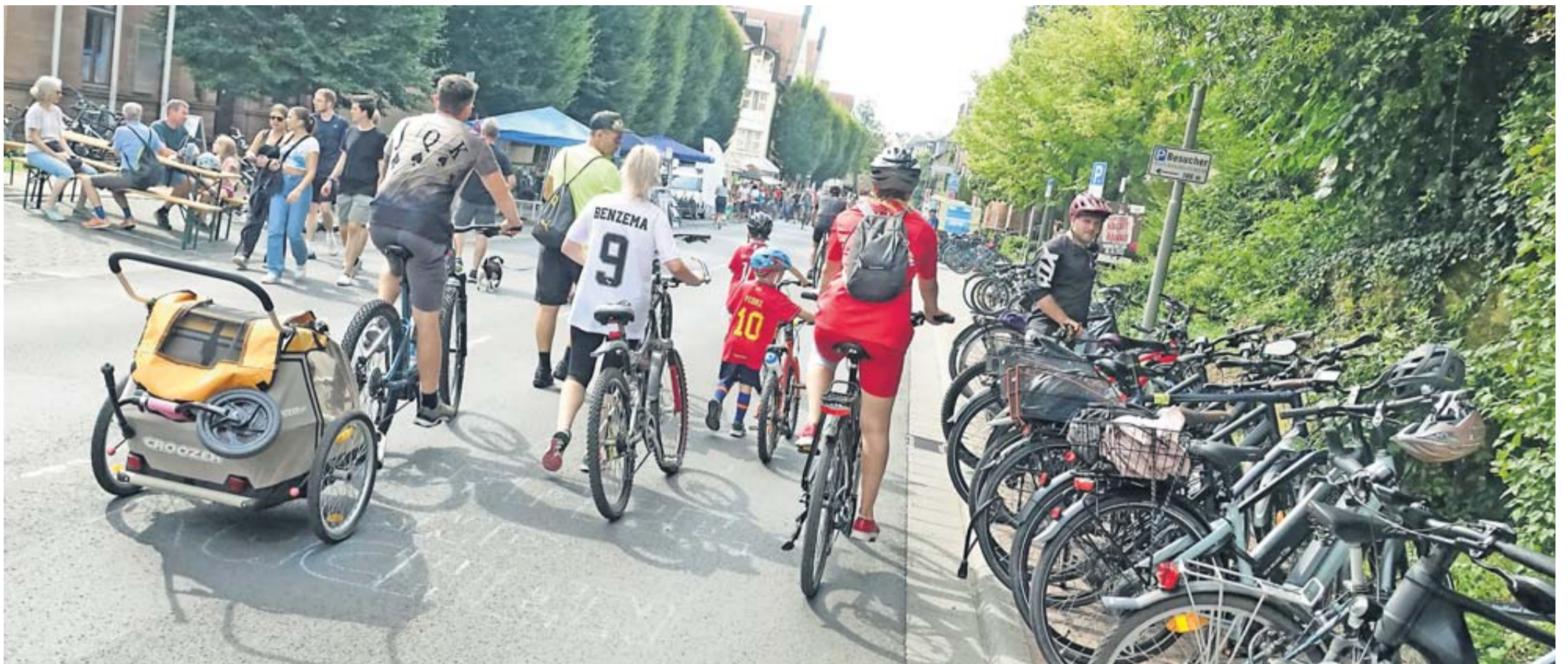
Radler auf der Barbarossastraße.