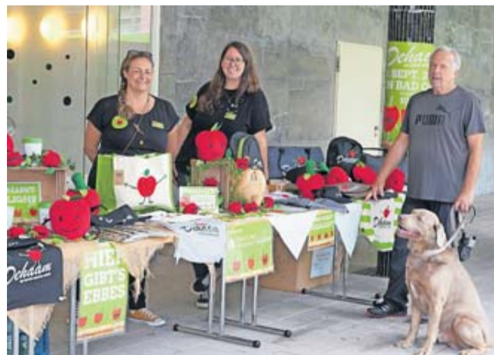
Das Äpfelchen Schorsch gibt es in zahlreichen Variationen.