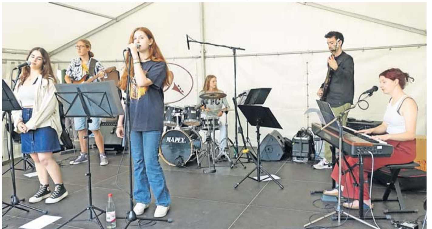
Schüler der Musikschule Main-Kinzig auf der Bühne.

In Gelnhausen war rund um das Main-Kinzig-Forum wieder das traditionelle Angebot an Verpflegung, Information und Live-Musik zu finden.