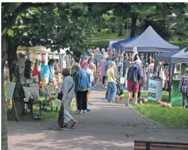
Perfektes Ambiente im Kurpark.