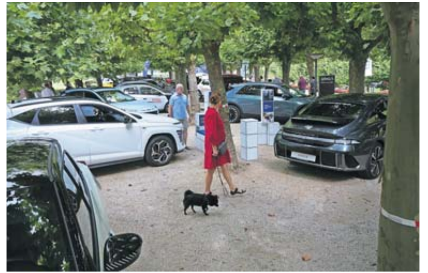
Unter den Platanen reihten sich schicke Karossen aneinander.