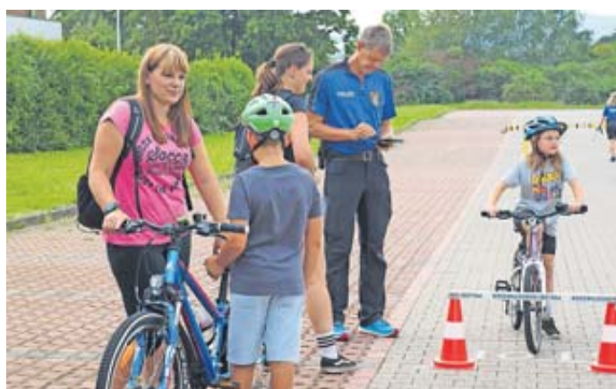
Mobile Verkehrserziehung am Lidl-Parkplatz.