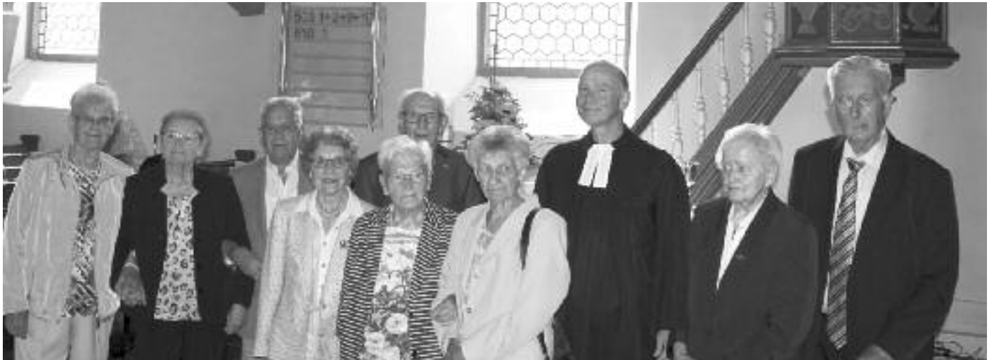
Bild unten quer: die Kronjuwelenkonfirmanden Bild ganz unten rechts: die Diamantenen Konfirmanden

Jubelkonfirmation in Lichenroth am 10.09.23