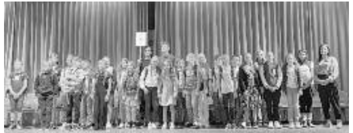
Foto: die Klasse 5k (eine unserer iPad-Klassen)

Weitere wichtige Personen seien die neuen Klassenlehrer/innen, die die Kinder auf „ihrer Reiseroute“ unterstützen. Gemeinsam mit den Klassenpaten/innen aus den höheren Jahrgangsstufen werden die Klassenlehrer/innen den Kindern helfen, die gestellten Aufgaben erfolgreich zu meistern. So sollen die Kinder einerseits lernen, selbstständig zu arbeiten, aber auch mit anderen zu kooperieren und im Team zu arbeiten.