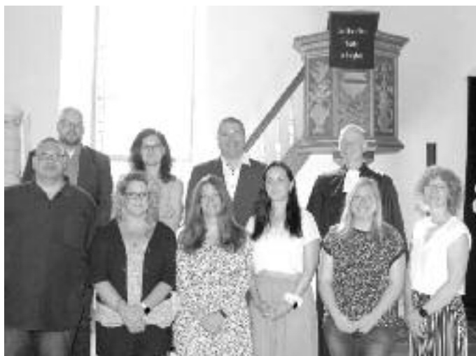
Foto unten: die Silbernen Konfirmanden, Diamantenen und Kronjuwelenkonfirmanden auf Seite 15.

Jubelkonfirmation in Lichenroth am 10.09.23: Am 10.09.23 wurde Jubiläumskonfirmation in Lichenroth gefeiert. Die Silbernen Konfirmanden schauten auf 25 Jahre zurück, die Diamantenen Konfirmanden auf immerhin 60 Jahre. Goldene Konfirmanden gab es nicht, weil damals die wenigen Konfirmanden dem späteren Jahrgang zugeordnet wurden. Die ca. 89-jährigen Kronjuwelen-Konfirmanden stellten immerhin eine Gruppe neun Mitgliedern. Die Jubilare wurden gesegnet und feierten miteinander das Abendmahl.