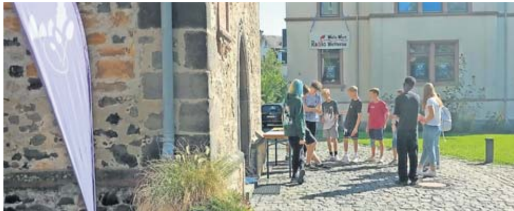
Die Innenstadtentwicklung sowie Kinder- und Jugendrechte waren Thema beim Konfi-Tag der Markus-Gemeinde.