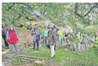
Nach dem heftigen Regenschauer geht es weiter durch den Taunus.

Eine mehrstündige Wanderung in die Umgebung der Saalburg mit einen Wanderführer des Naturparks Taunus war geplant. Nach einem längeren Anstieg erreicht man den Herzberg. Bei guter Sicht sah man eine schwarze Wolkenwand rasch nahen. Kurzentschlossen entschied man sich, das Unwetter dort abzuwarten. Als es nur noch tröpfelte, machte man sich über den Marmorstein, eine imposante Felsformation mit guter Aussicht, auf den Rückweg. Mit vielen neuen Eindrücken begab man sich nach einem interessanten Tag auf den Heimweg.