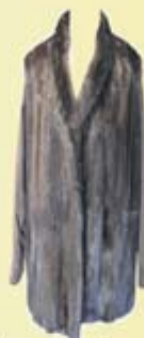
Pelze aller Art