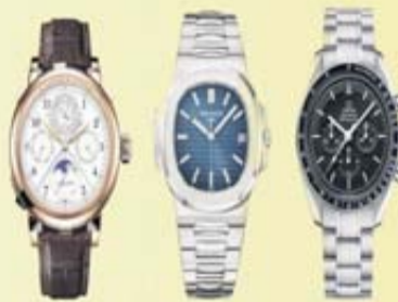
Armbanduhren & Taschenuhren