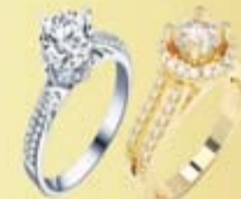
Schmuck & Ringe