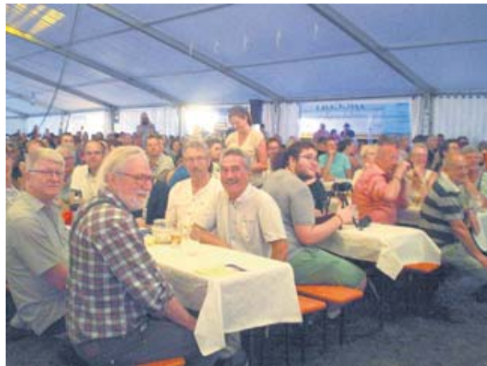
Das Festzelt war am Samstagabend komplett gefüllt.

Denn die Vereinsmitglieder hatten alles getan, was einen angenehmen Aufenthalt auf dem Kneiben garantierte. Neben allen Annehmlichkeiten in dem großen Festzelt selbst befand sich auf dem Gelände davor, wie es ja Tradition ist, ein gut bestückter Vergnügungspark, der allen Ansprüchen der Besucher, ob Jung oder Alt, gerecht wurde. Hier bot sich für Mama und Papa, Oma und Opa die Gelegen-