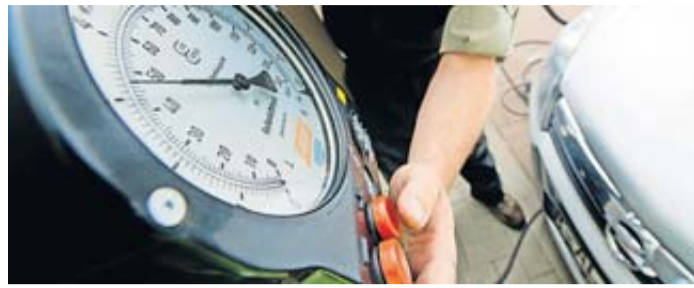
Regelmäßige Handgriffe: Den korrekten Luftdruck aller vier Reifen und dem Reserverad an Bord kontrollieren Autofahrer besser routinemäßig und passen ihn der Ladung entsprechend an.

Wie viel bei welcher Beladung in die vorderen und hinteren Pneu gepumpt werden muss, lässt sich je nach Automodell an unterschiedlichen Stellen ablesen. Oft ist eine Reifendrucktabelle an der B-Säule der Fahrerseite oder an der In-