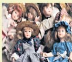
Porzellan & Sammler Puppen