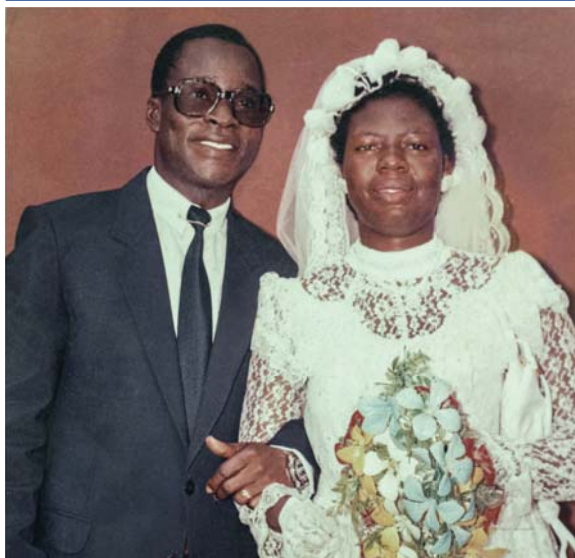
Am Tag unserer Heirat (1988)

Kurz darauf kehrte ich ins Zweigbüro nach Sierra Leone zurück und informierte die Brüder über die Entscheidung des Ministers. Sie waren außer sich vor Freude, als sie hörten, dass Jehova meiner Reise so großen Erfolg geschenkt hatte. Ich hatte die Aufenthaltsgenehmigung für Guinea bekommen!