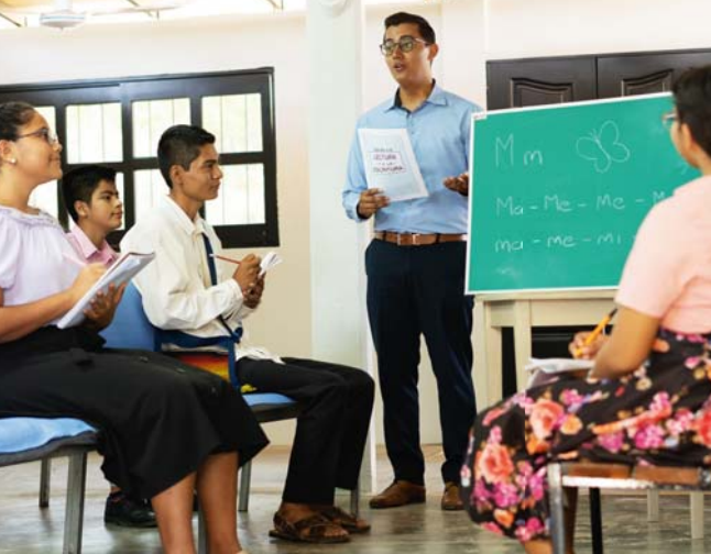
Gut lesen und schreiben zu können kommt dir und der Versammlung zugute (Siehe Absatz 10, 11)

7 Denkfähigkeit wirkt sich auch auf deine äußere Erscheinung aus. Die Modewelt wird stark von Menschen beeinflusst, die keine Achtung vor Jehova haben oder ein unmoralisches Leben führen. Ihre Denkweise spiegelt sich in Modedekorationen wider, die sehr eng sitzen oder Männer feminin wirken lassen. Ein junger Mann, der auf christliche Reife hinarbeitet, wird sich bei der Kleiderwahl von biblischen Grundsätzen leiten lassen und sich an Vorbildern in der Versammlung orientieren. Frag dich doch einmal: Zeigen meine Entscheidungen auf diesem Gebiet, dass ich gutes Urteilsvermögen besitze und auf andere Rücksicht nehme? Oder können sich Außenstehende aufgrund meines Äußeren nur schwer vorstellen, dass ich ein Zeuge Jehovas bin? (1. Kor. 10:31-33; Tit. 2:6). Ein junger Mann mit Denkfähigkeit gewinnt nicht nur den Respekt seiner Brüder und Schwestern, sondern auch seines himmlischen Vaters.