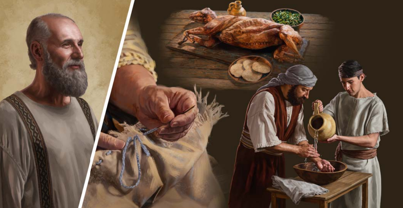
Paulus erklärt den Judenchristen in Rom, dass es auf Glauben und nicht auf das Befolgen des Gesetzes ankommt (Siehe Absatz 10)

9 Aufgrund dieser konträren Positionen sind einige Bibelkommentatoren zu dem Schluss gekommen, dass sich Paulus und Jakobus beim Thema Glaube und Taten widersprechen. Ihrer Ansicht nach ist Paulus der Meinung, ein Mensch werde allein wegen seines Glaubens für gerecht erklärt, während Jakobus den Standpunkt vertrete, für die Anerkennung Gottes seien Taten unerlässlich. Ein Theologieprofessor drückt es wie folgt aus: „Jakobus verstand nicht, warum Paulus so sehr darauf beharrte, dass Rechtfertigung [jemanden für gerecht zu erklären] durch Glauben allein und nicht durch Taten erfolgt.“ Es muss jedoch eine Möglichkeit geben, die beiden Aussagen miteinander in Einklang zu bringen, denn sowohl Paulus als auch Jakobus schrieben ihre Briefe