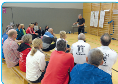
Fachübergreifende Schulung Ski-Konditionstraining für hessische Übungsleiter

Der SCK finanziert die Ausbildung von Übungsleiter/innen unter der Voraussetzung, dass sie sich nach erfolgreichem Lehrgangsabschluss verpflichten, für mind. drei Jahre im Verein tätig zu sein. Fortbildungslehrgänge werden ebenfalls vom Verein finanziell unterstützt. Unsere Übungsleiter/innen nehmen die Aus- und Fortbildungsangebote regelmäßig wahr. In der Vergangenheit konnten wir auch ausgebildete Trainer/innen über die Verbände dafür gewinnen, die Fortbildung exklusiv für das SCK-Team des SCK in