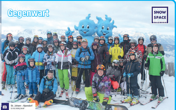
St. Johann - Alpendorf 0330 2009134-67