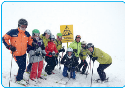
Übungsleiterfortbildung Alpin im Stubaital

Ein vielseitiges Angebot an Sportkursen im alpinen und nordischen Bereich im Schnee sowie im Breitensport bietet der SCK durch ausgebildete Übungsleiter/innen.