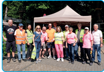
Organisations-Team vom 8. Staufeuflauf

2023 fand der 8. Staufeuflauf ausschließlich als Präsenzlaufl auf der inzwischen bewährten Strecke statt. Zuerst laufen alle die 11 km an der Schwimmbadwiese und Bauhof vorbei, dann hoch zur Gundelhardt, weiter über den Amtsboten-,Chaisenweg, Kleiner