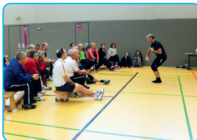
Exklusive Fortbildung für das SCK-Team durch ausgebildete Trainer/innen