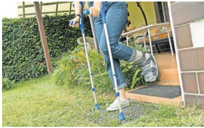
Krücken oder Orthesen landen in vielen Fällen auf dem Dachboden oder im Keller, wenn sie nicht mehr gebraucht werden.

15 Prozent haben der Umfrage zufolge Hilfsmittel verliehen oder verschenkt. Manchmal landen Schienen, Krücken und Co. aber auch einfach im Müll (8 Prozent) oder sie werden verkauft (5 Prozent). In Sachen Nachhaltigkeit ist