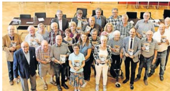
Bei der Vorstellung des Gelnhäuser Heimatjahrbuchs war den Beteiligten die Freude über das gedruckte Ergebnis anzusehen.

Der Heimatkalender wirft aber nicht nur einen genaueren Blick auf die Anfänge des Main-Kinzig-Kreises, er beleuchtet ebenso wieder andere geschichtliche Ereignisse, die sich in der Region rund um Gelnhausen zugetragen haben. So beleuchtet etwa Volker Kirchner das Räuberunwesen im Laufe des 18. Jahrhunderts mit ebenso schrägen wie kriminellen Gestalten.