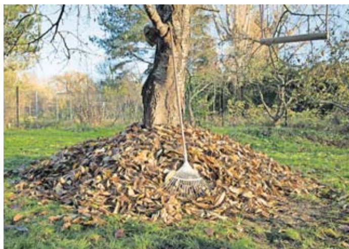
Fällt das Laub, greifen viele beherzt zum Rechen. Landschaftsgärtner empfehlen aber einen gelasseneren Umgang mit dem vermeintlichen Ärgernis.

Herbst bedenken, dass sie für die gefahrlose Nutzung der Gehwege und Bürgersteige an ihrem Grundstück verantwortlich sind. Dazu gehört auch die Beseitigung des rutschigen Herbstlaubs, um die Verkehrssicherheit zu gewährleisten.