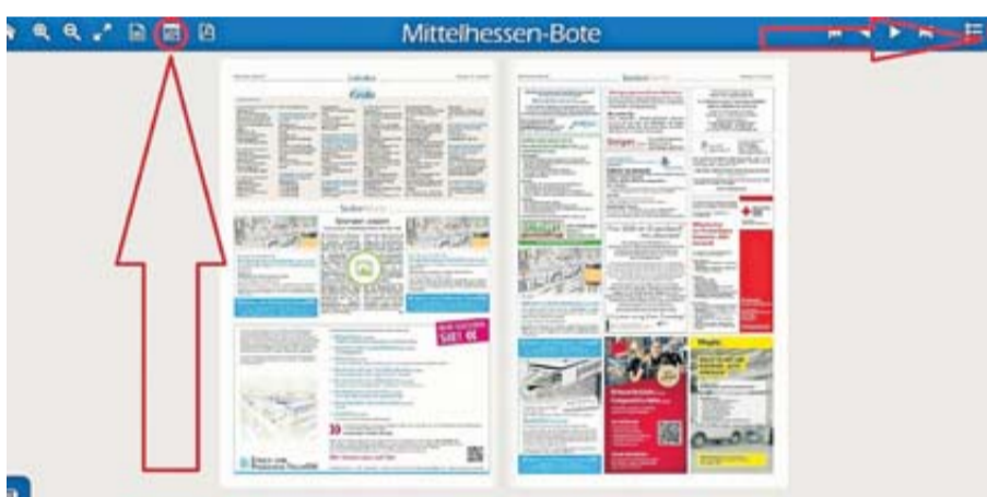
Das E-Paper des BOTEN hat viel zu bieten, wie den Zugriff auf alte Ausgaben über das Kalendersymbol oder die Volltextsuche.

Sie erscheint immer parallel zum gedruckten BOTEN und ist meist – und da sind wir beim ersten Vorteil – früher bei Ihnen als die Print-Version: Die Samstags-Ausgaben können Sie unter www.bote.de schon am Freitag aufrufen. Wenn Sie sich frühzeitig über Angebote in unseren Anzeigen informieren möchten, ist das vielleicht der richtige Weg für Sie, die Nase vorn zu haben.