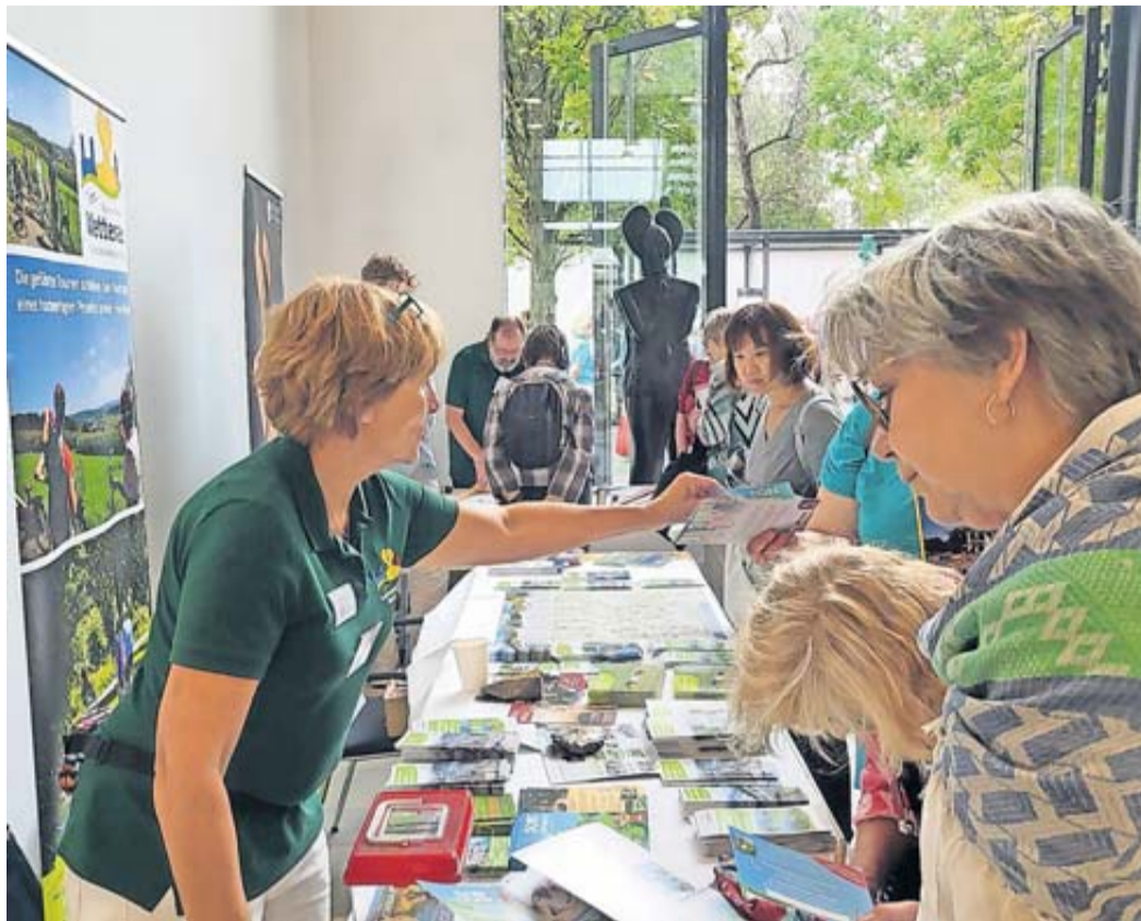
Besucher am Stand der TourismusRegion Wetterau zum Tag der offenen Landesvertretung in Berlin.