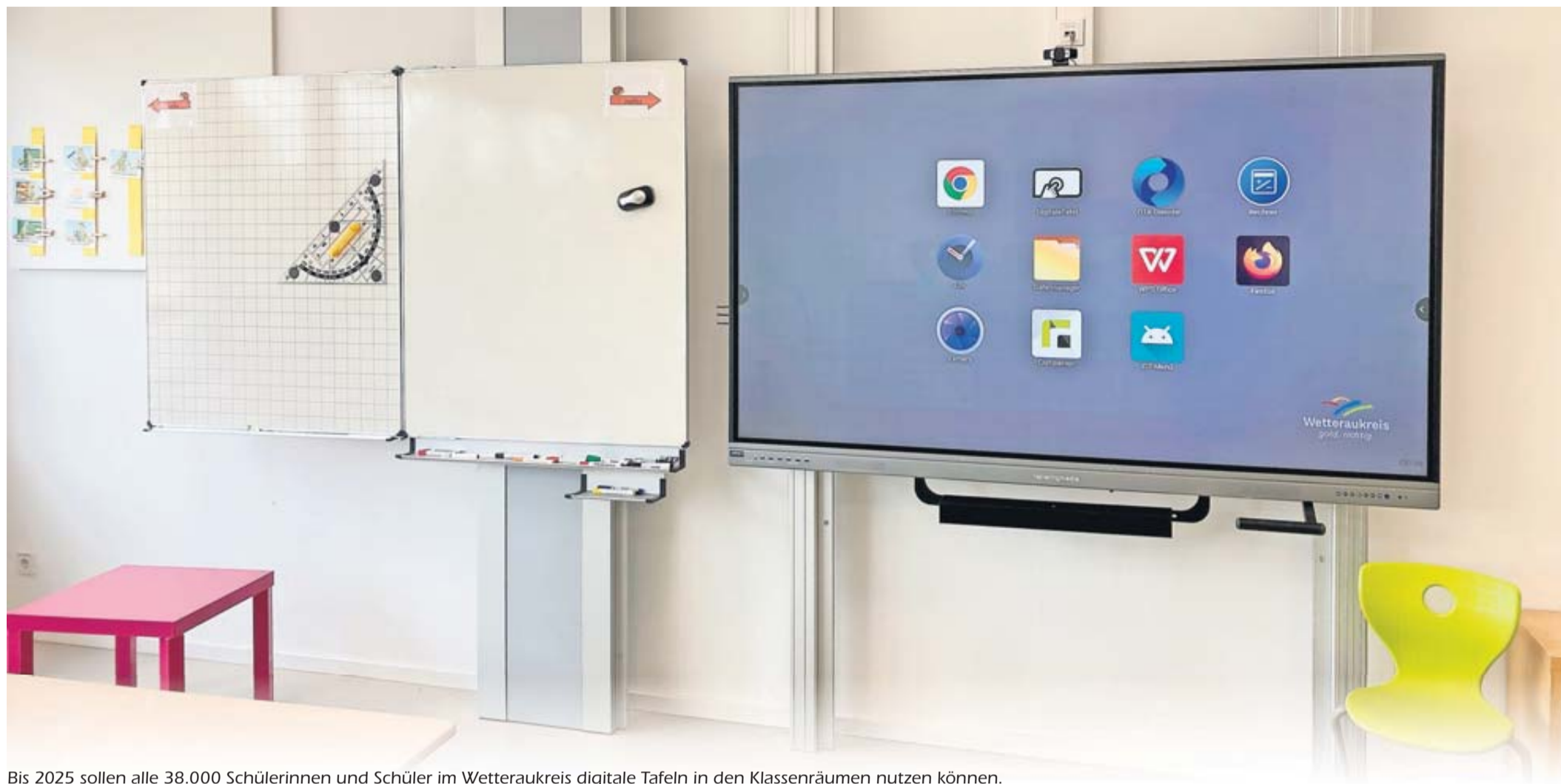
Bis 2025 sollen alle 38.000 Schülerinnen und Schüler im Wetteraukreis digitale Tafeln in den Klassenräumen nutzen können.