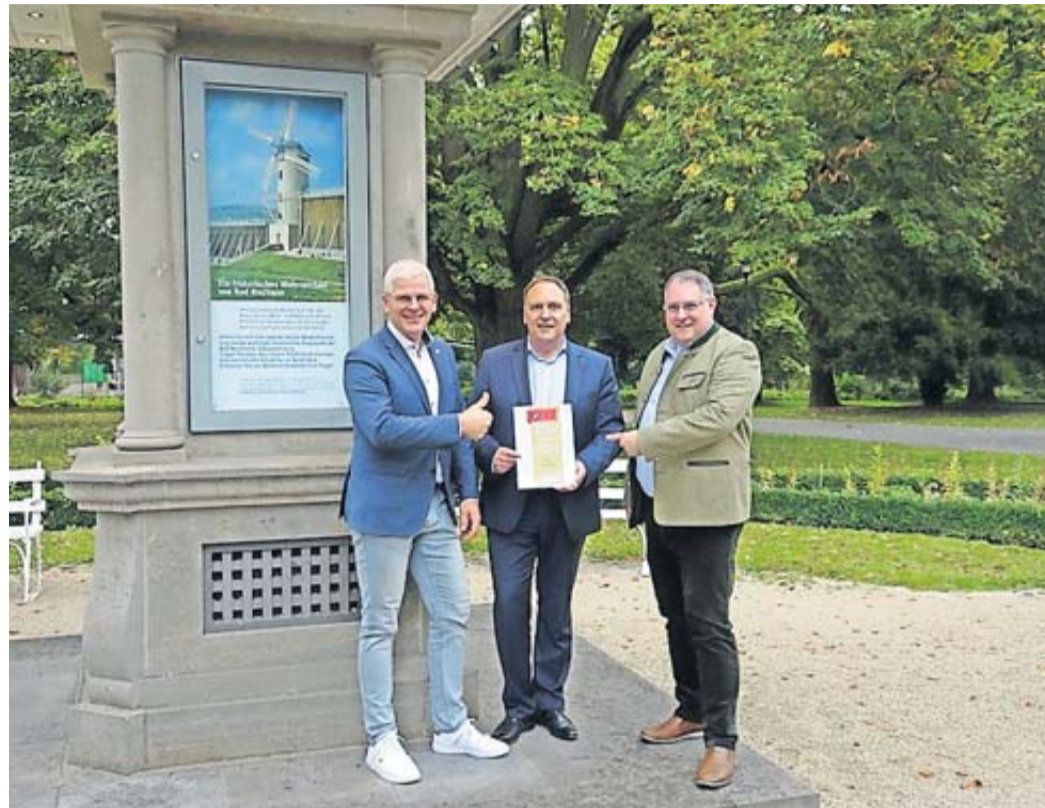
Bad Nauheim erhält erneut das „TOP Kurort“-Siegel für seine hervorragenden Angebote und Therapieeinrichtungen.

„Zum siebten Mal mit dem begehrten Qualitätssiegel ausgezeichnet zu werden, bestätigt die hohe Aufenthaltsqualität in unserer Stadt. Die neue