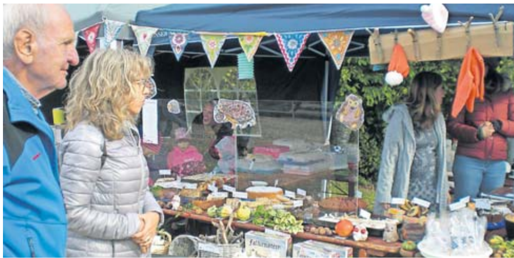
Am Stand des Münzenberger Kindergartens gab es viel Selbstgebackenes sowie Kaffee und Kuchen.

Vielfältige Produktangebote aus der Region