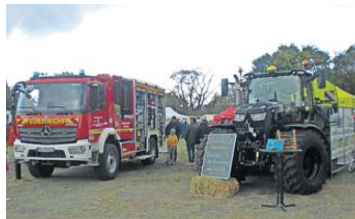
In der Mitte des Festplatzes machten diese zwei großen Fahrzeuge für sich Reklame.

von den Muttis der Kinder selbstgebackenen Kuchen wählen und sich zum Kaffee schmecken lassen. Auch an die Kleinen war gedacht. Sie hatten besonders beim „Hobby Horsing“ viel Spaß. Dabei ritten sie auf Steckenpferden über einen kleinen Parcours. Auch das Büchsenwerfen machte den Kindern viel Freude. Insgesamt war auch dieser zweite Münzenberger Naturmarkt ein voller Erfolg.