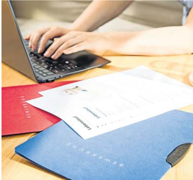
Luftig leicht zu lesen: Der Lebenslauf sollte nicht mit zu vielen Infos vollgestopft werden.

Bewerberinnen und Bewerber schauen sich dazu am besten eine ausgedruckte Version ihres Lebenslaufs an, rät der Coach. Wirkt das Dokument vollgestopft und anstrengend zu erfassen, er-