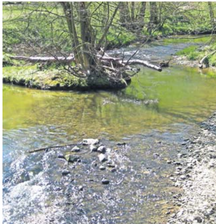
Die Usa bei Ober-Mörlen.

Wetteraukreis. Ende 2021 lag die Gesamtwasserfläche im Wetteraukreis bei 1.341 Hektar und betrug damit vier Hektar mehr als noch zehn Jahre zuvor. Das geht aus der Flächenerhebung des Hessischen Statistischen Landesamts hervor. Während Flussläufe in den 1960er-Jahren zum Zwecke des Hochwasserschutzes aktiv begründet und Auwiesenlandschaften entwässert wurden, sind in den letzten Jahrzehnten vermehrt Anstrengungen zur Renaturierung und Reaktivierung der Auen unternommen worden. Diese tragen in hohem Maße zum Erhalt der heimischen Ökosysteme und der Artenvielfalt in Flora und Fauna bei – und sind damit ein wichtiger Aspekt von Umwelt- und Naturschutz. Der größte Teil