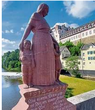
Die Statue ist auf der Steinerne Brücke.