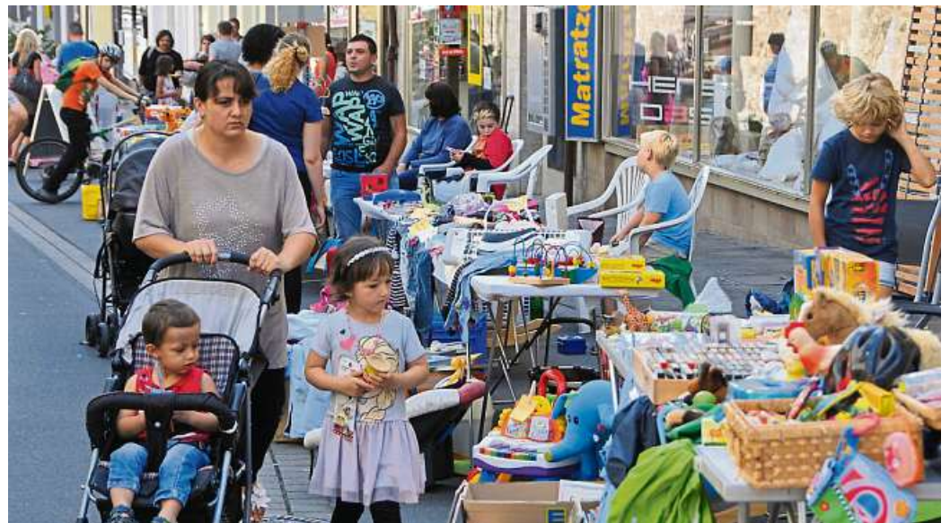
Der Kinderflohmarkt hat das Motto „Kinder für Kinder“.

In der Woche vor der Veranstaltung teilt die Wirtschafts-Werbung Weilburg (WWW) die Standplätze mit und übermittelt weitere organisatorische Infos.