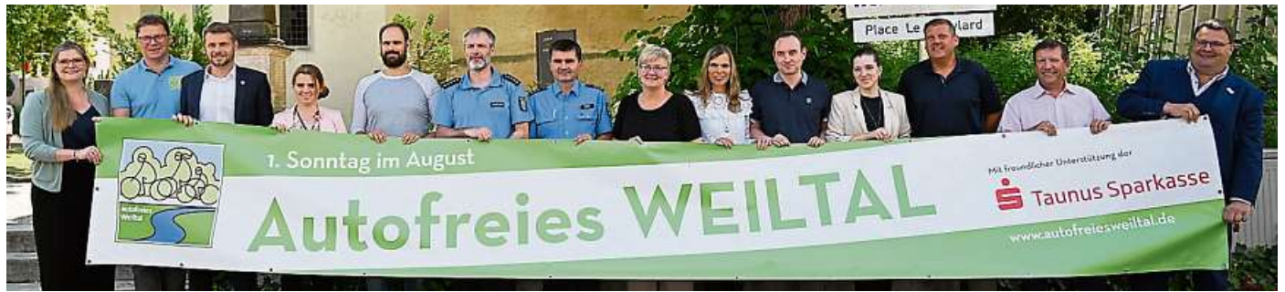
Viele Kommunen und Partner organisieren den 18. Autofreien WeitalSonntag.