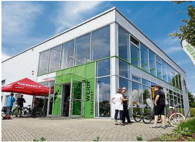
Das Geschäft im Viehweg 23 in Weilburg.

und Ersatzteilen für Klein und Groß zur Seite steht. Als eines der führenden E-Bike-Fachgeschäfte wird seit 2016 eine Servicerundumleistung in Sachen E-Bike angeboten: das „Radsport-Wern-E-Bike-Sorglospaket“ mit drei Jahren Garantie, drei Jahresinspektionen und bevorzugtem Reparaturservice. Dieses ist im Gesamtwert von 299 Euro beim Kauf eines neuen E-Bikes kostenlos im Preis enthalten. Das Fachgeschäft ermöglicht auch Finanzierungsoptionen von bis zu 36 Monatsraten oder Fahrradleasing über mehrere Gesellschaften. Bei technischen Schwierigkeiten mit dem Fahrrad oder E-Bike kann sich jeder an die Zweiradspezialisten wenden. Die Öffnungszeiten sind montags bis freitags von 10 bis 19 Uhr und samstags von 9 bis 14 Uhr. Kontakt: Radsport Wern, Viehweg 23, 35781 Weilburg, Telefon 06471-918841, www.radsport-wern.de