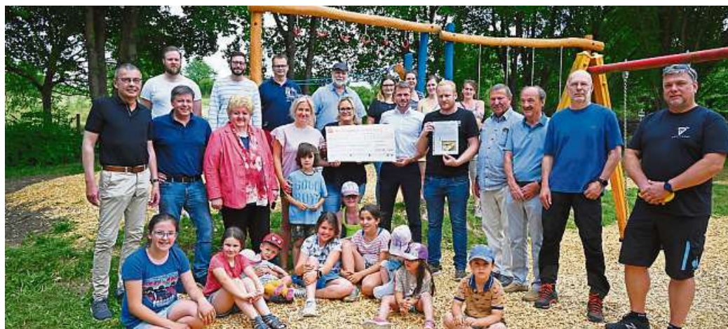
Glückliche Gesichter gab es bei der offiziellen Einweihung des Spielgeräts auf dem Kinderspielplatz in Kirschhofen.