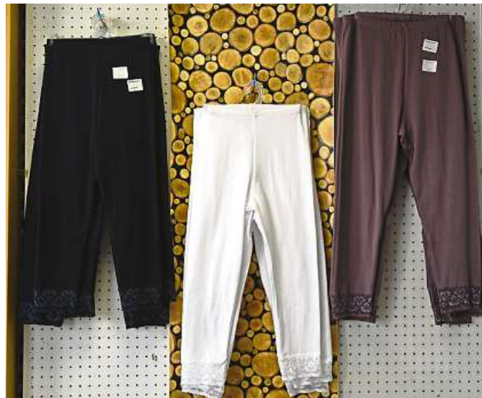
Capri-Leggings mit schönem Spitzenbesatz.