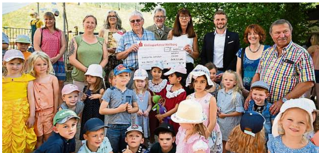
Wenn ein runder Geburtstag ansteht, muss das gebührend gefeiert werden.

Und Spenden gab es auch: So haben sich das Basarteam der Kita „Kuckucksnest“ mit 2000 Euro und der Dorfverein mit 700 Euro an den Kosten beteiligt.