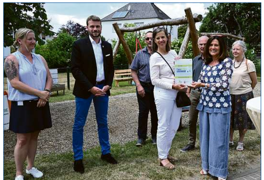
KiTa Sonnenschein Hirschhausen ist als „Faire Kita“ zertifiziert.