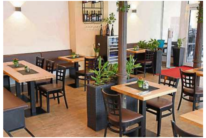
Ein Blick in das Restaurant „Aroma“.