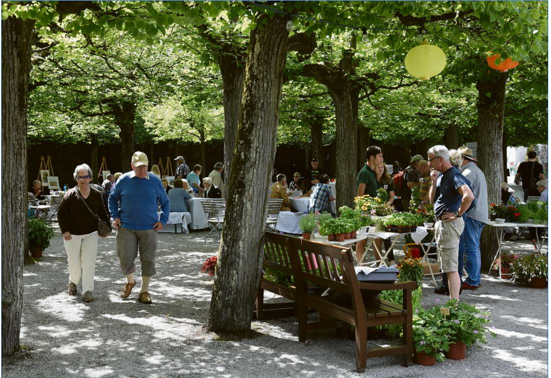
Das „Kleine Fürstliche Gartenfest“ lädt am 8. und 9. Juli in den Weilburger Schlossgarten ein.