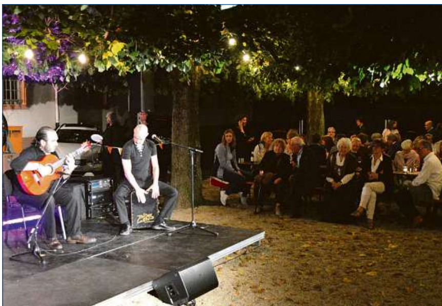
Die letzte Nacht der Weilburger Schlosskonzerte ist am 5. August.