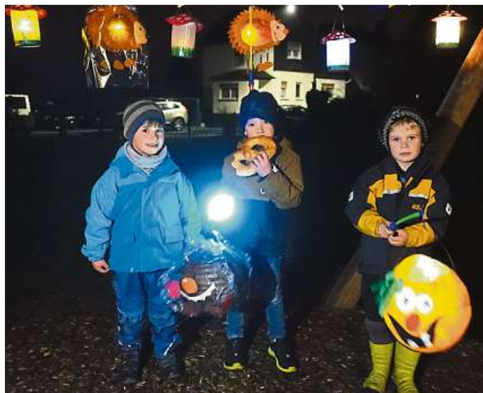
Leuchtende Augen beim Laternenumzug.

(bach). Alljährlich um den 11. November herum ziehen Scharen von Kindern mit bunten Laternen durch die Straßen und singen dabei oft Martins- oder Laternenlieder. Sankt Martin war ein römischer Soldat, der um das Jahr 316 nach Christus geboren wurde. Der Legende nach ritt er an einem kalten Wintertag an einem hungernden und frierenden Bettler vorbei. Der Mann tat ihm so leid, dass Martin mit dem Schwert seinen warmen Mantel teilte und dem Bettler eine Hälfte schenkte. In der Nacht erschien Martin der Bettler im Traum