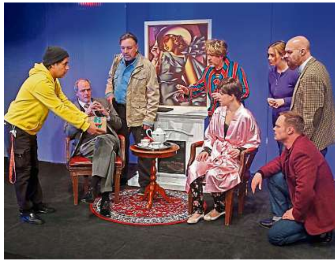
Spannend: Das Paket.