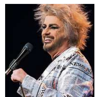
LindenCult - Kay Ray.

Am Sonntag, 26. November, um 20 Uhr ist Stoppok solo angesagt. Der deutschsprachige Singer-/Songwriter und großartige Gitarrist bietet eine Mischung aus Folk, Rock, Rhythm'n' Blues und Country. Er singt mit feinem Humor über die Widrigkeiten des Alltags und als kritischer Betrachter seiner Umwelt. Die Tickets vom letzten Jahr behalten ihre Gültigkeit. Karten an der Abendkasse kosten 30 Euro, im Vorverkauf 28 Euro. Weitere Informationen unter www.lindencult.de .