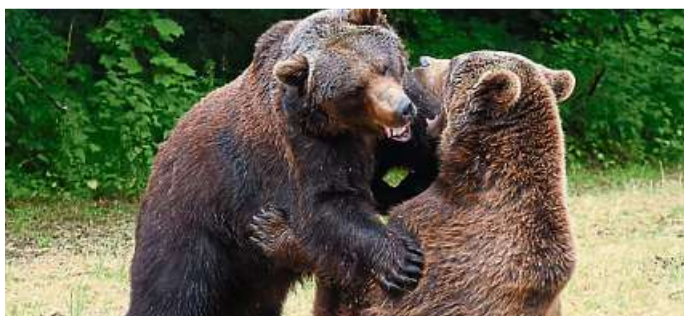
Die beiden Braunbären Tim und Steve beim Spielen.

(red). Zu einem Märchenabend mit dem Wildparkteam wird für Samstag, 18. November, um 17 Uhr in den Weilburger Wildpark „Tiergarten“ eingeladen. Bei einer Laternenwanderung durch den Wildpark gibt es spannende Märchenlesungen an den Gehegen. Am Sonntag, 26. November, steht um 14 Uhr das Thema „Von der Speisekammer des Grafen zum Park für Natur und Mensch“ im Mittelpunkt des spannenden Spaziergangs durch mehr als 400 Jahre Wildpark mit Hans-Peter Schick. Zu erfahren gibt es vieles über die Geschichte des Wildparks, seine Entstehung und anderes mehr. Bei beiden Veranstaltungen gilt der normale Eintrittspreis als Teilnahmegebühr.