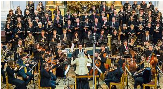
Kantorei Weilburg, Capella Weilburgensis.

Karten zu 45, 38, 30 und 16 Euro (erm. zu 41, 34, 26 und 12 Euro) gibt es beim Verein „Alte Musik im Weilburger Schloss“ e. V. Tel. 06471 – 4541, per Fax an 06471 – 4 10 10, per Mail an info@alte-musik-weilburg.de, sowie an der Tageskasse.