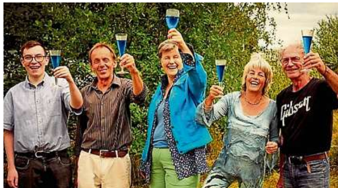
Die Band freut sich auf das Konzert.

Kontakt: Scheune mit dem blauen Dach, Blessenbacherstr. 4, 35796 Weinbach.