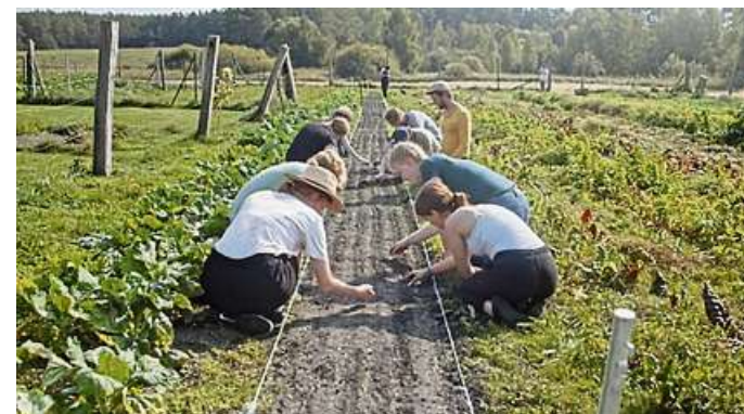
Filmausschnitt aus „Ernte teilen“