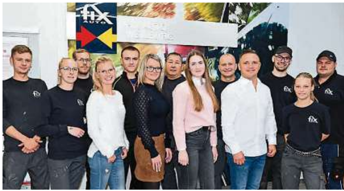
Das Team von Fix Auto Weilburg im Jubiläumsjahr 2023