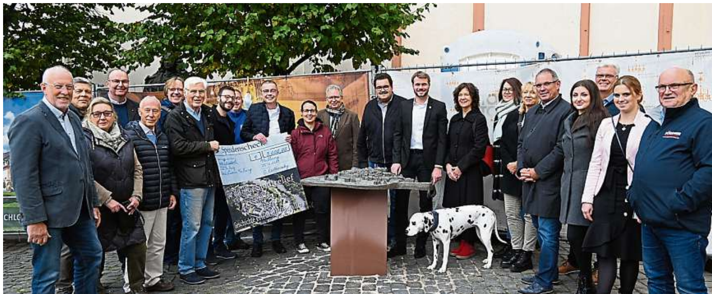
Große Freude bei allen Beteiligten über die neue Attraktion auf dem Marktplatz.

Annahmeschluss für Manuskripte sowie Fotos ist am Mittwoch, 15. November 2023