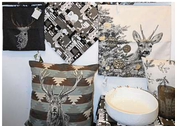
Blick auf attraktive Kissenhüllen.

Kontakt: Hermko, Marktstraße 6, 35781 Weilburg, Telefon 06471-2195.