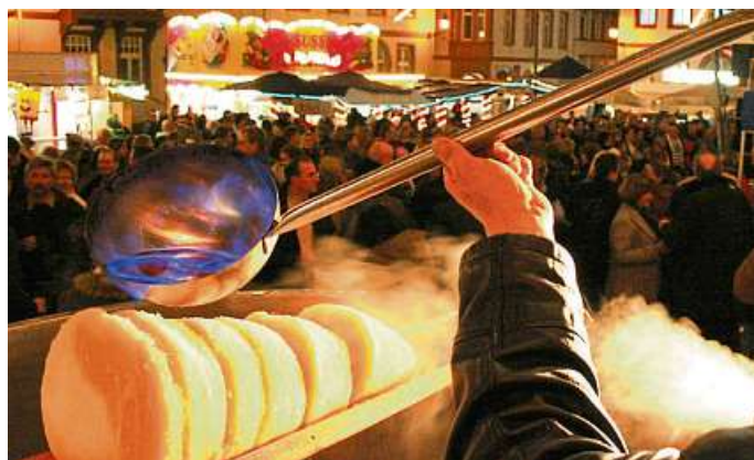
Blick auf eine Feuerzangenbowle auf dem Weilburger Marktplatz.

Gut 1500 Liter misst der riesige Kessel, in den das aromatische Gemisch aus Rotwein, Orangensaft und Rum eingefüllt und dann auf 70 Grad Celsius aufgeheizt wird. Dies ist die richtige Temperatur zur Entfaltung der Gewürze und Aromen. Der Zuckerhut, der über dem Getränk abgebrannt und karamellisiert wird – und als „Geheimnis einer guten Feuerzangenbowle“ gilt - wiegt etwa 16 Kilogramm und ist 50 Zentimeter hoch.