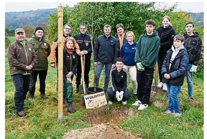
Pflanzaktion des „Weilburger Apfels“.

Wurzelpflanzen - wie Möhren etwa - mit Stauden und Schattengiebenden Pflanzen wie fruchttragende Sträucher, Bäume und Rankpflanzen ein Gesamtbild ergeben. Alles wird so gepflanzt, dass man auch einen Ernteertrag hat, ohne ständig „gärtnern“ zu müssen - wie es in der Natur ja eben auch ist. Dabei darf es nicht mit einem „Schulgarten“ verwechselt werden, der seitens einer Schule begleitet wird und viel mehr Arbeit benötigt.