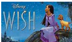
Szene aus WISH, dem neuen Disney Animationsfilm.

Delphi Filmtheater Hainallee 10 35781 Weilburg Telefon 06471-922600 www.kinoweilburg.de