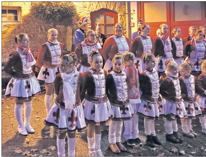
Die Tanzgarde formiert sich vor dem Alten Rathaus.

voller Süßigkeiten griffen. Von Ferne sah es aus, als wogte der Dorfplatz voller riesiger bunter Blüten. Dabei waren es farbige Schirme. Eine Mutter tanzte mit ihrem Kind durch die Pfützen. Von den Narrenkappen tropfte