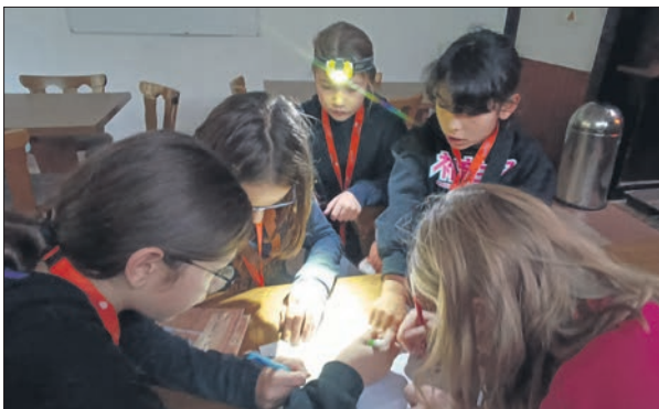
Um die Aufgaben im Escape Room zu lösen, war Teamwork angesagt.

Kaum hat der Verein seine erste Veranstaltung unterm Motto „Escape Room – Schatz des Pharaos“ erfolgreich hinter sich gebracht, stehen die Vorbereitungen für das nächste Event an: Der Verein Eppsteiner Kids und Freunde organisiert auch dieses Jahr