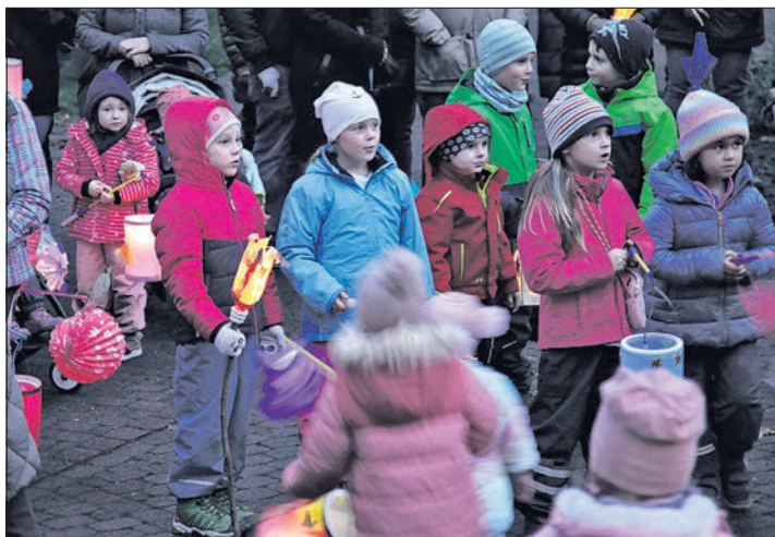
Kinder warten in Ehlhalten auf St. Martin mit seinem Pferd.

Laut Annau war der Polizeiwagen am Kopf des Umzugs eine Sensation für die Kinder. Zum ersten Mal habe die Ordnungspolizei den Umzug zusammen mit den ehrenamtlichen Ordnern begleitet und die Zufahrten zum