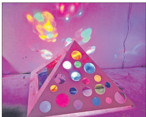
Science Fiction Leuchtobjekt

Die Teilnahme kostet pro Kurs 5 Euro, Kinder und Jugendliche können sich für einen, aber auch für mehrere Workshops anmelden und nehmen mit ihren Werken am Kunstwettbewerb „Intermezzo“ des MTK teil. Preisverleihung ist im Frühjahr 2024. Anmeldungen nimmt Kai Wolf entgegen, Telefon 0170 802 53 54, E-Mail: kinetik@kaiwolf.info .