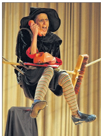
Mit ihrem altmodischen Handy ruft Knallpurga aus dem All die Oberhexe an.

Von Beginn an fieberten die Fünfjährigen mit, feuerten Taluli an, die an ihrem Geburtstag kein Geschenk erhielt. Sie spielte die Enttäuschung so glaubhaft, dass ein kleines Mädchen aus den Zuschauerreihen in die Garderobe lief, um ein am Morgen gemaltes Bild zu holen und damit auf die Bühne zu steigen. Dann kommt doch noch ein Geschenk. Ein großer Kühlschrank mit der Bastelanleitung für einen Schneemann. Mit Hilfe der Kinder gelingt es, den Kühlschrank in Gang zu setzen. Schließlich öffnet