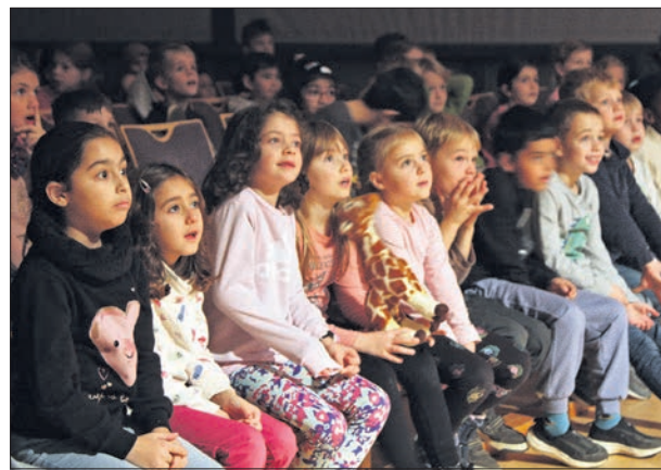
Gebannt verfolgen die Kinder Knallpurgas Reise zum Mond.

Viel Lob gab es für das Helferteam des Kulturkreises, das den Saal und die Verwahrung von hunderten Kinder-Jacken perfekt vorbereitet hatte. EZ