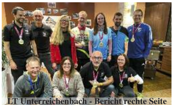
LT Unterreichenbach - Bericht rechte Seite

Weitere Termine: 03.11.2023 ab 18.30 Uhr Clubabend in der Grillhütte • 01.12.2023 ab 18.30 Uhr Clubabend in der Grillhütte • 01.12.2023 ab 20.00 Uhr Jahreshauptversammlung in der Grillhütte