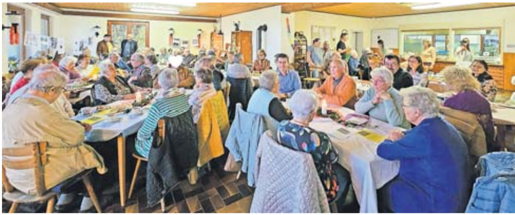
Gut besuchter Nachmittag.

Geschichtsnachmittag zur ehemaligen Waldschule