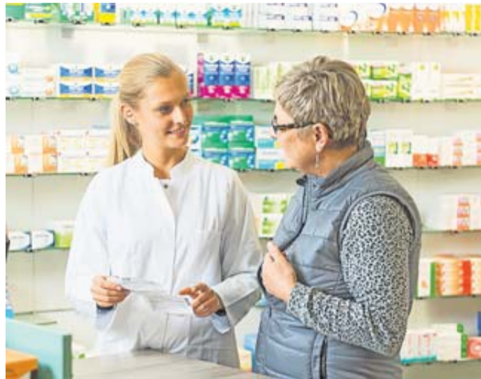
Eine Medikationsanalyse geht weit über die Beratung hinaus, die man beim Einlösen eines Rezeptes in der Apotheke bekommt.

Eine Einschätzung vom Profi: Die ist in so mancher Lebenslage hilfreich. Zum Beispiel auch bei der Frage, ob all die Medikamente, die man regelmäßig nimmt, unerwünschte Neben- oder Wechselwirkungen haben können. Wer sich in dieser Frage beraten lassen möchte, kann das in der Apotheke im Zuge einer Medikationsanalyse tun. Denn: Viele Ältere bekommen Medikamente verordnet, die für sie potenziell ungeeignet sind. Das zeigt eine aktuelle Analyse des Wissenschaftlichen Instituts der AOK (Wido). Das können zum Beispiel Wirkstoffe sein, die im Alter das Sturzrisiko erhöhen. Die Kosten für eine Medikationsanalyse in der Apotheke tragen die gesetzlichen Krankenkassen seit Mitte 2022 unter bestimmten Voraussetzungen. Und zwar einmal im Jahr für alle Versicherten, die dauerhaft mindestens fünf ärztlich verordnete Medikamente einnehmen. Darauf macht die Bundesvereinigung Deutscher Apothekerverbände (ABDA) aufmerksam. Und wie läuft so eine Medikationsanalyse ab? Wer das Angebot in Anspruch nehmen möchte, macht einen Termin mit der jeweiligen Apotheke aus. Steht der an, bringt man nicht nur alle ärztlich verordneten Medikamente mit. Einpacken sollte man auch Nahrungsergänzungsmittel, Selbstmedikation, Arztbriefe, Entlassbriefe aus dem Krankenhaus, Medikationspläne und Laborwerte. Dazu rät