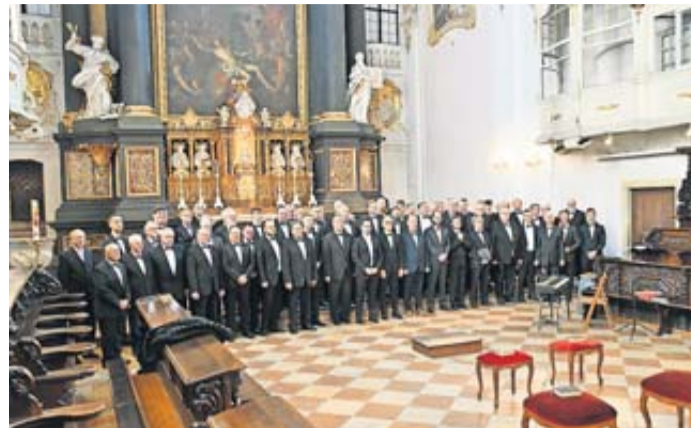
Klangvolle Liedbeiträge des Männerchores Frohsinn Bad Soden.

St. Martin ist eine imposante Hallenkirche, das bedeutet, alle drei Schiffe sind mit