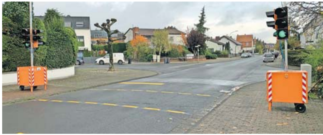
Die beiden Ampelanlagen im Bereich Homburger Straße / Ecke Jahnstraße.

Fußgänger-Ampelanlagen im innerörtlichen Bereich errichtet