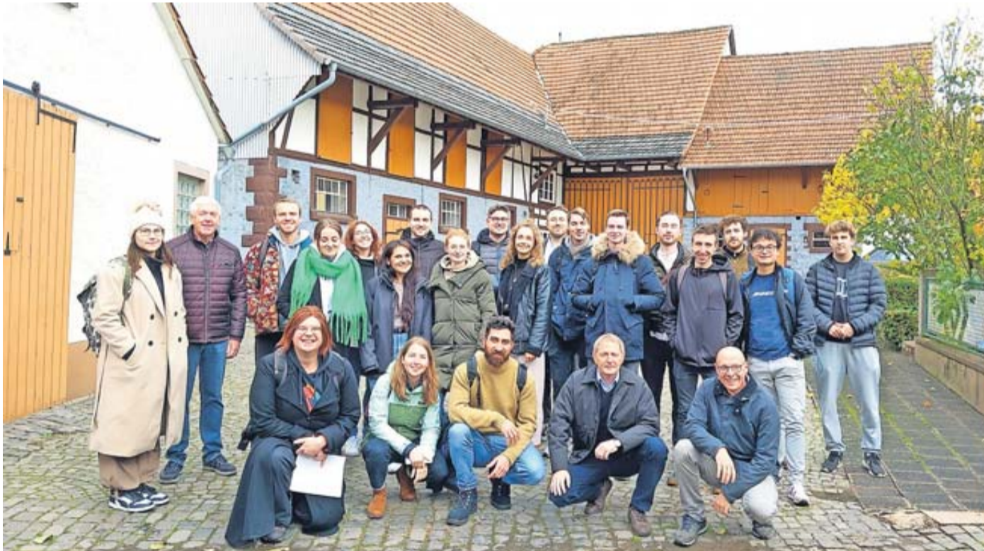
Studierende des Projektes „Geomarketing“ von der Justus-Liebig-Universität Gießen lernen im Rahmen einer beispielhaften Ortsbegehung die Region Oberhessen kennen. Vertreter der Wirtschaftsförderung Wetterau GmbH, der Gemeinde Kefenrod, Dorfaktive und des Vereins Oberhessen unterstützen sie dabei.