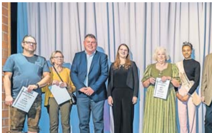
Die geehrten Mitglieder des Vereins.

SV 98 Rosbach feierte sein 125-jähriges Bestehen