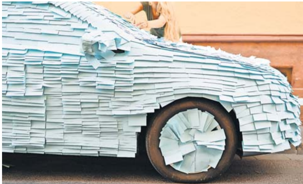
Teures Falschparken: Ein Autofahrer hatte sich vertraglich mit seiner Nachbarin auf gewisse Parkmodalitäten geeinigt, diese später aber nicht eingehalten.

Es ging um einen Nachbarschaftsstreit: Der Beklagte hatte sein Auto seit einigen Jahren immer wieder vor seiner Grundstückseinfahrt abgestellt und damit seiner Nachbarin gegenüber auf der engen Straße die Zufahrt zu deren