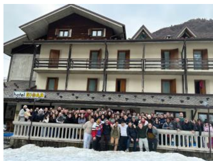
Konferenz zum Jahresende 2022