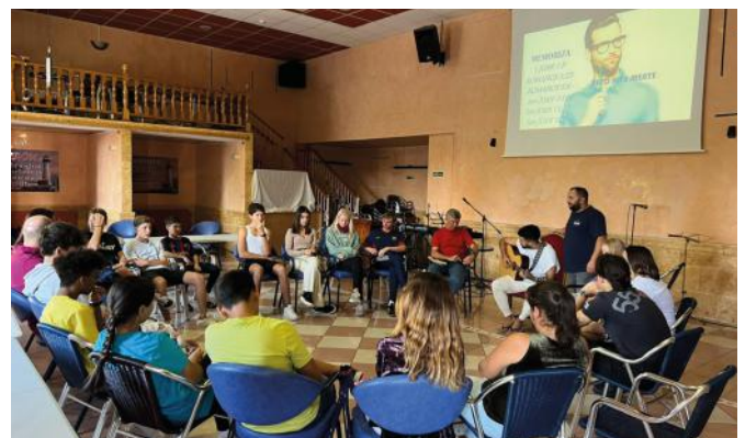
Jugendkreis in der Gemeinde EL FARO