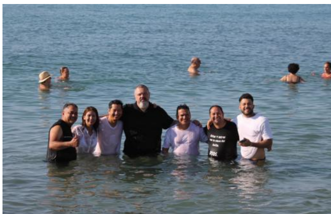
Taufen im Meer