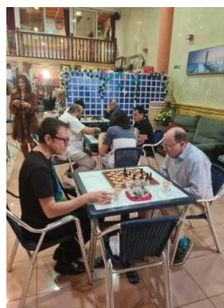
Schachclub in der Gemeinde für Außenstehende