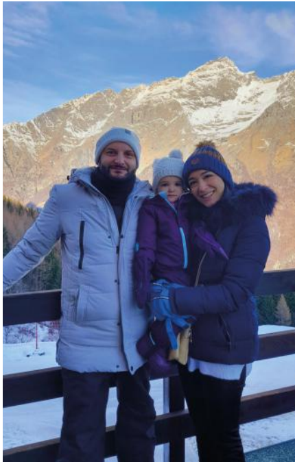
Familienfoto im Winter