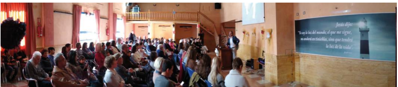
Einweihungsgottesdienst EL FARO Oktober 2019