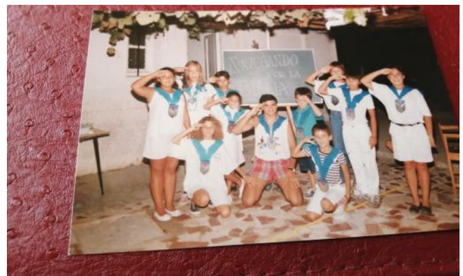
Jugendfreizeit im Haus Betania