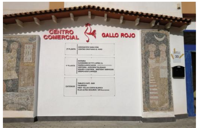
Gebäude, in dem sich die Gemeinde EL FARO trifft

annalagos70@gmail.com Tel: +34 965 94 18 32 oder WhatsApp: +34 607 62 77 89. ■