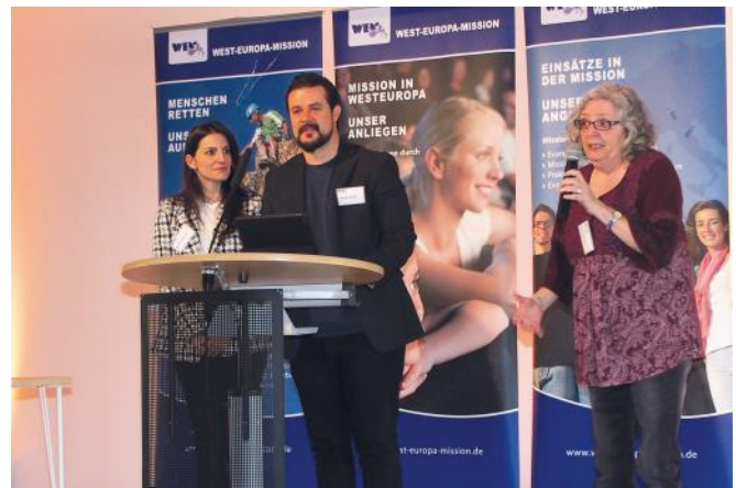
Missionarshochzeit in Barcelona mit Übersetzerin