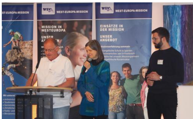
Team vom Concours biblique

https://www.youtube.com/watch?v=lbQ5nQZO0gw