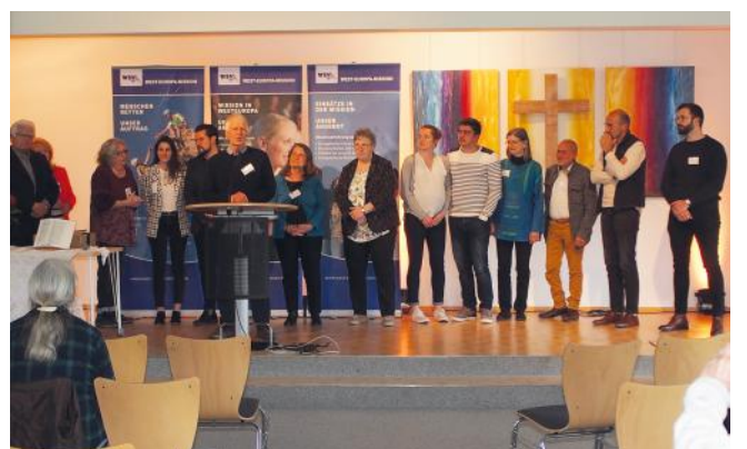
Aussendung der Missionare