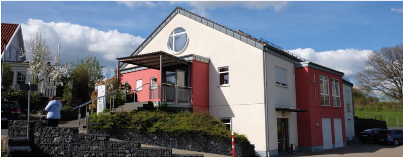
Gemeindehaus in Kröffelbach