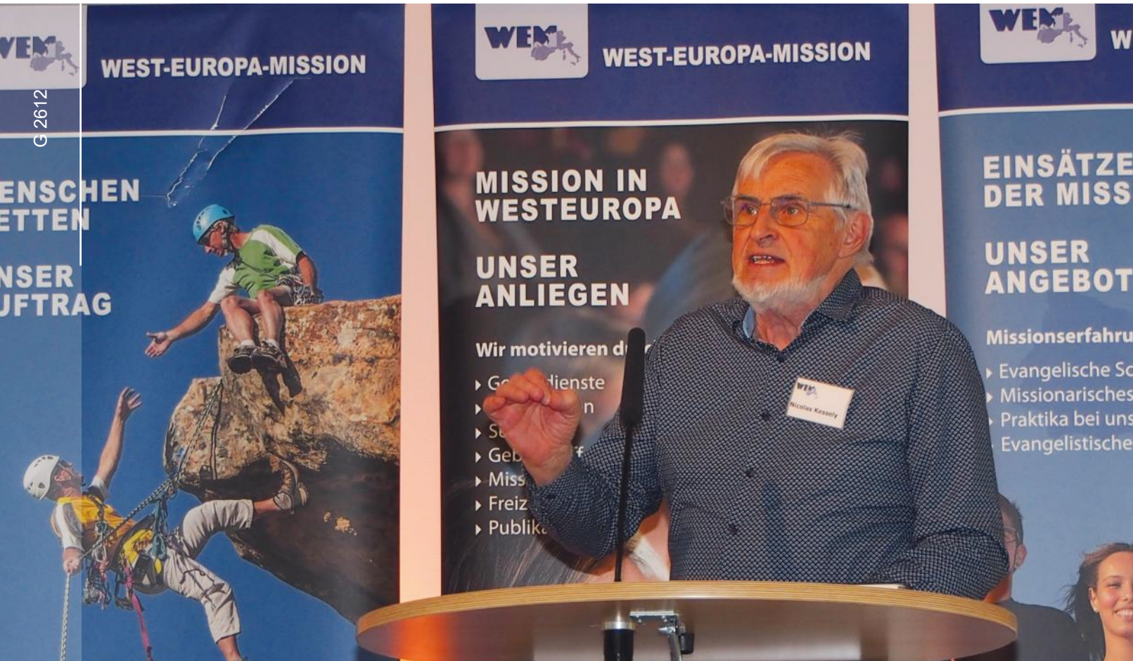
Jesus Christus – der treue und souveräne Herr der Mission 49. Jahreskonferenz