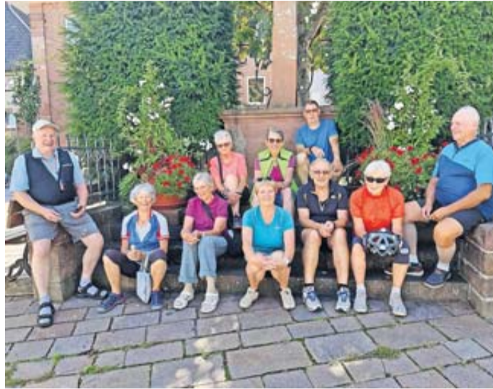
Die Teilnehmerinnen und Teilnehmer hatten viel Spaß.

mit Pkw nach Klingenberg, wo die letzte Tour-Etappe über Eschau, Röllbach, Großheubach wieder zurück nach Klingenberg führte.