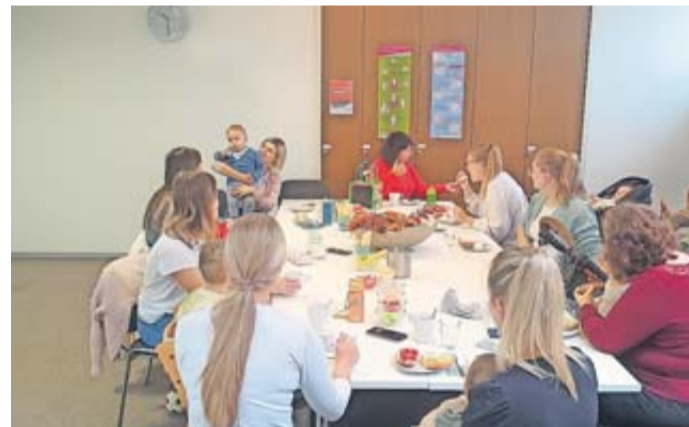
Das „Babyfrühstück“ kommt gut an.

Neben dem gesundheitlichen Aspekt besitzen die Kontakte zwischen Hebammen und Müttern eine sehr große psychische und soziale Komponente. Aufgrund veränderter gesellschaftlicher und familiärer Strukturen fehlen in vielen Familien eine Bezugsperson. Doch gerade die Familien-gründungsphase stellt die Familie vor große Herausforderungen. Dieser Problematik stellte sich im November 2013 der SkF Bad Soden-Salmünster und installierte das Projekt „Babysprechstunde“. Gefördert wurde dieses durch die SkF Dachstiftung, den Diözesan Caritasverband Fulda und den Fonds der Frühe Hilfen der SkF Zentrale in Dortmund.