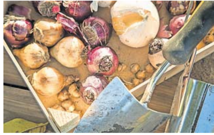
Der Mix macht's: Hier warten Hyazinthen, Krokusse, Narzissen und Zierlauch darauf, in die Erde zu kommen.

Wer sich auf einen bestimmten Effekt von Farben und Arten im Frühling freuen möchte, kann fertige Mischungen verschiedener Blumenzwiebeln kaufen. Oder sich selbst