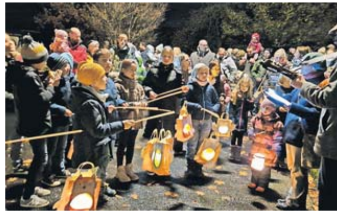
Mit vielen selbst gebastelten Laternen ging es durch die Straßen von Kerbersdorf.