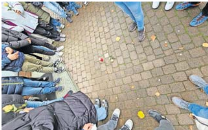
Schülerinnen und Schüler der Henry-Harnischfeger-Schule zünden zum Gedenken an die Opfer des Nationalsozialismus Kerzen an und legen Rosen nieder.