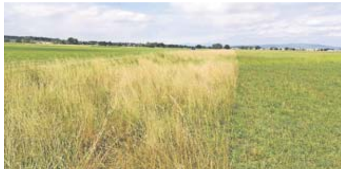
Im Winter bieten Altgrasstreifen Strukturen und Lebensräume für unsere heimischen Arten.

Für Arten, welche nicht in wärmere Gebiete ziehen, müssen in unserer Landschaft Rückzugsräume bestehen. Während Hecken und Säume diese Funktion übernehmen