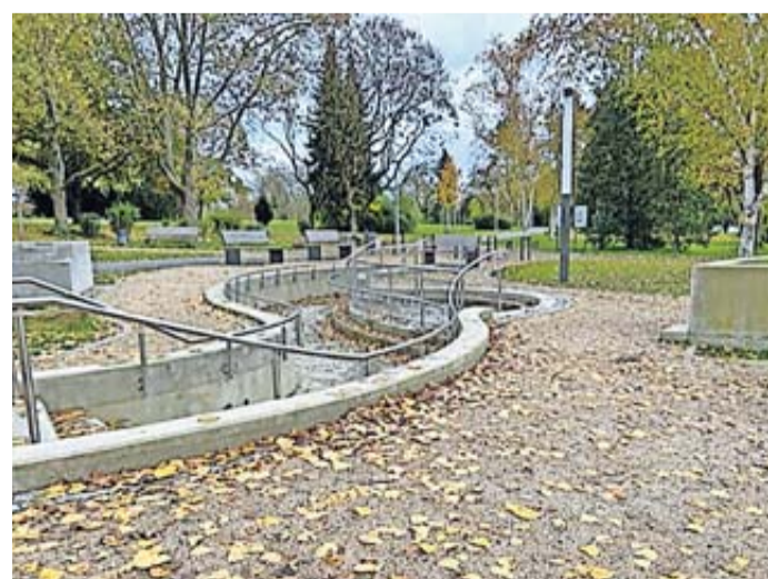
Die Kneipp-Anlage in Bad Vilbel.

damit keine Schäden an den Becken entstehen. Auch die Kräuter ziehen sich zurück, um neue Kraft und Energie zu schöpfen. Die Wiedereröffnung der Anlage als Teil des Wetterauer Kneipp Bäder3Ecks wird im Frühjahr 2024 sein. Mit einer kleinen Zeremonie wird die Anlage dann wieder angewässert. Der angedachte Termin wird der ‚Tag des Wassers‘, am 22. März 2024, sein“, sagte der im Magistrat für Kneipp-Belange zuständige Stadtrat Udo Landgrebe.