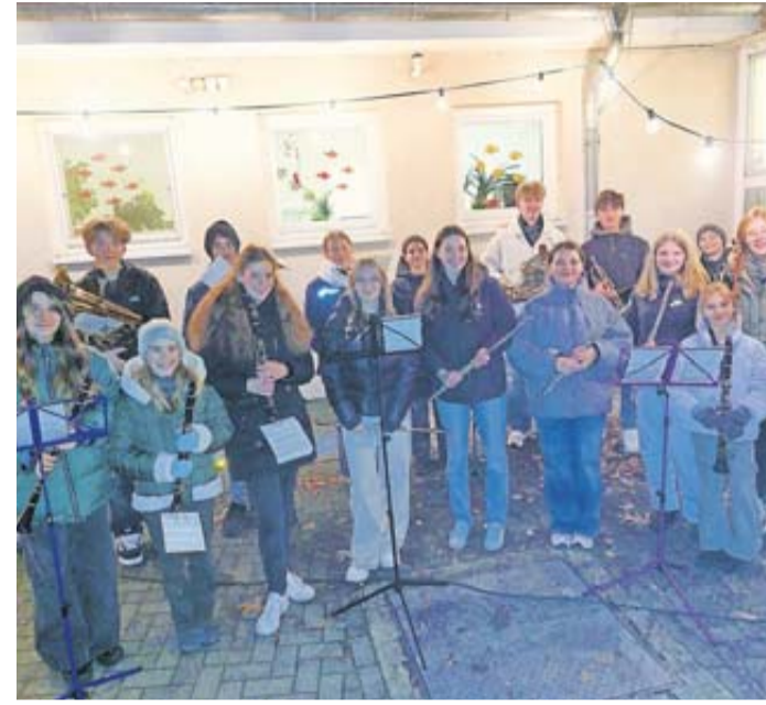
Die Musiker des Musikvereins.

Jugendabteilung des Musikverein Ober-Wöllstadt