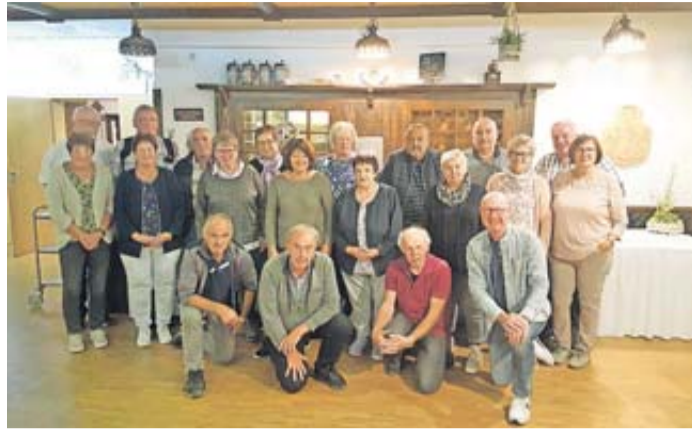
Gemeinsam erlebten die Teilnehmer einen schönen Tag.

Steinau. Auch in diesem Jahr haben die Mitglieder der Ehren- und Altersabteilung der Freiwilligen Feuerwehr Uerzell/Neustall einen Ausflug unternommen. Ziel war die Rhön. Zunächst wurde das Fränkische Freilandmuseum in Fladungen, ein Museum für ländliches Bauen, Wohnen und Wirtschaften in Unterfranken und der Rhön besucht. Hier kann man hautnah erleben, wie die Menschen der Region in den letzten 350 Jahren gebaut, gewohnt und gewirtschaftet haben. Die meisten historischen Gebäude stammen aus der Rhön und Unterfranken. Erfreulicherweise fand das Herbstfest statt, dass zu den beliebtesten Veranstaltungen im Fränkischen Freilandmuseum gehört. Der Aktionstag unter dem Motto