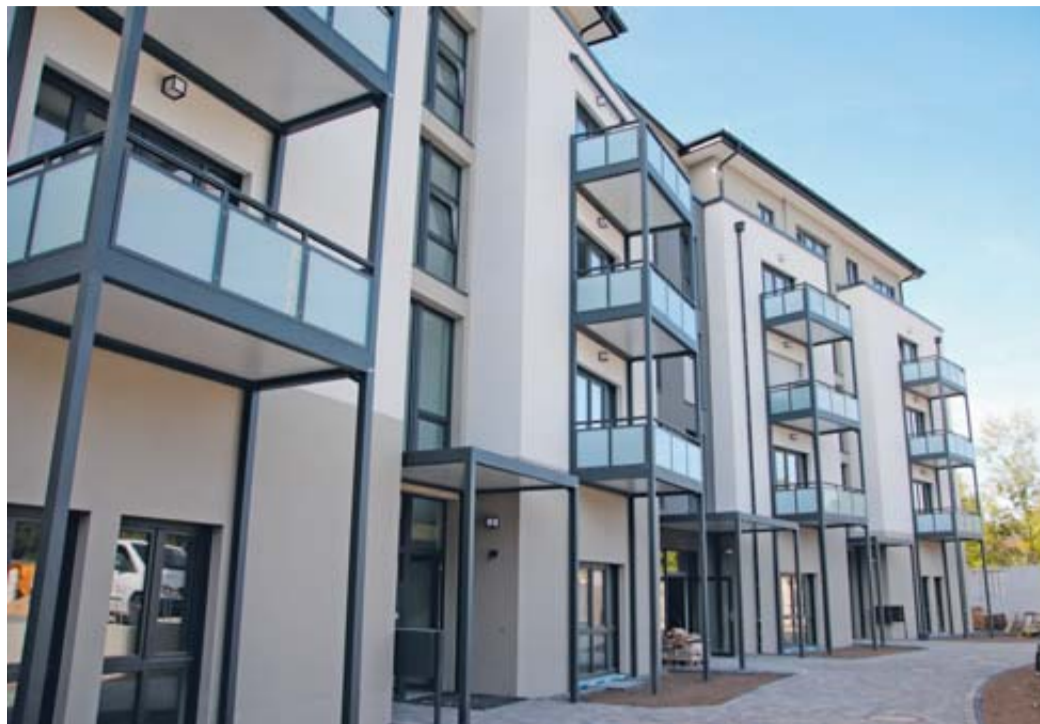
Kernstück des Hauses Nummer 3 des Schlüchterner Neubauprojektes bildet die barrierefrei zu erreichende Tagespflege „Kalinka – Tagespflege Elmland“.

Bei Kalinka- – Ihr Pflegeteam, das in Birstein-Untersotzbach bereits seit 1996 als ambulanter Kranken-, Kinder-, Alten- und Intensiv-Pflegedienst besteht, stehen umfassende pflegerische Leistungen, Kompetenz und Menschlichkeit im Vordergrund. Das freundliche und erfahrene Team, das stets auf Weiterbildung setzt, nimmt sich viel Zeit für die individuellen Bedürfnisse seiner Klienten, um deren Bedarf zu ermit-