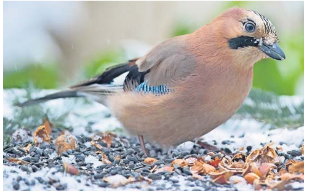
Wildtier-Experten raten, zeitig mit der Fütterung anzufangen. So kennen die Vögel die Futterstellen bereits, wenn Schnee und Frost die Nahrungssuche noch schwerer machen.

entsteht eine Masse, die sich mit den Fingern fest in die Schuppenschicht des Zapfens hineindrücken lässt - und fertig. Apfel am Stiel: Dafür braucht es Holzstäbe aus dem Bastladen oder dünne Äste aus dem Garten. Sie sollten etwa 30 Zentimeter lang sein und oben spitz zulaufen. Tun sie das nicht, muss man mit einem Messer nachhelfen. Auf die Spitzen wird nun jeweils ein Bio-Äpfel gesteckt. Die Schale darf dabei schon etwas weicher sein. Denn das macht es leichter, Sonnenblumenkerne - mit der spitzen