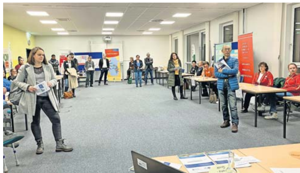
An verschiedenen Ständen erhielten die Unternehmen Informationen zu den jeweiligen Unterstützungsangeboten und Anlaufstellen.

Um diese Fragen zu klären und Unternehmen verschiedene Projekte und Anlaufstellen aufzuzeigen, hat die Projektgruppe „Internationales“ aus der Fachkräftestrategie