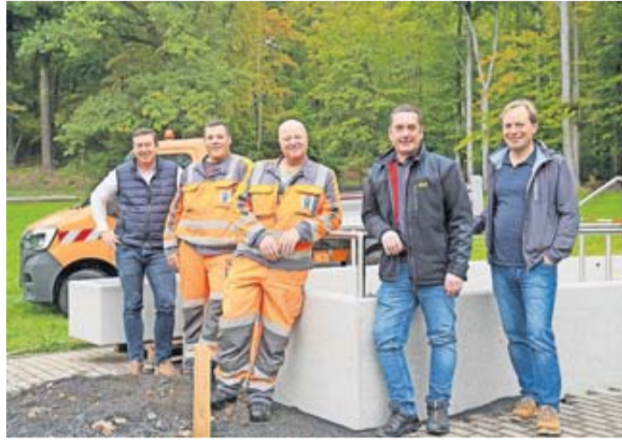
Große Freude in Schlüchtern.

Schlüchtern. Den Kreislauf in Schwung bringen und das Immunsystem stärken: Kneippen ist gut für die Gesundheit – und auf dem Schlüchterner Freizeitgelände „Acisbrunnen“ bald wieder möglich. Nachdem das alte Holzbecken entfernt werden musste, begannen vor etwa einem Jahr die Planungen für eine neue Anlage. Kürzlich wurden die beiden Steinbecken angeliefert und an Ort und Stelle platziert. Jetzt fehlt nur noch der Feinschliff: Das Pflaster muss noch bis an die Becken verlegt werden, und die Treppenstufen müssen auch noch