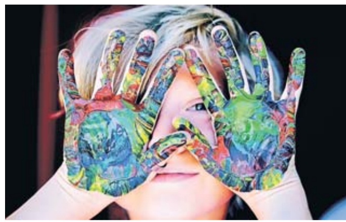
Kinderfotos im Netz verdienen Schutz.