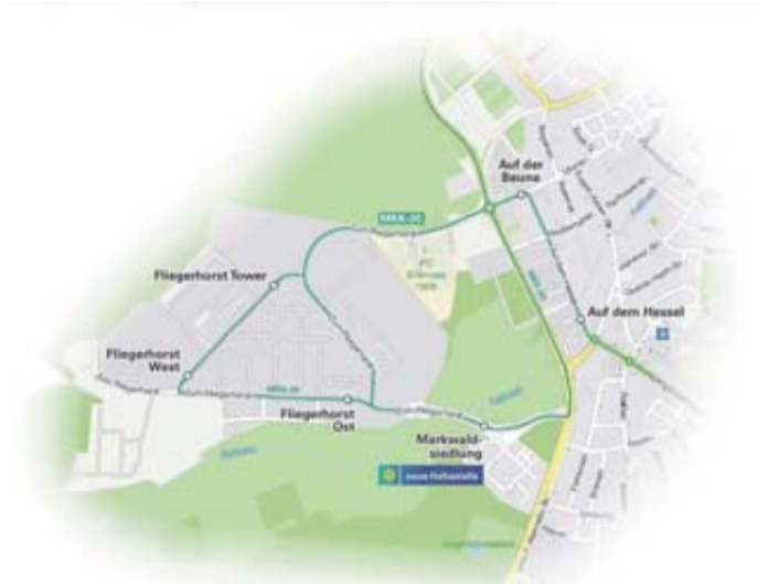
Linienführung Erlensee Fliegerhorst & Markwaldsiedlung © KVG

geht ein weiterer Vorteil einher: Durch den fehlenden auf der Kinzigalbahn können Anschlüsse im Verspä-