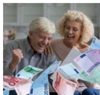
Es geht um viel Geld.

Bei einem Widerruf erhalten Sie – anders als bei der Kündigung – alle eingezahlten Beiträge ohne Abzug von Maklerprovisionen und Verwaltungskosten zurück. Und nicht nur das: Die Versicherung muss Sie auch an dem mit Ihrem Geld erzielten Anlagegewinn beteiligen. So können Sie sich bis zu 150 % der eingezahlten Beiträge zurückholen. Ein saftiges Plus auf Ihrem Konto winkt!