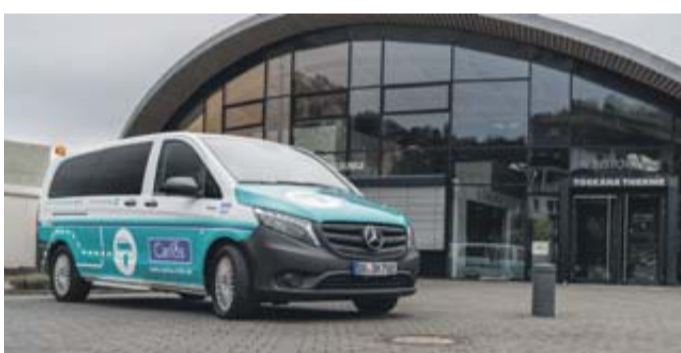
„Carlos“ OnDemand Fahrzeug in Bad Orb

Die Carlos Buchung ist per App und Telefon unter