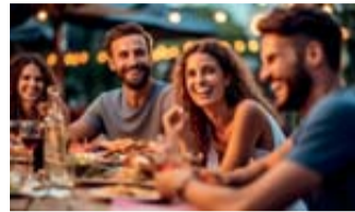
Ein gutes Sprachverstehen ist die Grundlage, um miteinander lachen zu können.

system gestreamt. Störende Umgebungsgläusche können dabei herausgefiltert werden. Damit wird Sprache auch in schwierigen Situationen verständlich. „Eine frühzeitige Versorgung mit Hörsystemen macht den Alltag leichter und sorgt für mehr Lebensqualität“, sagt Beate Gromke, Hörakustikmeisterin und Präsidentin der Europäischen Union der Hörakustiker e. V. (EUHA).