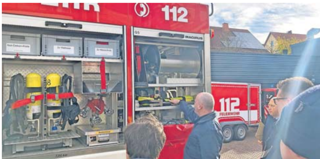
Unterschiedliche Sicherungsmöglichkeiten standen im Fokus.

Sicheres Laden und Transportieren mit Einsatzfahrzeugen