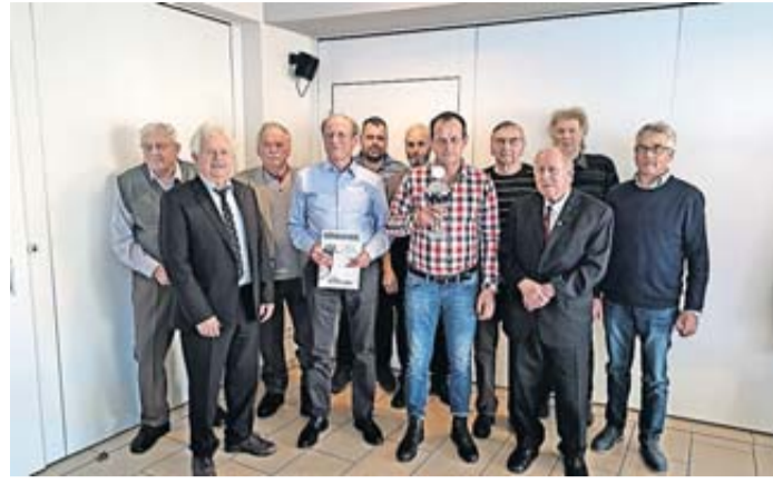
Pokal und Urkunde gab es auch.