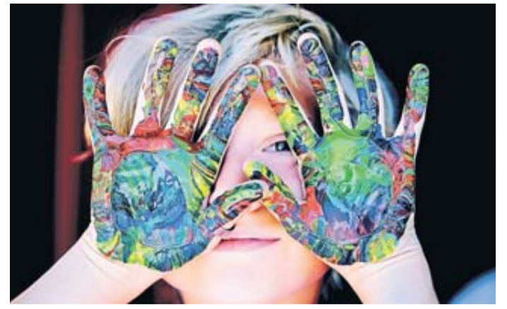
Kinderfotos im Netz verdienen Schutz.

Wie das geht, zeigt der emotionale Spot, den die Telekom im Rahmen ihrer Initiative #SharewithCare auf YouTube veröffentlicht hat. Aus einem Foto der fiktiven 9-jährigen Ella wurde mithilfe von KI-Tools ein digitales, erwachsenes Abbild erstellt. Diese „erwachsene“ Ella konfrontiert ihre Eltern mit den Konsequenzen, die das Teilen von Kinderfotos haben