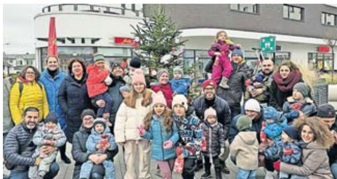
Kinder und Erwachsene vor dem Weihnachtsbaum.

Gewerbeverein Karben begeistert mit Adventsaufakt