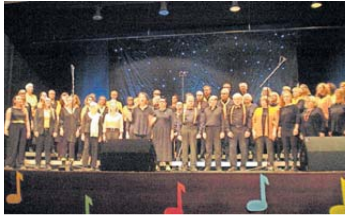
Zum Abschluss des Programms trat noch einmal der Gospelchor „Let it Shine“ mit drei englischen Liedern auf.