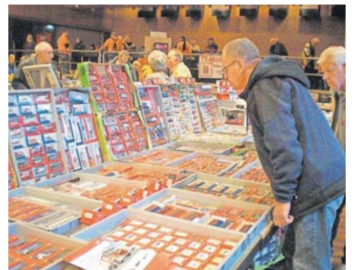
Alle Stände fanden das rege Interesse der vielen Besucher.

Das Bürgerhaus Butzbach bot ein hervorragendes Ambiente, was zahlreiche Besucher aus ganz Hessen anzog. Die Termine für das kommende Jahr stehen bereits fest: 28. Januar und 24. November 2024, jeweils von 10 bis 16 Uhr im Bürgerhaus Butzbach.