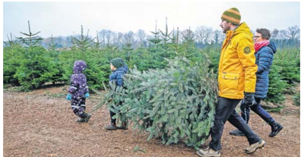
Verbraucher, die sich für einen natürlichen Baum aus der Region entscheiden, leisten einen Beitrag zum Umwelt- und Klimaschutz.

die Mandarinen mit ihrer dünneren Schale haben einen Vorteil: Sie lässt sich einfacher abziehen. Stichwort Schalen: Dabei gehört für viele ein akribisches Abpulen des weißen Gewebes rund um die Frucht dazu. Ein Muss ist das nicht - ganz im Gegenteil. Laut dem BZfE lohnt es sich, das Gewebe auch mal dranzulassen: Denn darin stecken sekundäre Pflanzenstoffe, die die Zellen schützen und den Blutdruck regulieren können. dpa