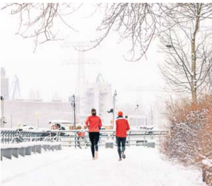
Gerade im Winter lässt oft die Motivation nach. Gemeinsame Sportverabredungen können helfen, den inneren Schweinehund zu überlisten.