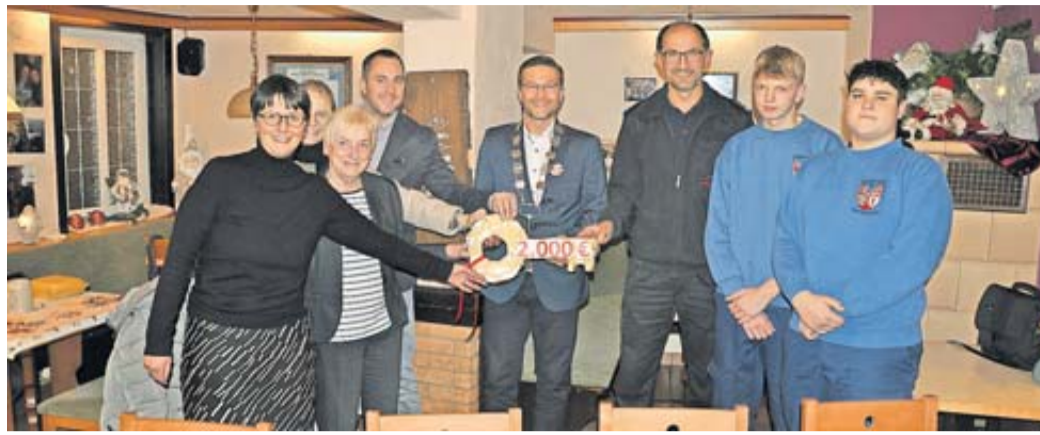
2000 Euro gab es für fünf Projekte in Schlüchtern.