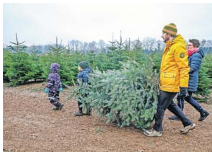
Verbraucher, die sich für einen natürlichen Baum aus der Region entscheiden, leisten einen Beitrag zum Umwelt- und Klimaschutz.

Vor allem ältere Menschen entscheiden sich häufiger für Plastikbäume, das zeigt eine aktuelle Studie zum Kaufverhalten von Weihnachtsbäumen. Nach Angaben des Verbandes natürlicher Weihnachtsbaum (VNWB) haben Plastikbäume - vor allem im Niedrigpreissegment - jedoch nur eine Lebensdauer von wenigen Jahren, bevor sie wegwerfen werden. Künstliche Weihnachtsbäume bestehen aus Verbundstoffen, die sich wirtschaftlich kaum trennen lassen, so der VNWB. So stellt die geringe Recyclingquote von Plastik ein zusätzliches Problem dar. Im Gegensatz dazu können Naturbäume problemlos kompostiert, energetisch genutzt oder für Heimwerkarbeiten verwendet werden. Die Herstellung von Plastik aus Petrochemikalien ist