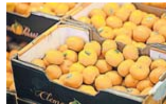
Clementinen (im Bild) sind etwas kleiner als Mandarinen und schmecken süßlich bis mild-säuerlich.

schmeckt süßlich bis mild-säuerlich. Die Mandarine hingegen ist aromatischer und herber im Geschmack, heißt es von den Ernährungsexperten. Wer genau hinschaut, erkennt auch in der Optik Unterschiede. Clementinen sind etwas kleiner als Mandarinen. Und sie haben eine dickere Schale, wodurch sie sich länger halten. Doch auch die Mandarinen mit ihrer dünneren Schale haben einen Vorteil: Sie lässt sich einfacher abziehen. Stichwort Schalen: Dabei gehört für viele ein akribisches Abpulen des weißen Gewebes rund um die Frucht dazu. Ein Muss ist das nicht - ganz im Gegenteil. Laut