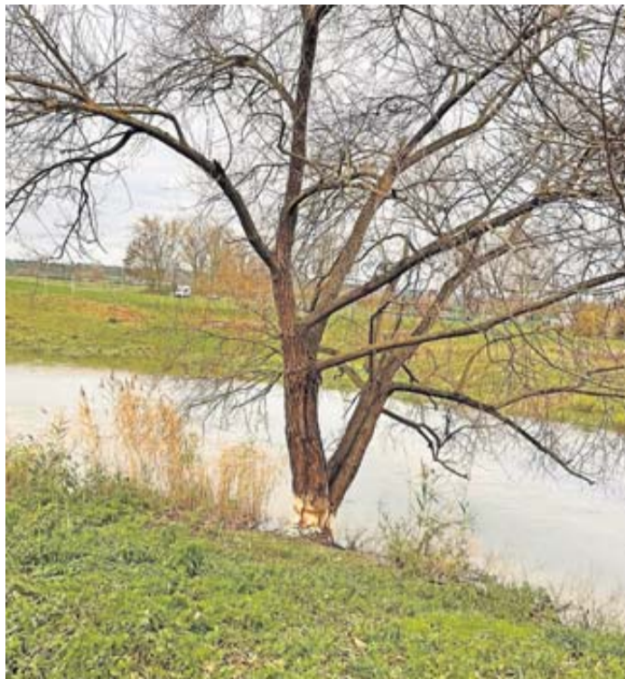
Einer der angenagten Bäume.

Unwiederbringlicher Schaden erfordert Fällung von Bäumen