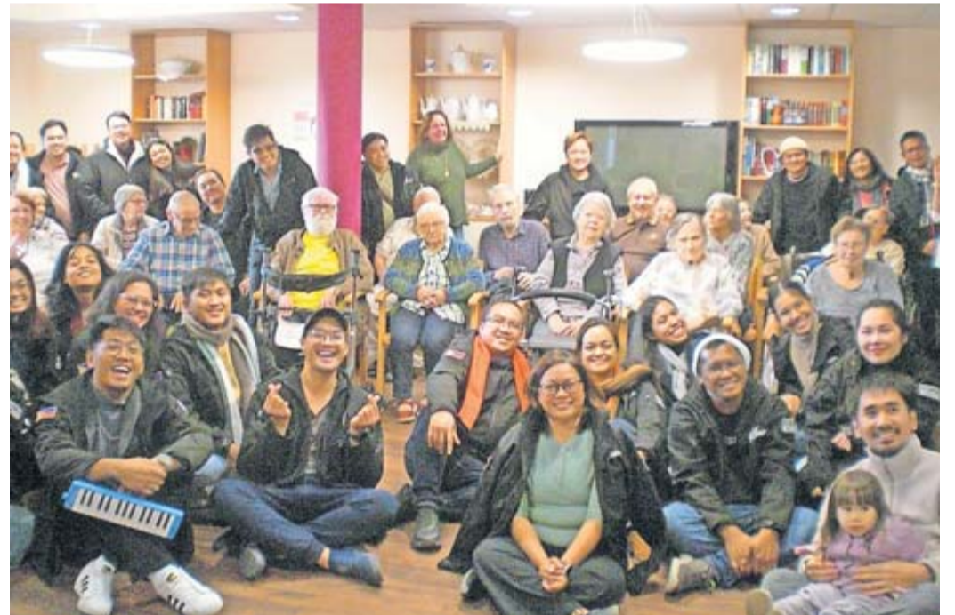
Der Chor mit dem Heimbewohnern.