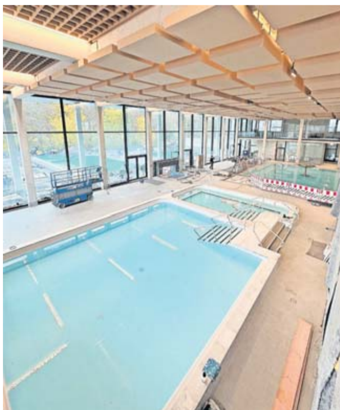
Blick in die moderne Badehalle, die ganz der Entspannung dient, während der Bauphase.

Jugendstils. Die ehemalige Kuranlage ist als Gesamtkunstwerk zu sehen, denn hier begann auch der Aufstieg Bad Nauheims als Weltbad. Die Kuranlage wurde zwischen 1905 und 1911 im Jugendstil erbaut und gehört zu den sehenswerten Orten in Bad Nauheim. Gestaltet wurde der Sprudelhof vom Architekten Wilhelm