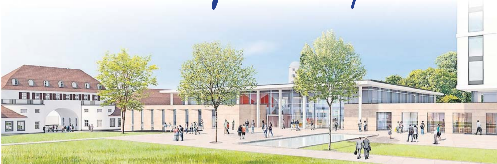
Visualisierung der Frontansicht der neuen Therme.