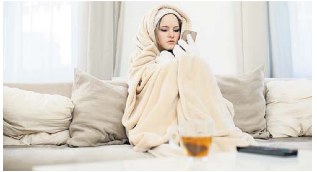
Die Heizung fällt oft an den kältesten Tagen aus. Und nun?