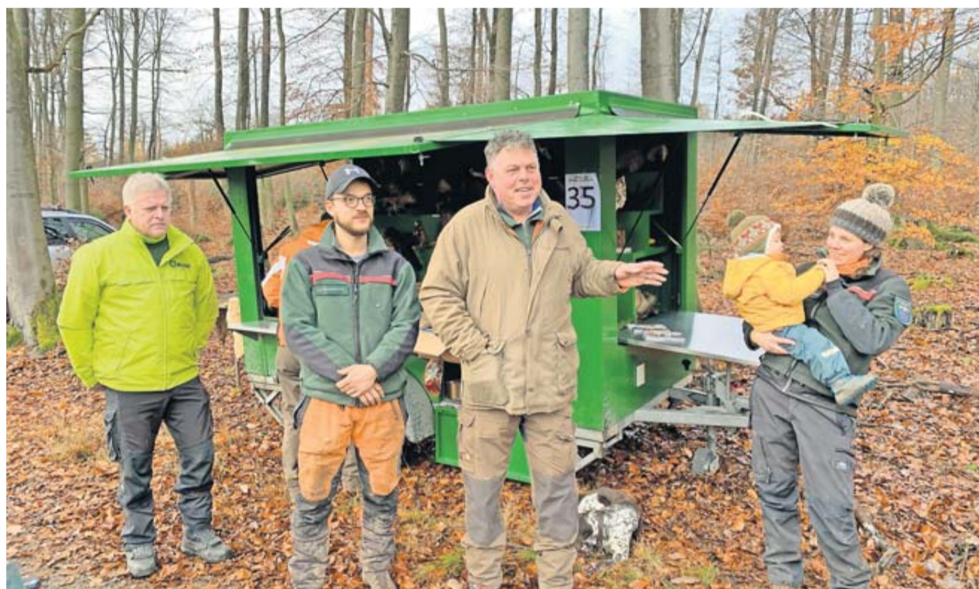
Engagierte Bürgerinnen und Bürger beteiligen sich an der Pflanzaktion im Rosbacher Stadtwald, unterstützt von lokalen Gruppen und Sponsoren.

schädigten Fichtenflächen den Wald von morgen gepflanzt - Traubeneichen, Hainbuchen und Roteichen. Vielen Dank an die vielen Helferinnen und Helfer, an die Jugendfeuerwehr für die Verpflegung, an Hessen Forst für die fachliche Betreuung und nicht zuletzt an die Sponsoren, die diese Aktion mit Pflanzenspenden unterstützt haben. Ohne solche Pflanzaktionen gäbe es bald keinen richtigen Wald mehr. Umso wichtiger ist es uns, dass diese Pflanzaktion hier in Rosbach nun schon so erfolgreich seit mehreren Jahren mit Sponsoren, aber auch den Bürgerinnen und Bürgern gemeinsam durchgeführt wird. Meinen herzlichen Dank an alle, die hier helfen und immer wieder hier dabei sind und uns dabei unterstützen“, so Bürgermeister Maar.