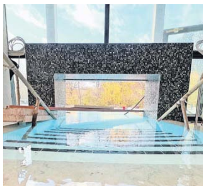
Ein visuelles Highlight: der Übergang vom Innen- zum Außenbereich der Therme.

Freizeit- und Sportangebot komplettieren und ein wichtiger Bestandteil des Heilbades sein. Mit der Eröffnung der neuen Sprudelhof Therme am 19. Dezember 2023 können Gäste die vielfältigen Saunen, Dampfbäder und Becken im Innen- und Außenbereich des Neubaus nutzen. Der Saunagarten erstreckt sich zwischen dem Thermenneubau und den historischen Mauern des Sprudelhofs. Hier gibt es zwei Außensaunen, eine Finnische Sauna (75-90°C) mit einer Fläche von 75 Quadratmetern und eine Kräutersauna (50-65°C) mit 40 Quadratmetern und als Highlight die einzigartige Turmsauna (75-90°C), die in den historischen Waitz'schen Turm integriert ist und 20 Quadratmeter umfasst. Im Saunagarten wird der Blick auf den angrenzenden historischen Sprudelhof sowie auf viel Grün gerichtet sein. Im Sommer schützen Schirme die Besucher vor zu viel Hitze. Auch im Thermen-Innenbereich gibt es viel zu entdecken, unter anderem ein Dampfbad im Textilbereich. Die neue Sprudelhof Therme befindet sich direkt neben dem historischen Sprudelhof, dieser wurde von 1905 bis 1911 errichtet und gilt als das größte zusammenhängende Jugendstil-Ensemble Europas. Das historische Badehaus 2 des Sprudelhofes mit seinem einzigartigen Jugendstil-Ambiente wird dem Sauna- und Wellnessbereich ab Herbst 2024 einen unverwechselbaren Charakter