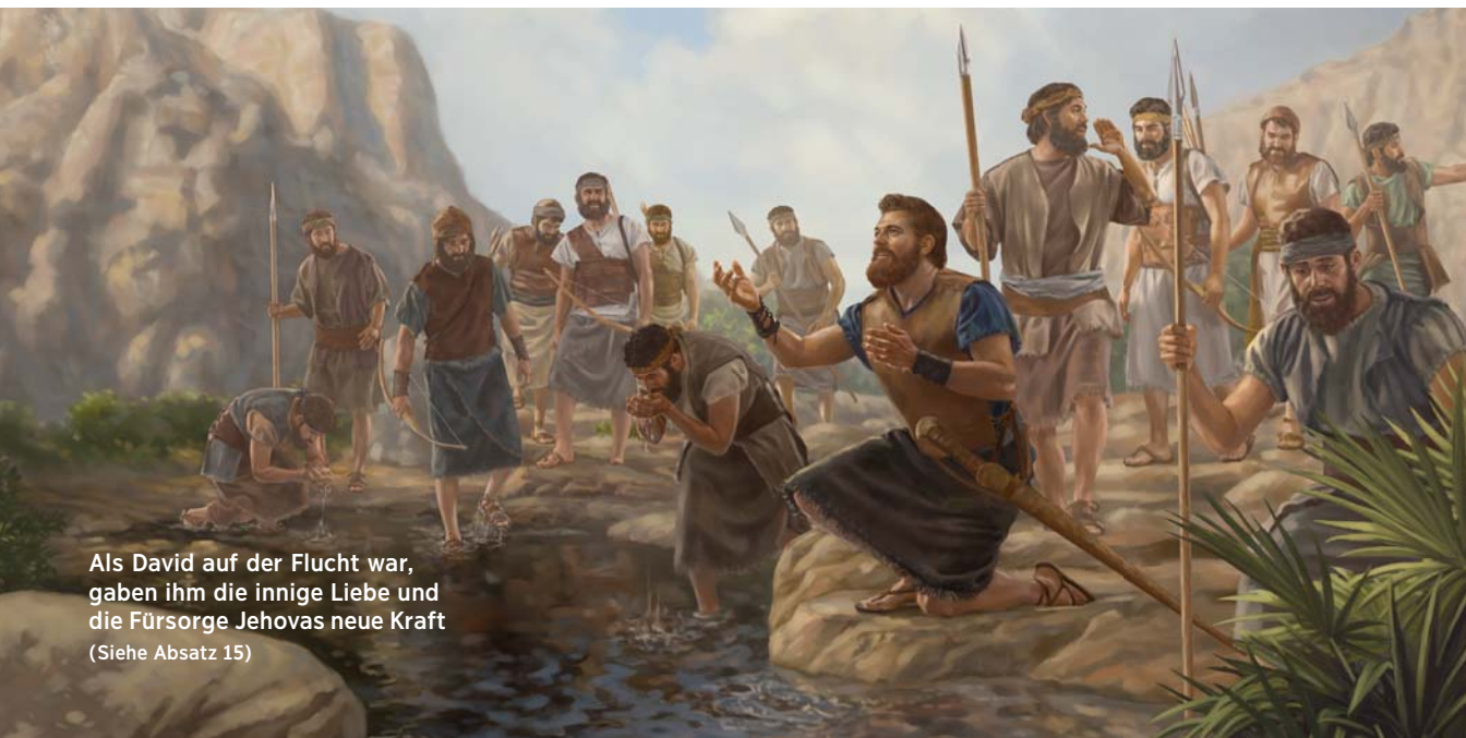
Als David auf der Flucht war, gaben ihm die innige Liebe und die Fürsorge Jehovas neue Kraft (Siehe Absatz 15)