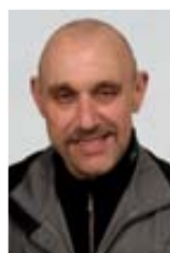
Raimund Knapp Versand