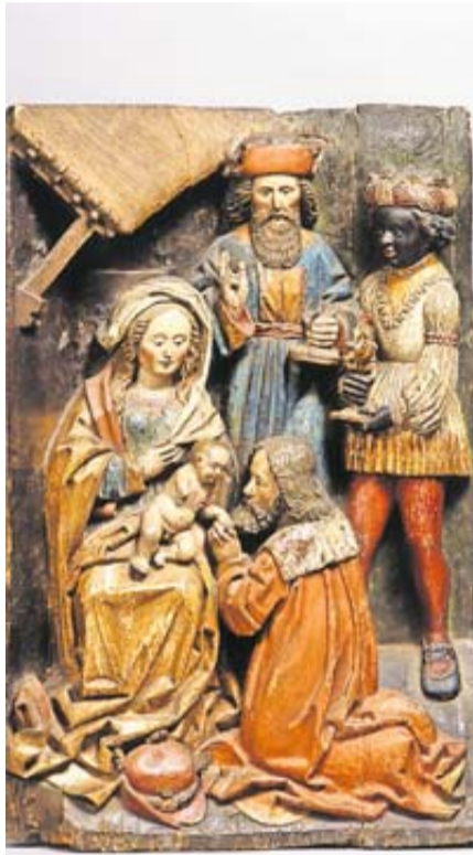
Anbetung der Heiligen Drei Könige (Franken, um 1500), Dommuseum Fulda.

Wie nähere ich mich in diesem Jahr dem Kind in der Krippe? Mit welcher Haltung schaue ich ihm in die Augen? Ich wünsche uns, dass wir von Herodes lernen: dass wir uns nicht von unseren Sorgen lähmen lassen. Ich wünsche uns, dass wir von den Schriftgelehrten lernen: dass unser Glaube tatsächlich ein tieferes Verstehen braucht, dann aber auch das persönliche Bekenntnis. Und dafür können wir gerade von denen lernen,