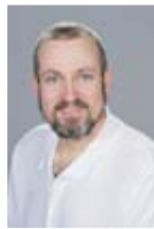
Kai Hergenröther Druckereiverwaltung