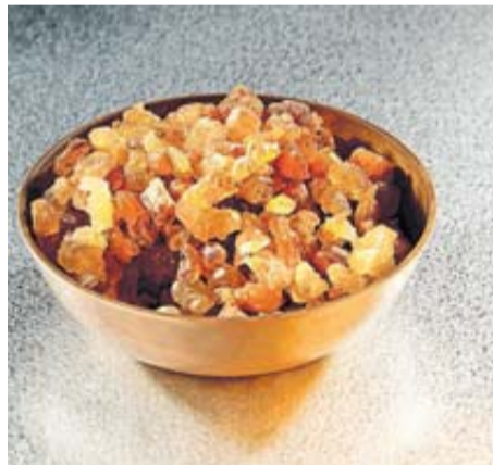
Myrrhe: Opfergabe und begehrte Arzneipflanze.

Die Myrrhe gehört zu den ältesten natürlichen Heilmitteln der Menschheit, deren Einsatz sich besonders bei Darmerkrankungen bis heute ins moderne Zeitalter bewährt hat.