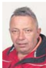
Peter Jost Versand