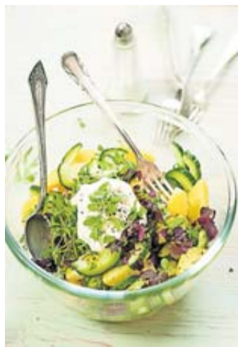
Kartoffelsalat gehört zu den Klassikern an Heiligabend: Für Frische sorgen Kräuter und Gurkenscheiben.