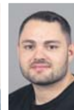
Ole Kleinfelder Weiterverarbeitung