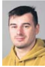
Vladimir Cermenchi Versand