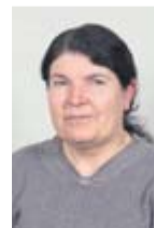
Shami Kaso Weiterverarbeitung