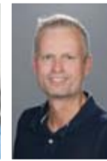
Michael Heil Redaktion