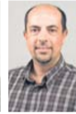
Frank Dietz Anzeigenabteilung