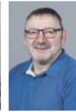
Andreas Franke Anzeigenabteilung