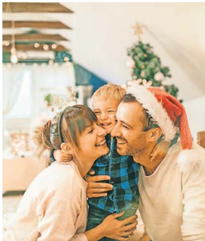
Entspannungsmomente gehören in die Festtage.

Für den Experten ist hier zuerst das Gespräch mit dem Kunden oder der Kundin wichtig, um die Ursache herauszufinden. „Wenn man merkt, dass mentaler Stress dahintersteckt, rate ich dazu, sich gezielt Entspannungsmomente zu schaffen.“ Das können ein Spaziergang durch die festlich beleuchtete Nachbarschaft oder ein ruhiges halbes Stündchen auf dem Sofa bei einer Tasse Kakao sein.