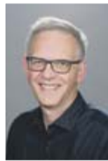
Stefan Herd Redaktion