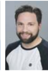
Philipp Franz Redaktion