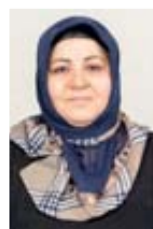
Yildiz Kozak Weiterverarbeitung