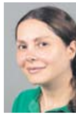
Hengameh Ghamkharitaghieh Weiterverarbeitung