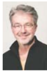
Wolfram Glatzel Korrektorat