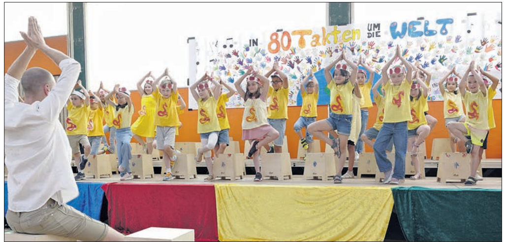
Juli: Zur Feier des 50-jährigen Bestehens der Comenius-Schule trommelten und tanzten die Kinder „In 80 Tagen um die Welt“.