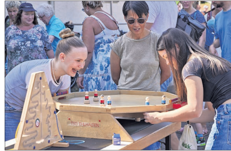
September: Großen Spaß hatten die Besucher beim Spiele-Fest in Ehlhalten.