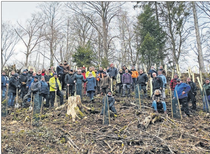
März: Die „Kohlestibbel“ riefen und viele Freunde und Mitglieder kamen zur Pflanzaktion im Nonnenwald bei Ehlhalten. 1875 Euro spendete die Kerbegesellschaft 2023 für die Aufforstung im Stadtwald.