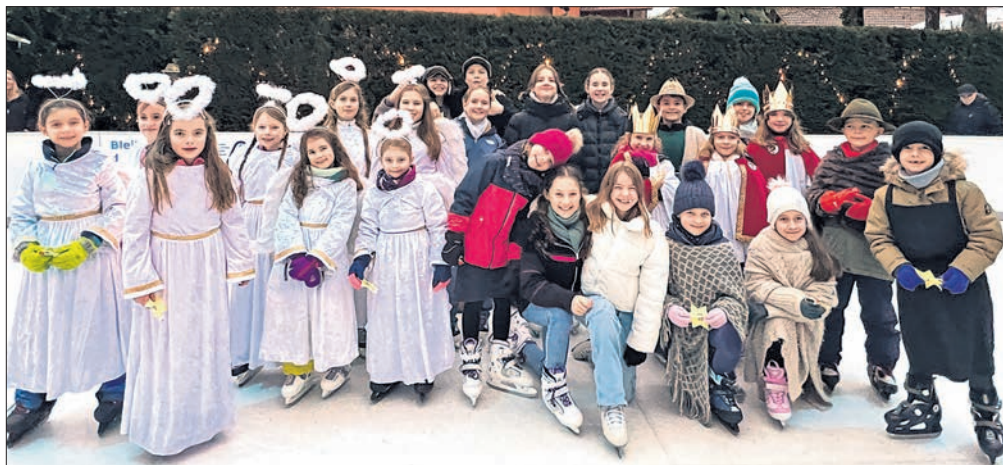
Mit ihrem Krippenspiel auf dem Eis verzauberten Niederjosbacher Kinder die Zuschauer am Heiligen Abend.

In Niederjosbach nutzten die Krippenspieler