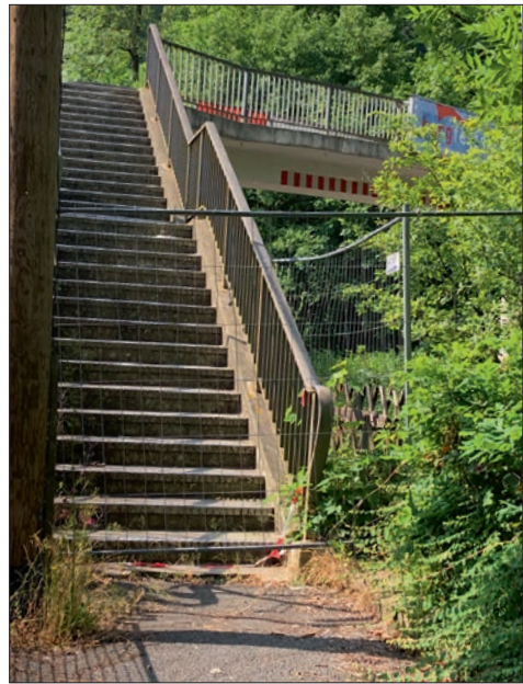
Der Zugang zur Fußgängerbrücke an der Burgstraße bleibt gesperrt.