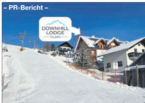
Die Downhill-Lodge liegt direkt an der Skipiste.