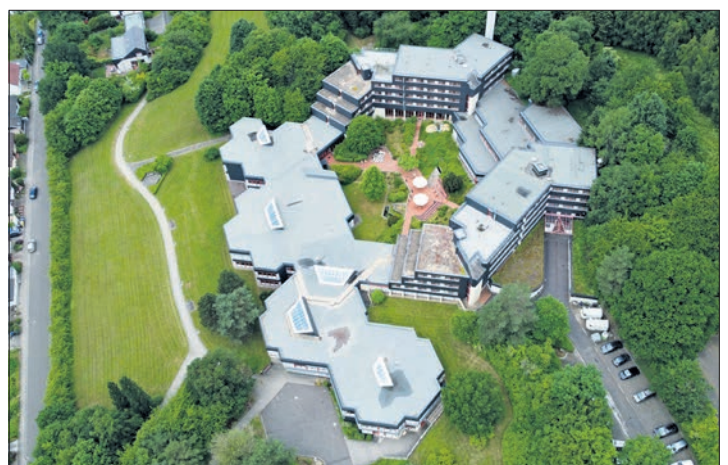
März: Der Investor GWH lädt zum Auftakt der Bürgerbeteiligung zu einer Info-Versammlung über die Entwicklung der leer stehenden Sparkassenakademie.

Im Rahmen der Energiewende gibt es weitere Vorhaben auf kommunaler Ebene. So wollen wir mit Niedernhausen gemeinsam einen Windpark aufbauen. Dem Vorhaben stimmte bereits das Eppsteiner Stadtparlament einstimmig zu. Da sich in der