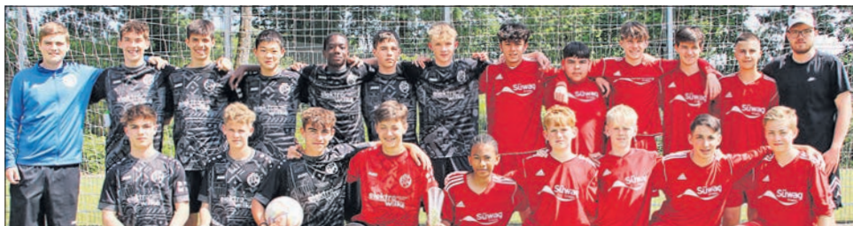
Die Eppsteiner C-Jugend beim „North Sea Trophy“ Turnier in Belgien.

Die Preisträger des Jugendpreises der Bürgerstiftung Eppstein stehen fest. Wie jedes Jahr wird die Preisübergabe auf großer Bühne beim Neujahrsempfang gefeiert. Diesmal hat die Stiftung drei Preisträger gekürt: Der erste Preis über 500 geht an die C-Jugendfußballer der Spielgemeinschaft SG Bremthal/ TuS Niederjosbach. Sie nahmen dieses Jahr über Pfingsten an einem internationalen Turnier mit Jugendmannschaften aus vielen europäischen Ländern in Belgien teil und erreichten den 8. Platz. Die jungen Eppsteiner fielen dort vor allem durch ihre faire Spielweise auf und errangen den Fairplay-Pokal. Als erste Mannschaft seit 20 Jahren erreichten sie 100 Prozent der Vergabepunkte, die sich aus gelben und roten Verwarnungen und dem allgemeinen Auftritt eines Teams zusammensetzen.