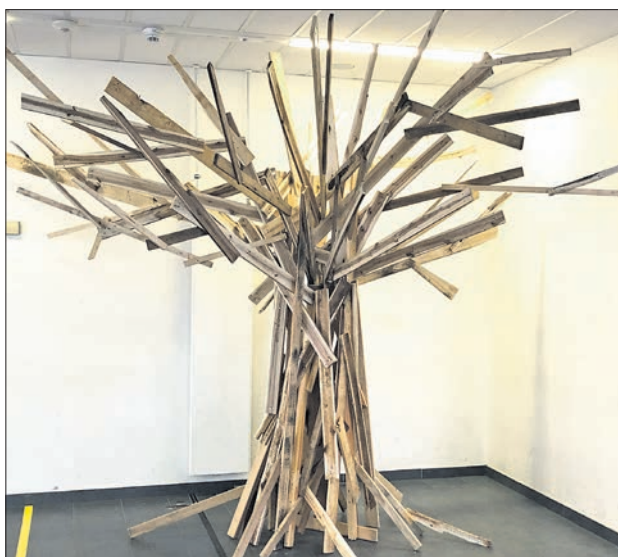
Juni: Der Recycling-Baum erhält zum Gedenken an das Attentat an der Freiherr-vom-Stein-Schule vor 40 Jahren Blätter mit den Gedanken von Schülerinnen und Schülern. Damals starben drei Kinder, ein Polizist und der Schulleiter. Der Täter richtete sich selbst.

In dankbarer Erinnerung bleibt uns eine im vergangenen Jahr verstorbene Bürgerin aus Ehlhalten. Fortsetzung auf Seite 11