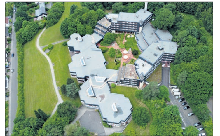
März: Der Investor GWH lädt zum Auftakt der Bürgerbeteiligung zu einer Info-Versammlung über die Entwicklung der leer stehenden Sparkassenakademie.

Im Rahmen der Energiewende gibt es weitere Vorhaben auf kommunaler Ebene. So wollen wir mit Niedernhausen gemeinsam einen Windpark aufbauen. Dem Vorhaben stimmte bereits das Eppsteiner Stadtparlament einstimmig zu. Da sich in der