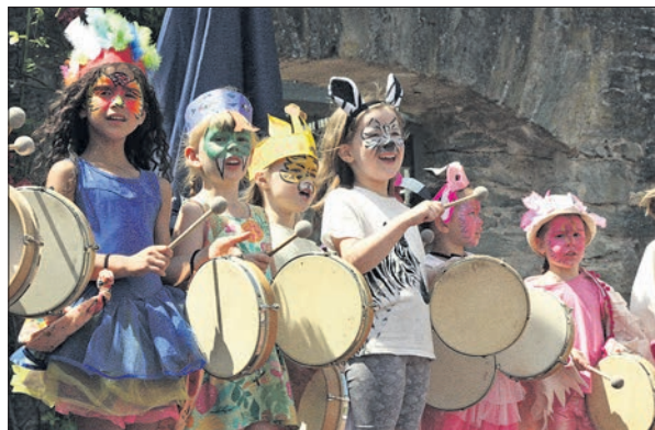
Juli: Zum Abschluss ihre Jubiläums „50plus“ feierte die Musikschule ein Familienwochenende auf der Burg.

Verbunden ist damit auch meine Bitte, sich zu engagieren, mitzuwirken, Demokratie zu leben. In politischen Debatten geht es oft hoch her. Häufig ist dann in den Medien von „Streit“ oder „Zoff“ die Rede, was viele Bürgerinnen und Bürger verunsichert. Nein! Debattieren gehört zur Demokratie, wir sind dankbar für unterschiedliche Ansichten, die geäußert werden dürfen. Wir sind dankbar für ein Leben in