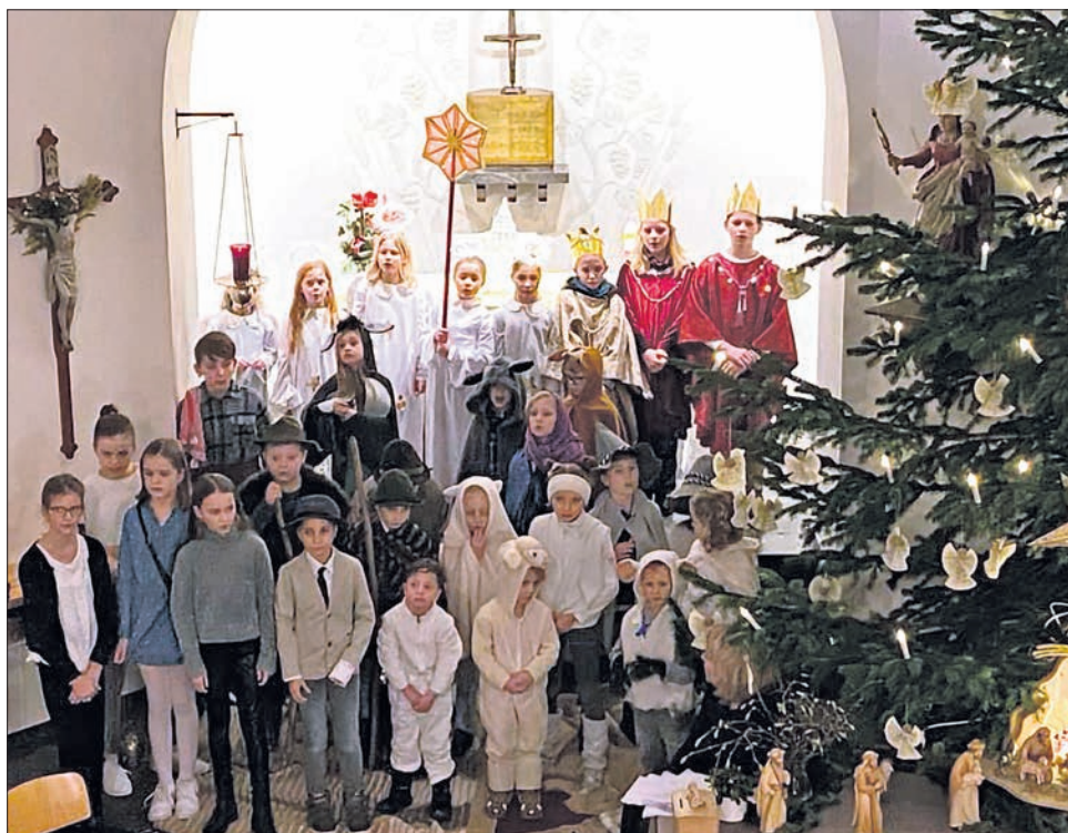
Auch in der Ehlhaltener St. Michael-Kirche fand ein raumfüllendes Krippenspiel mit vielen Darstellern statt.