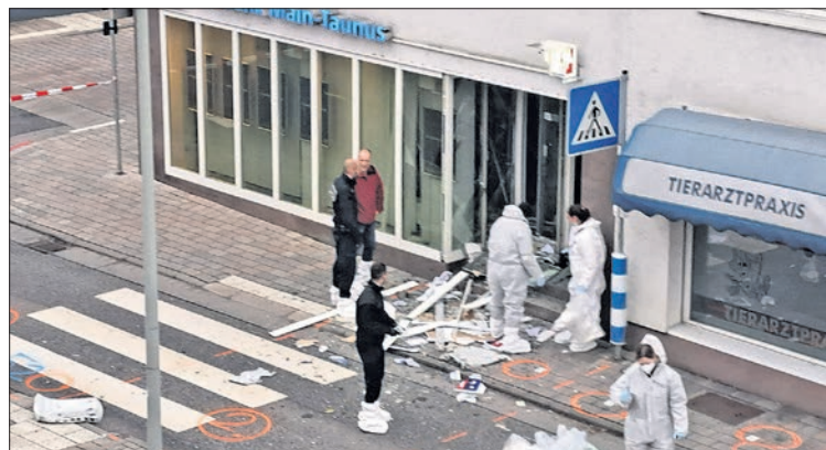
März: Spurensicherung nach dem Sprengstoff-Anschlag auf den Geldautomat in der Hauptstraße. Die Anwohner verbrachten die Nacht im Rathaus. Die Täter konnten bis heute nicht gefasst werden.