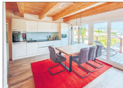
Essbereich im Penthaus-Apartment.