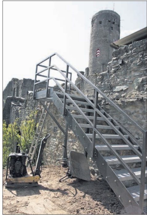
Mai: Die Sanierung des Burgturms ist abgeschlossen, am Wetterhaus wurden neue Hinweistafeln installiert. Danach wurde die neue Treppe zum Dach des Mainzer Kellers angebracht – rechtzeitig vor Beginn der Burgfestspiele.