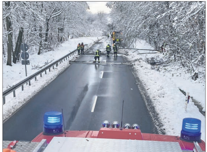
November: Noch während der Nacht und den ganzen nächsten Tag über rückte die Feuerwehr aus, um umgestürzte Bäume nach dem heftigen Wintereinbruch zu beseitigen.