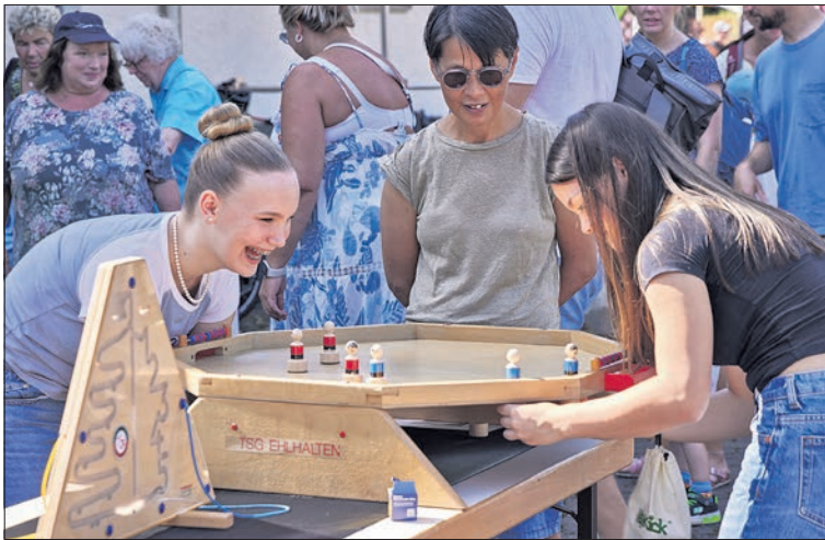
September: Großen Spaß hatten die Besucher beim Spiele-Fest in Ehlhalten.