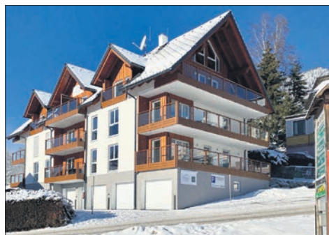
Außenansicht der Downhill-Lodge Tauplitz.