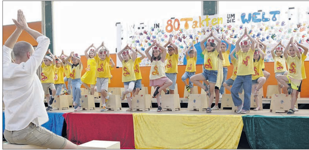
Juli: Zur Feier des 50-jährigen Bestehens der Comenius-Schule trommelten und tanzten die Kinder „In 80 Tagen um die Welt“.