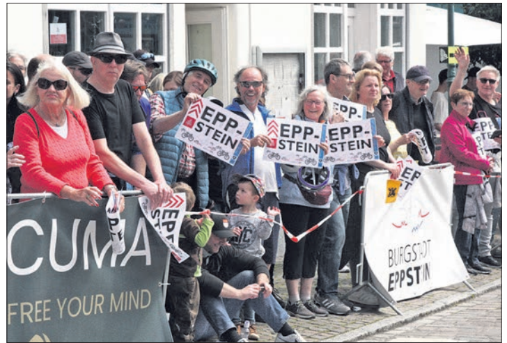
Mai: Die Eppsteiner jubeln den Rad-Profis beim Radrenn-Klassiker am 1. Mai vom Straßenrand aus zu.