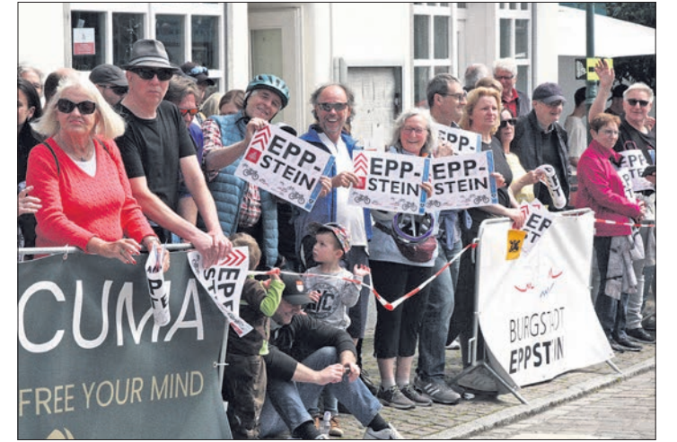
Mai: Die Eppsteiner jubeln den Rad-Profis beim Radrenn-Klassiker am 1. Mai vom Straßenrand aus.

werden: Eine neue Treppe führt im Ostzwinger auf den Mainzer Keller, damit die Tribüne für die Burgfestspiele und das Burgfest genutzt werden kann.