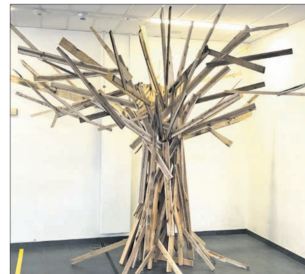
Juni: Der Recycling-Baum erhält zum Gedenken an das Attentat an der Freiherr-vom-Stein-Schule vor 40 Jahren Blätter mit den Gedanken von Schülerinnen und Schülern. Damals starben drei Kinder, ein Polizist und der Schulleiter. Der Täter richtete sich selbst.

In dankbarer Erinnerung bleibt uns eine im vergangenen Jahr verstorbene Bürgerin aus Ehlhalten. Fortsetzung auf Seite 11