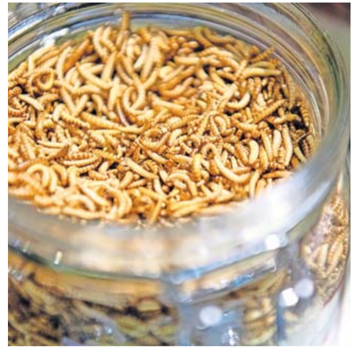
Getrocknete Mehlwürmer sind in der EU als Lebensmittelzutat zugelassen. Sie müssen auch auf der Zutatenliste - selbst wenn sie zu Mehl gemahlen werden - angegeben sein.