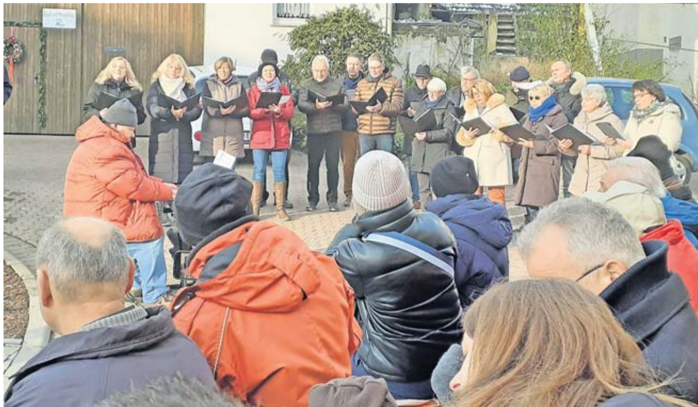
Der gemischte Chor der GV Germania trotzte bei der Einweihung der neu gestalteten Weehd in Ober-Hörgern den eisigen Temperaturen.

Münzenberg eröffnet Weehd in Ober-Hörgern