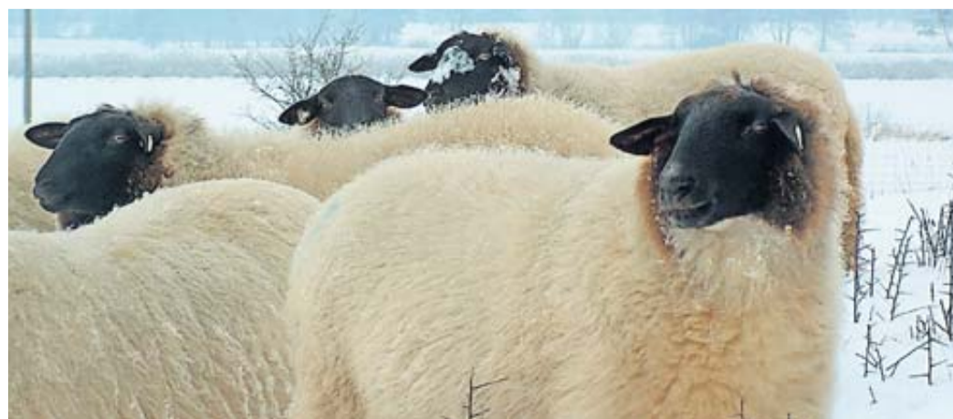
Dank ihrer dicken Wolle macht den Schafen Kälte und Nässe nichts aus. Durch die Kräuselung der einzelnen Wollfasern bilden sich kleine Luftkammern die dafür sorgen, dass sie gut geschützt sind.

land zur Futterherstellung in der Region hat, kann sich direkt an Familie Schmidt unter Telefon (0151) 55524064 oder (0175) 9171995 wenden.