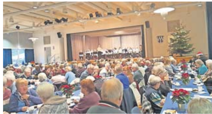
Gute Stimmung auf dem Fest der Stadt Karben.