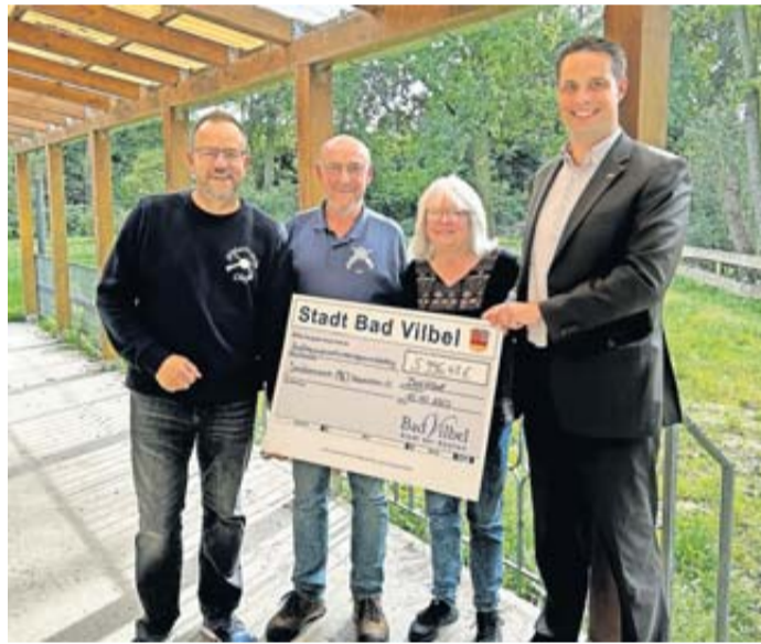
Der Schützenverein Massenheim freut sich über die Investitionszuschüsse der Stadt und des Ortsbeirats. Hier übergibt Erster Stadtrat Bastian Zander einen symbolischen Scheck für die städtischen Mittel.

Bad Vilbel. Der Schützenverein Massenheim hat jüngst Investitionszuschüsse sowie eine weitere Förderzusage der Stadt Bad Vilbel und des Ortsbeirats Massenheim erhalten, um seine Liegenschaft zu ertüchtigen. Konkret fließen die Förderungen in die bereits erfolgte Erneuerung der Abwassersammelgrube sowie in die Erneuerung der Heizungsanlage. Insgesamt wird der Schützenverein dann rund 14.300 Euro vom Magistrat und vom Ortsbeirat erhalten. Wie bei derlei Förderungen üblich, beteiligen sich sowohl der Magistrat über die Vereinsfördergelder, als auch der Ortsbeirat mit dem zur Verfügung stehenden Waldgeld zu je einem Drittel an den Investitionen. Für die Erneuerung der Abwassersammelgrube gab es bereits insgesamt 5.996 Euro und für die anstehende Heizungs Erneuerung kommen weitere 8.314 Euro dazu. „Es ist bei der Stadt Bad Vilbel eine gute Tradition, dass wir Vereine bei Investitionen unterstützen. Die Vereinslandschaft mit ihren vielen ehrenamtlich engagierten Mitgliedern leisten unglaublich viel für die Stadt und ihre Menschen und daher ist es uns ein großes Anliegen, die Vereine zu unterstützen“, erklärt Erster Stadtrat Bastian Zander die grundsätzliche Herangehensweise der Stadt Bad Vilbel.