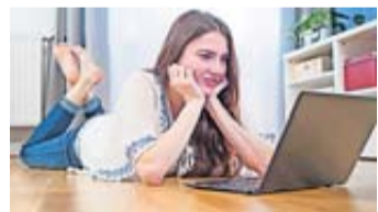
Softskills glaubhaft in der Bewerbung anzugeben, fällt vielen nicht leicht.

Übrigens: Bei der Erstellung der Bewerbungsunterlagen insgesamt fühlt sich jeder zweite Befragte (50 Prozent) sicher. Nur knapp jeder Zehnte (8 Prozent) gibt hier an, seine Kompetenzen nicht gut einschätzen zu können. Knapp jeder Vierte (23 Prozent) ist allerdings unsicher, wie die eigenen Kompetenzen richtig hervorgehoben werden können.