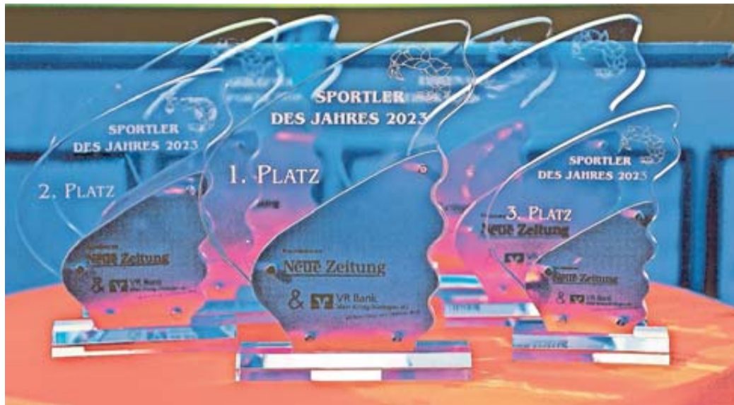
Auf die Sieger der GNZ-Sportlerwahl 2023 warten wertvolle Skulpturen und attraktive Geldpreise.

Verein und Sportart: TV Bad Orb, Triathlon und Quadrath-