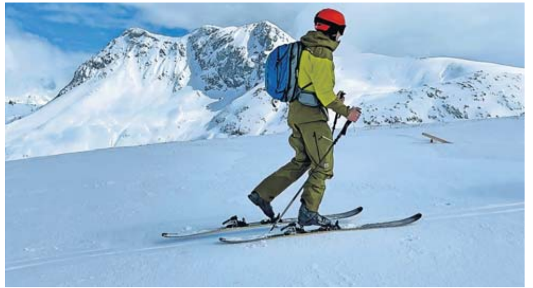
Schritt für Schritt Wer langsam in gemäßigten Höhenlagen aufsteigt, benötigt weder viel Kraft noch enorme Ausdauer.

Tourengehen ist für viele Skifahrer das Größte. Aufsteigen, wo es weit und breit keinen Lift gibt, und abfahren auf unberührten Hängen fernab überfüllter Pisten. Wer sich in der weißen Wildnis bewegt, sollte allerdings genau wissen, was er tut. Sonst endet der Drang nach der großen Freiheit in den Bergen womöglich in einer Katastrophe. «Skitourengehen will gelernt sein», betont Christian Putz. Der Skibergführer aus Lech am Arlberg hat schon unzählige Skifahrer und Snowboarder auf das Abenteuer Skitourengehen vorbereitet.