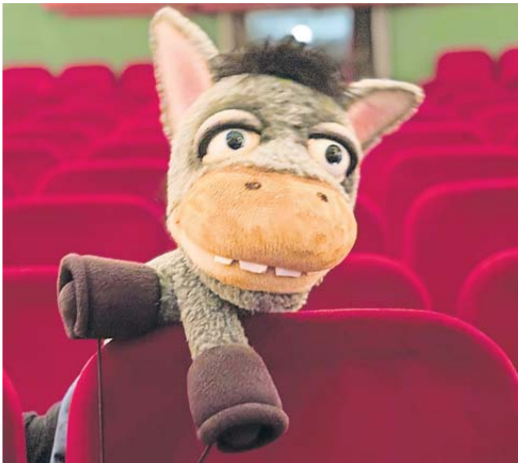
Esel Erli vom Erlebnispark macht aktuell ein Praktikum im Theatrum und wird Hauptrolle in einem Musical.