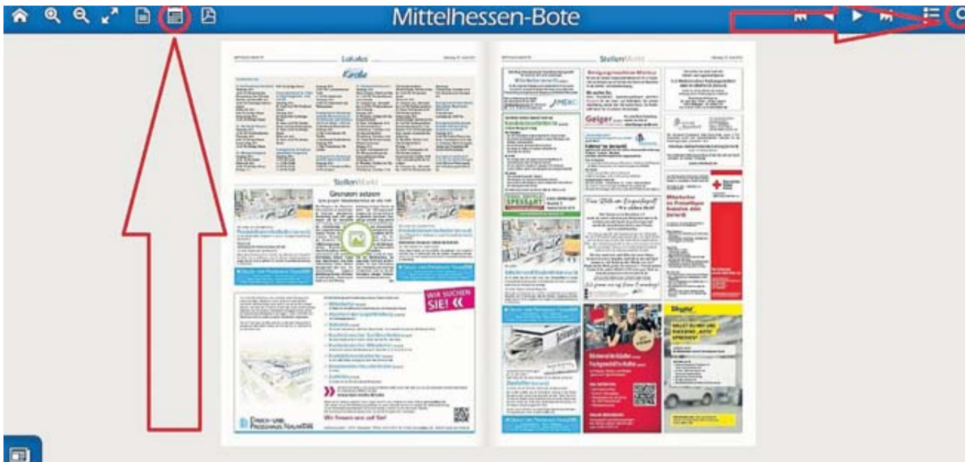
Das E-Paper des BOTEN hat viel zu bieten, wie den Zugriff auf alte Ausgaben über das Kalendersymbol oder die Volltextsuche.

Wie Sie von der E-Paper-Ausgabe profitieren können