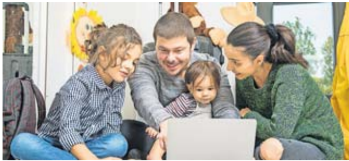
Bei einem Mallorca-Familienurlaub für vier Personen ermittelte die Stiftung Warentest einen Preisunterschied von gut 6600 Euro.

Ein Knackpunkt war, dass auf Mallorca das Hotelangebot für den angefragten Zeitraum zur Hauptsaison schon knapp war, während die Modell-Reise nach New York einen größeren Vorlauf gehabt hätte. Der Rat der Fachleute lautet deshalb: Gerade bei kurzfristigen Buchungen sollte man Angebote bei mehreren Online-Reisebüros vergleichen.