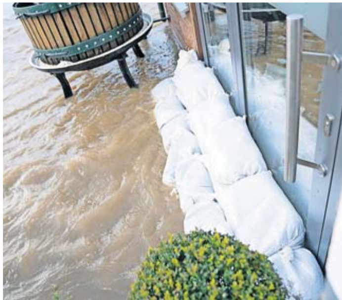
Bei Schäden am Haus durch Hochwasser greift die Elementarschadenversicherung.

Bei Schäden am Haus und Inventar, die etwa durch Überschwemmungen durch Schmelzwasser und Flusspegelanstiege verursacht werden, reicht die reguläre Hausrat- oder Wohngebäudeversicherung meist nicht aus. Stattdessen greift die Elementarschadenversicherung. «Sie kann ergänzend zur Wohngebäude- und Hausratversicherung abgeschlossen werden», sagt Bianca Boss, Vorständin beim Bund der Versicherten (BdV). Diese Zusatzversicherung deckt Schäden durch Überschwemmungen, Starkregen, Schneedruck, Erdbeben, Erdsenkung, erdrutsche, Vulkanausbrüche, Lawinen und