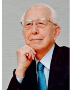
Fumihiko Maki, der international anerkannte Architekt, konnte für das Projekt des Kunstmuseums begeistert werden

OB MENDE: Sie gehen mit gutem Beispiel voran. Das Museum Reinhard Ernst wird weit über die Grenzen von Deutschland hinaus, allein schon wegen seines Alleinstellungsmerkmals, ausschließlich abstrakte Kunst zu zeigen, zu einem Begriff werden.