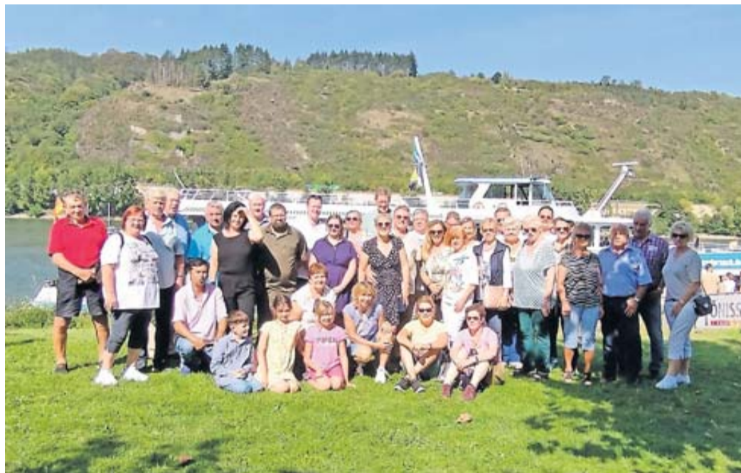
Das eine Bild zeigt die Vereinsmitglieder nach Ankunft vor dem Schiff.

So gestärkt ging es weiter nach Andernach. Ein kurzer Fußweg und die Gruppe wurde von Frau Bathke im Besucherzentrum des Geysirs begrüßt. Dort bekam man einen Eindruck wie vielseitig die Geschichte der Erde ist. Nicht nur die Kinder, auch die Erwachsenen konnten mit großer Begeisterung die Experimentierstation benutzen. Wie man einen Wasserwirbel oder einen sog herstellern kann, wurde genauestens auspro-