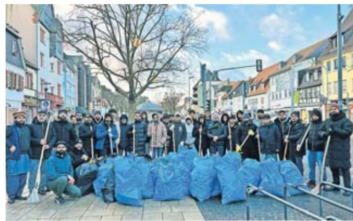
Die Ahmadiyya Jugend ist eine der größten und ältesten muslimischen Jugendorganisationen Deutschlands und versteht sich als Teil der deutschen Zivilgesellschaft. So initiiert die Organisation zahlreiche Projekte wie Spendenläufe zugunsten von Hilfsorganisationen, Obdachlosenspeisungen, Blutspendeaktionen, Seniorenheimbesuche oder die Straßenkehraktion zum Neujahr.

Es nahmen insgesamt 29 Gemeindemitglieder an der ehrenamtlichen Aktion teil. Es kamen 40 gefüllte Müllsäcke mit Raketensresten, Böllern und weiteren Abfällen zusammen – ein neuer Rekord für die Jugendlichen. Im Vergleich: 2018 waren es noch 20 Müllsäcke, 2020 kehrten die Ehrenamtlichen ganze 36 Säcke zusammen. Dieses Jahr stand die Neujahrsputzakti-