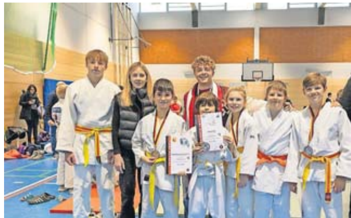
Die Judoka des Fun-Ball-Dortelweil überzeugten beim Nikolausturnier in Hadamar mit starken Leistungen und erkämpften sich zahlreiche Podestplätze.