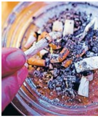
Die letzte Kippe: Wer genau weiß, warum er mit dem Rauchen aufhören will, hat eine stärkere Motivation.

Stark bleiben, das ist nun das Motto. Dafür kann man den vier A-Tipps folgen, die die BZgA vorschlägt: - Aufschieben: Auch wenn es sich nicht so anfühlt - das Verlangen nach einer Zigarette lässt meist nach, oft schon nach 30 Sekunden bis drei Minuten. Eine Taktik, um Zeit verstreichen zu lassen: zehnmal tief ein- und ausatmen. - Ausweichen: „Willst du auch eine?“. Hilfreich ist, Situationen wie diesen vorausschauend aus dem Weg zu gehen, rät die BZgA. Wer dennoch bei Raucherpausen dabei sein will, kann offen mit dem eige-