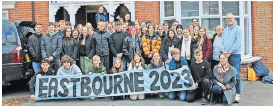
Die Schüler am Eastbourne Educational Centre.

Am nächsten Tag stand ein Tagstrip zur Nachbarstadt Brighton an, welcher mit einem Besuch im Sea Life begann, dem ältesten noch aktiven Aquarium der Welt. Nach längerer Freizeit in der Stadt