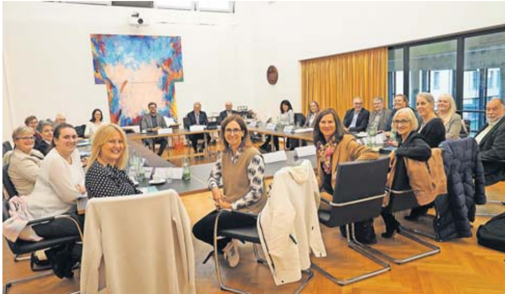
Beim Runden Tisch „Quereinstieg in die Kindertagesbetreuung“ diskutierten die Anwesenden angeregt und anregend über das Thema.

Auch die pädagogischen Aufgaben und die Funktion der Fachkräfte, die sich aus ihrer hohen fachlichen Qualifikation ergeben, dürften im Gefüge der Einrichtungen nicht in Frage gestellt werden. Hierzu wurde die Entwicklung eines Qualifizierungsangebotes für Fachkräfte zur Mitarbeit in den Kindertagesbetreuungseinrichtungen disku-