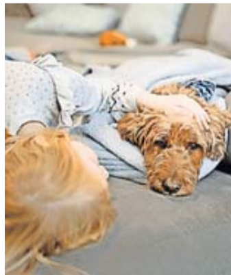
Der Verein für sozialpädagogisches Management (VSPM) betreut Kinder und Jugendliche in intensiv- und traumapädagogischen Wohngruppen.

Für die Saison 2024 wurden zwei Vereine ausgewählt, die sich um das körperliche und seelische Wohl der Men-