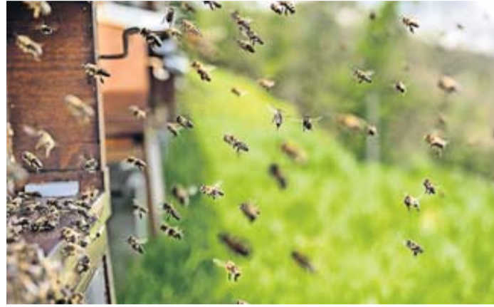
Im Frühjahr werden auch im Bergwinkel die ersten Honigbienen ausschwärmen. Die Temperaturen müssen dazu über zwölf Grad Celsius klettern.

Ein aktives Vereinsleben und großes Interesse an Bienenzucht in Zusammenhang mit Umwelt, Natur und Ökosystemen kennzeichnet den Imkerverein Schlüchtern. Daher hatte sich der Verein angeboten, den 54. Hessischen Imkertag zu veranstalten und dazu auch die Bergwinkel-Werkstätten zu holen. Die Bergwinkel-Werkstätten gehören zur BWMK gGmbH (Behinderten Werk Main-Kinzig) und bieten