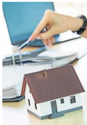
Immobilie geschenkt bekommen? Dann ist das nicht nur ein Privileg, sondern auch eine Verpflichtung.

Hinzu kommt, dass sowohl bei Häusern als auch in WEG häufig Sanierungsstau existiert, der irgendwann teuer abgear-