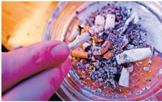
Die letzte Kippe: Wer genau weiß, warum er mit dem Rauchen aufhören will, hat eine stärkere Motivation.

- Abhauen: Und wenn es kaum auszuhalten ist, in der