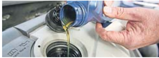
Ungeöffnete Ölfaschen sind für gewöhnlich bis zu fünf Jahre haltbar, bereits geöffnete Gebinde maximal ein Jahr.

Das Motoröl im Auto muss regelmäßig gewechselt werden. Welcher Schmierstoff genau für den eigenen Pkw vom Hersteller freigegeben ist und wie oft ein Austausch fällig wird, steht in der