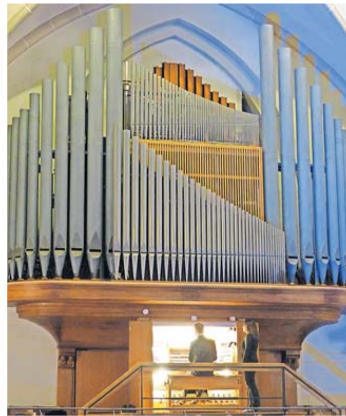
Die historische Walcker-Orgel in der Dankeskirche wird nach 58 Jahren abgebaut. Kantor Frank Scheffler freut sich auf die kommende Ära mit der modernisierten Klangquelle.

ation, und die Kirchenbesucher können sich auf die Einweihung der neuen „Klangquelle“ im vierten Quartal 2024 freuen.