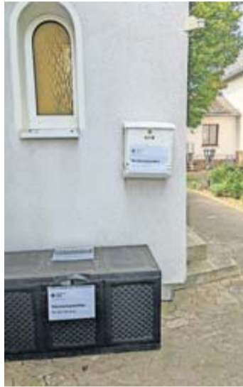
Sammelbehälter des DRK am DRK-Heim Gambach, Am Heiligen Stock 2 (direkt neben der katholischen Kirche).

Bis zum 31. Januar nimmt das DRK Münzenberg am DRK-Heim in Gambach, Am Heiligen Stock 2, noch Kerzen- und Wachsspenden entgegen. Jeder Bürger ist herzlich eingeladen, seine ungenutzten Kerzen- und Wachsreste beizusteuern.