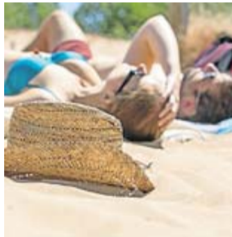
Wer im Laufe des Kalenderjahres den Job wechselt, muss dem neuen Arbeitgeber unter Umständen eine Bescheinigung über den bereits genommenen Urlaub vorlegen.