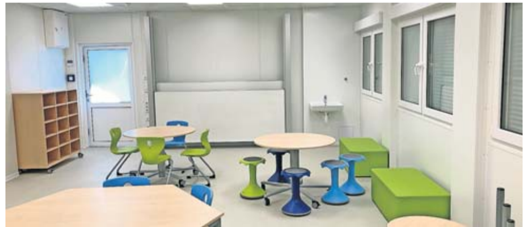
Das neue Mobile Raumsystem an der Eichendorff-Schule bietet vier zusätzliche Räume, die jeweils etwa 55 Quadratmeter groß sind.

Zur kurzfristigen räumlichen Erweiterung wurde an der Eichendorff-Schule in Niddatal-Ilbenstadt seit Juli 2023 ein Mobiles Raumsystem errichtet, welches aus vier Räumen besteht, die jeweils etwa 55 Quadratmeter groß sind. Nun steht die Anlage punkthaltig zum neuen Jahr neben der Turnhalle, sodass die Schülerinnen und Schüler dort seit dem Ende der Weihnachtsferien beschult und betreut werden können. Zwei Klassenräume sind im Obergeschoss angesiedelt und bieten mit Einzeltischen, rollbaren Regalen und Sofas eine leicht umzuräumende, flexible Einrichtungsvarianten.