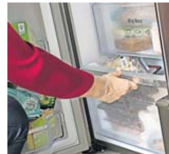
Tiefgekühltes bleibt lecker, wenn man beim Einfrieren der Lebensmittel und Speisen Gefrierbrand vermeiden kann.

Die Warentester raten übrigens, Hefeteig für Kuchen und Pizza auf Vorrat zu produzie-