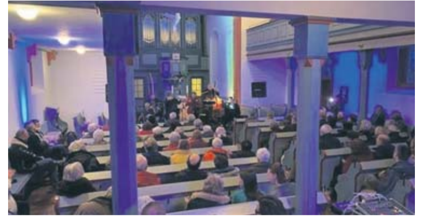
Blue Church bezauberte die Besucher in der blau illuminierten Rendeler Kirche mit einem mitreißenden Konzert.

„Walking with the King“, „Mood Indigo“ und „Just a Closer Walk“ folgten, bevor „Amazing Grace“ nach zwei Stunden den offiziellen Teil