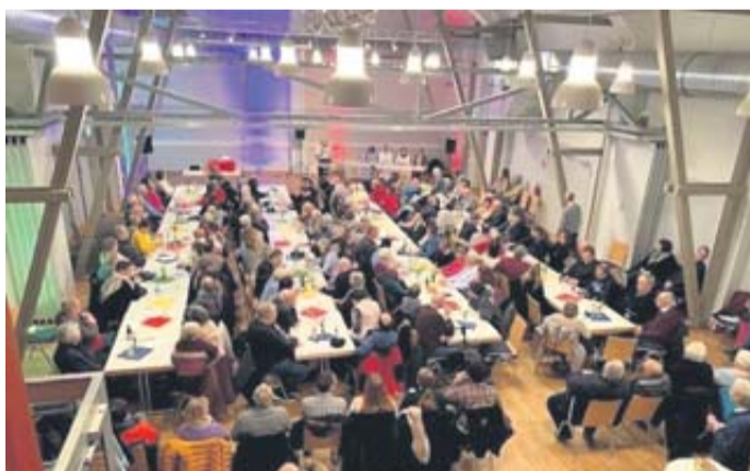
Rendel feiert den Auftakt seines 1250-jährigen Jubiläums mit Prominenz und vielseitigen Veranstaltungen.

Vielfältiges Jubiläumsjahr in Rendel: Voller kultureller Höhepunkte