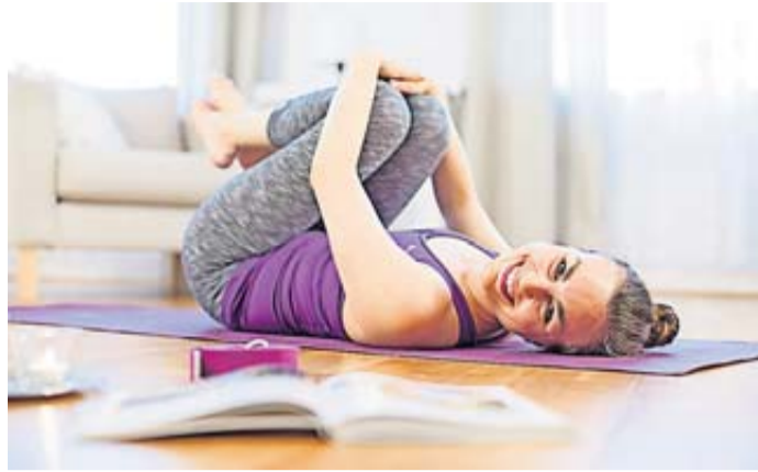
Schon zehn Minuten täglich reichen aus, um die Rückenmuskulatur zu stärken.

Dafür reichen schon zehn Minuten, zum Beispiel