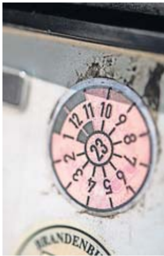
Die HU-Plakette gibt an, wann die nächste Hauptuntersuchung fällig ist.

Dazu kommt: Wurde die Frist um mehr als zwei Monate überschritten, wird eine erweiterte HU fällig, für die laut