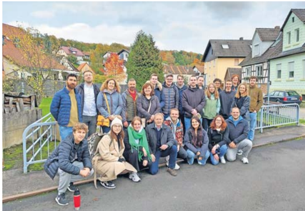
Studierende der JLU Gießen, ihre Betreuer der wfg, JLU, Landesgartenschau Oberhessen 2027 gGmbH und Vertreter der Stadt Ortenberg bei der Exkursion in Bergheim und Bleichenbach, um Forschungsfragen zu Dorfpotenzialen im Kontext der LGS 2027 zu beantworten

Wetteraukreis. Die Vorbereitungen für die Landesgartenschau (LGS) 2027 in Oberhessen laufen auf Hochtouren. Unter dem Motto „Wir sind Garten“ verspricht die LGS ein buntes und blühendes Ereignis für die gesamte Region zu werden. In Vorbereitung auf dieses bedeutende Großereignis ging die erfolgreiche Kooperation zwischen der Justus-Liebig-Universität (JLU) Gießen und der Wirtschaftsförderung Wetterau GmbH (wfg) mittlerweile in die zweite Runde. „Die Zusammenarbeit mit der JLU ermöglicht es uns, wertvolle Impulse für die nachhaltige Entwicklung unserer Stadt- und Ortsteile zu gewinnen. Die Studierenden bringen frische Ideen und einen neuen Blickwinkel in die Projektarbeit ein, was für uns äußerst bereichernd ist“, erklärt Bernd-Uwe Domes, Geschäftsführer der wfg.