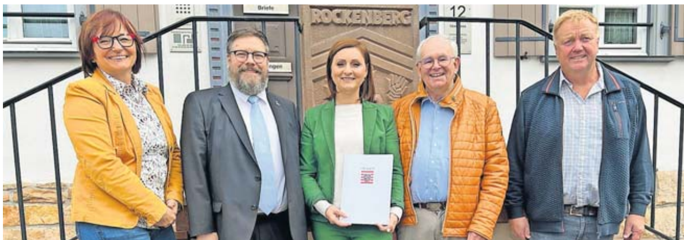
Die beiden Kommunen setzen auf eine vertiefte interkommunale Zusammenarbeit, um gemeinsam zukunftsfähige Lösungen zu entwickeln.

Rockenberg und Münzenberg starten IKZ-Projekt