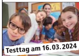
Testtag am 16.03.2024