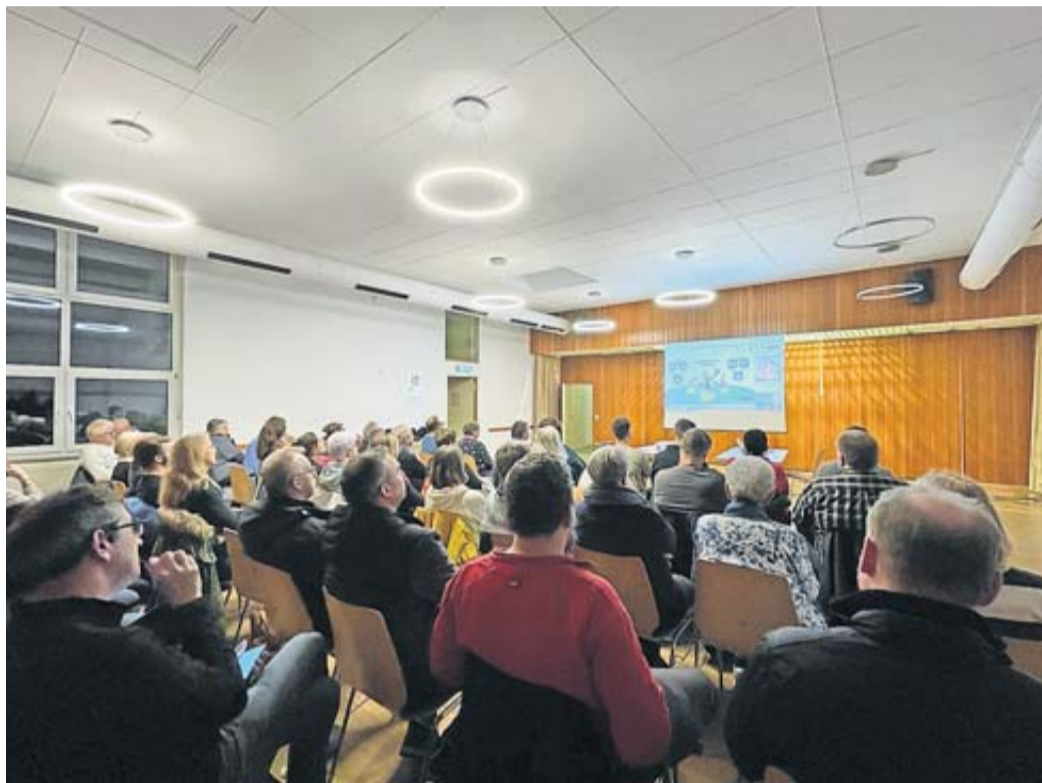
Mehr als 40 Interessierte kamen zur „DorfFunk“-Kick-Off-Veranstaltung in Geiß-Nidda.

„DorfFunk“-App in drei Wetterauer Dörfern erfolgreich in Betrieb genommen