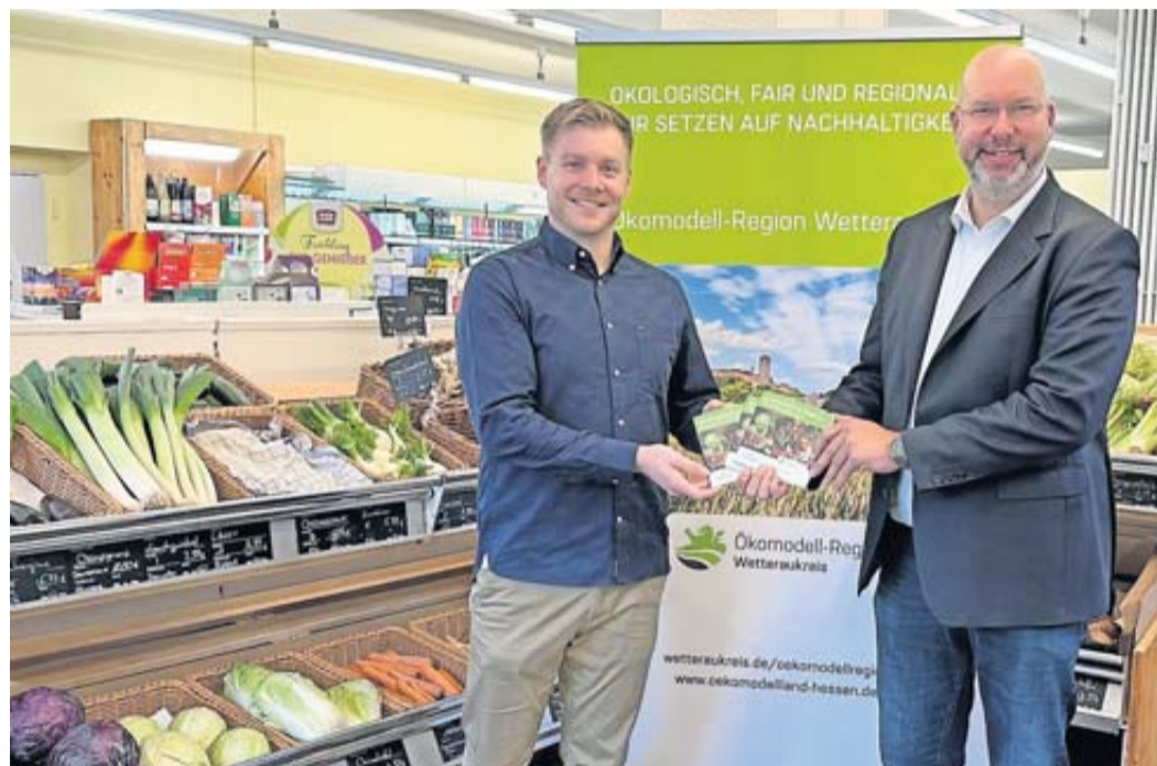
Die vierte Auflage des Bio-Einkaufsführers Wetterau präsentiert eine Fülle an regionalen Bioprodukten.

Auch einen Saisonkalender enthält der Einkaufsführer. Dieser hilft dabei, Obst und Gemüse dann zu kaufen, wenn es in der Region Saison hat. Das garantiert die bestmögliche Qualität und reduziert Transportwege. Auch das Premiumsteak muss dank des Bio-Einkaufsführers nicht mehr anreisen – denn auch vor Ort gibt es Bio-Rindfleisch zu kaufen. Nicht zuletzt stellen sich im Bio-Einkaufsführer mehrere Solidarische Landwirtschaften vor, die immer wieder neue Mitglieder aufnehmen. Darüber hinaus gibt es die Möglichkeit, sich Bio-Lebensmittel per Abokiste nach Hause liefern zu lassen.