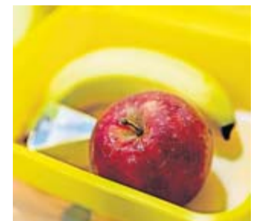
Zu einer gesund gefüllten Brotbox gehört auch frisches Obst oder Gemüse.

Gut konzentriert durch den Unterricht eines Schultages - dabei hilft auch die Schulbrotbox. Wenn sie denn sinnvoll gefüllt ist. Diese drei Dinge gehören laut der Verbraucherzentrale Brandenburg hinein: 1. Ein Getreideprodukt: Das kann eine Scheibe Brot oder ein Brötchen sein, aber auch ein Müsli oder Wrap. Erste Wahl ist Vollkorn, denn das hält länger satt. 2. Obst oder Gemüse - oder beides. Gerne das, was das Kind am liebsten mag, und bei größeren Früchten am besten schon in handliche Happen geschnitten. 3. Ein Milchprodukt, also zum Beispiel Käse, Frischkäse oder Naturjoghurt. Tipps der Verbraucherzentrale, um den Appetit der Kinder anzuregen: Mal eine Handvoll Nüsse in die Dose tun oder Obst, Brot und Käse in Stück-