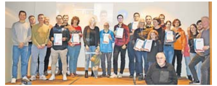
Die Gewinner des Jugendförderpreises des Sportkreises Wetterau e.V. stehen für ihr außergewöhnliches Engagement für die Jugendarbeit in ihren Vereinen.

Wetteraukreis. Mit dem Jugendförderpreis des Sportkreises Wetterau e.V. sind jetzt der SV Germania 1920 Ockstadt, der TSV 1919 Ebergöns und der Trampolinverein „Die Kängurus“ aus Dauernheim ausgezeichnet worden. Der Preis wird für außergewöhnliches Engagement für die Jugendarbeit im Verein verliehen und ist mit insgesamt 5.000 Euro dotiert. Der Jugendförderpreis als solcher wird in drei Kategorien verliehen. Die richten sich wiederum nach der Anzahl von Kindern und Jugendlichen in den Vereinen. Die Jury, die sich aus den Vorstandsmitgliedern der Sportkreisjugend zusammensetzt, bewertet neben den sportlichen Angeboten unter anderem überfachliche Veranstaltungen, die Mitsprache von Kindern und Jugendlichen im Verein oder die Frage wie umfangreich Vereine Kinder- und Jugendarbeit konkret unterstützen. Sieger der Gruppe 1, der Gruppe der Vereine mit einem hohen Anteil an Kin-