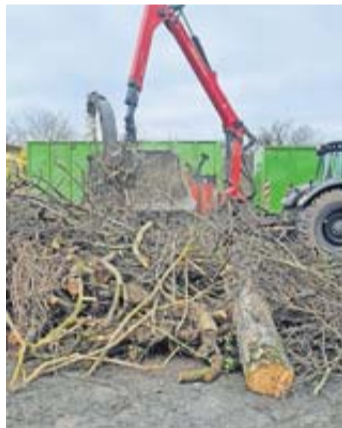
Bürgerinnen und Bürger können Obstbaumschnitt zur zentralen Sammelstelle bringen.

Rosbach. Streuobstwiesen gelten als bedeutendes Kulturgut und bieten eine reiche Artenvielfalt. In den Stadtentwicklungsplänen von Rosbach v.d. Höhe wurden sie als integraler Bestandteil der Wetterauer Kulturlandschaft anerkannt. Die Stadt hat ein Streuobstwiesenkonzept erarbeitet, um diese landschaftsprägenden Areale zu schützen. Ein Hauptproblem besteht jedoch in dem oft vernachlässigten Zustand vieler Streuobstwiesen vor Ort. Die Gründe hierfür sind vielfältig und werden im Rahmen des Konzepts untersucht. „Bürgermeister Steffen Maar erläutert: „Ein Hindernis bei der Vernachlässigung dieser Flächen ist die Entsorgung des anfallenden Schnittguts. Um dies zu erleichtern, sieht das Konzept die Einführung von 'Häckseltagen' vor, an denen das Schnittgut zentral gesammelt und später von