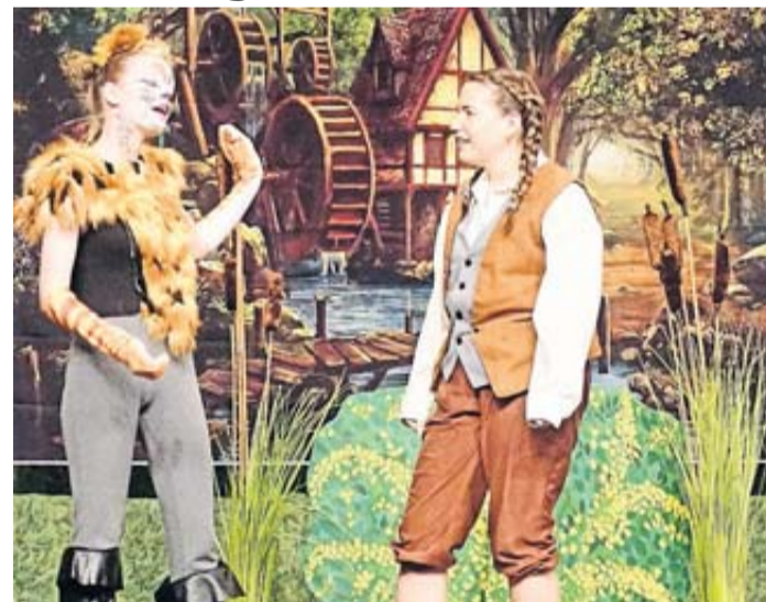
Das Jugendensemble des Kultur- und Carnevalvereins Bingenheim probt intensiv für die Musicalaufführung von „Der gestiefelte Kater“.