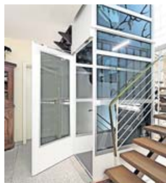
Ein Highlight im Einfamilienhaus: Ein kleiner Lift.

Aber aus den anfangs recht pragmatisch designten Modellen sind optisch kleine Aufzüge entstanden. Mit blickdichter oder durchsichtiger Kabine können solche Plattformlifte sogar der Hingucker im Haus sein. Sie haben «überhaupt nicht mehr die Anmutung eines Krankenhilfsmittels», sagt Udo Niggemeier von der Vereinigung mittelständischer Aufzugsunternehmen in Bissendorf.