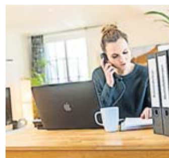
Damit Sie nicht bei der Suche nach dem passenden Feld verzweifeln: Manche Formulare der Einkommensteuererklärung wurden für das Veranlagungsjahr 2023 verändert - etwa das für Einkünfte aus Vermietung und Verpachtung.