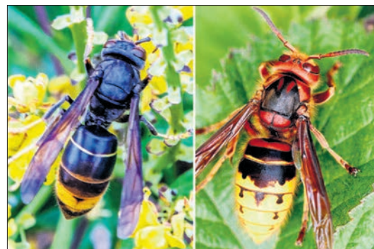
Vergleich Asiatische Hornisse (links) und Europäische Hornisse

Das Gift der Asiatischen Hornisse entspricht üblichen Wespenstichen und ist somit nur für Allergiker gefährlich. In jedem Fall sollte eine Annäherung vermieden werden und jede Nest-sichtung der Unteren Naturschutzbehörde des MTK zur Registrierung und fachgerechten Beseitigung gemeldet werden. Zu erreichen ist sie über das Meldeportal für Hessen: www.hlnug.de unter MTK-UNB.