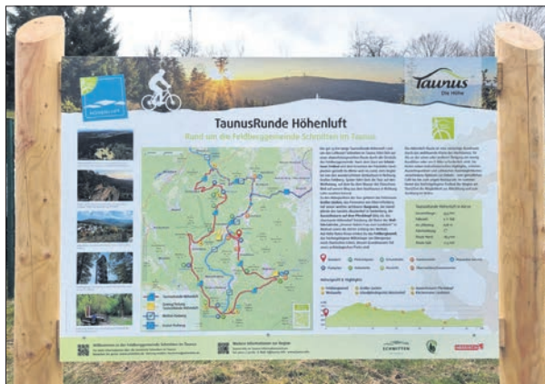
Die Portaltafeln entlang der Taunusroute Höhenluft präsentieren die charakteristische Silhouette des hohen Taunus mit seinen markanten Gipfeln und dem weithin sichtbaren Fernmeldeturm.

Die Portaltafeln entlang der Route präsentieren die charakteristische Silhouette des hohen Taunus mit seinen markanten Gipfeln und dem weithin sichtbaren Fernmeldeturm. Diese Darstellung wird zukünftig auf allen Portaltafeln verwendet, um eine einheitliche visuelle Identität zu schaffen. Neben einer übersichtlichen Karte zur Wegeführung wird die Tafel durch Höhenprofil, Routenhighlights und eine passende Bildergalerie ergänzt. Die Route selbst ist durch eine zweifarbige Plakette markiert, welche das Logo des Routennetzes der Taunus-Runden in der linken oberen Ecke abbildet.