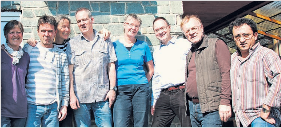
Die Band „Karizma“ auf einem Foto von ihrer CD von 2012.