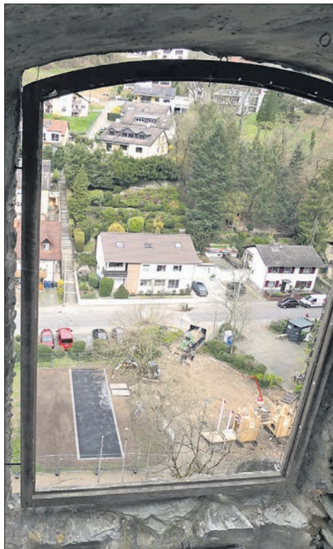
Blick durch ein Fenster in der Nordmauer auf die Boule-Bahn und das neue Klettergerüst, eine Miniatur-Burg aus Holz.

Diese Originalquellen sind seit 100 Jahren öffentlich einsehbar und zeigen, wie es um die Pressefreiheit in der Weimarer Republik bestellt war. bpa