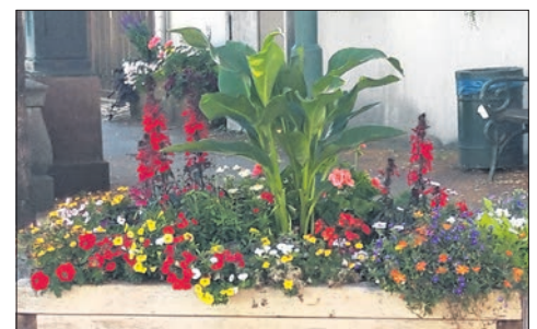
Die Bepflanzung der Blumenkübel an den Straßen wie hier 2023 sind Augen- und Bienenweide.

ihre volle Adresse angeben. Der VVE hat in Aussicht gestellt, die Spendensumme gegebenenfalls aufzurunden.