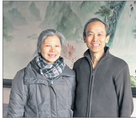
Das Ehepaar Leong vor dem Panoramawandbild im Restaurant Peking.

Viele Geschäfte und Lokale wurden in dieser Zeit geschlossen. „Wir haben mit unserem Restaurant dazu beigetragen, dass Vockenhausen lebenswert bleibt“, sind die beiden überzeugt. bpa