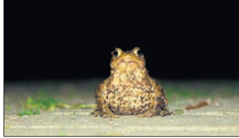
Jetzt sitzen und hüpfen sie wieder nachts auf den Straßen: Kröten und Frösche auf dem Weg zu ihren Laichplätzen.

Hinweisschilder weisen darauf hin, wo die Tiere besonders zahlreich anzutreffen sind. Wer die Geschwindigkeit beim Autofahren vor allem in der Dämmerung und nachts anpasst, kann die Amphibien auf der Straße frühzeitig erkennen und bestenfalls um sie herumfahren. Daneben bieten Umweltverbände wie der NABU die Möglichkeit, aktiv am Amphibienschutz teilzunehmen. In Eppstein kontrolliert und repariert seit etlichen Jahren Kurt Müller