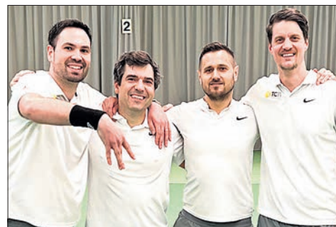
Tabellenerster und Aufstieg: Die Mannschaft der Herren 30 ist stolz auf eine beeindruckende, ungeschlagene Leistung in der Winterrunde des HTV.

Trainingszeit ist freitags ab 18.30 Uhr in der Bienroth-Halle.