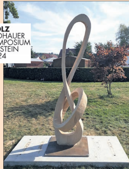
P. Ariane Ehingers Skulptur „Continuum XXII“.

Worauf sich die Künstlerin beim neunten Eppsteiner Holzbildhauersymposium besonders freut: auf den regen Austausch mit ihren