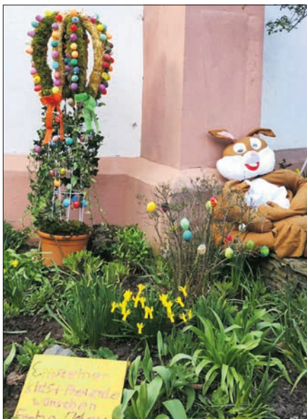
Lässig liegt die Osterhasenfigur vor der Kirche. Einen Tag lang war sie verschwunden.

Unabhängig davon war der vorösterliche Familiennachmittag des Vereins im Bürgerhaus ein voller Erfolg. 65 Jungen und Mädchen zwischen eineinhalb bis zehn Jahren hatten ihren Spaß. Ob auf der von Torsten Kunze gestellten Hüpfburg, bei den Spielen oder beim Basteln. An der Schminckecke standen die Kleinen Schlange.