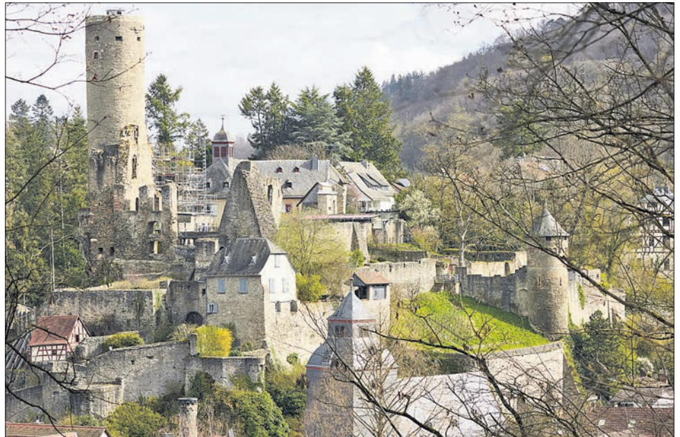
Einen Hauch von Frühlingsgrün auf der Burg hat der Ehlhaltener Fotograf Walter Adler auf seinem Spaziergang rund um Eppstein für uns eingefangen.

Sonntag: Um 11 Uhr Feier der Erstkommunion in St. Margareta Bremthal. Die Vernissage zur Fotoausstellung von Walter Helmeling in der „Wunderbar Weite Welt“ im Stadtbahnhof beginnt um 16 Uhr.