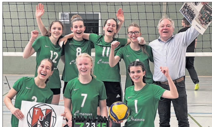
Im Saisonfinale Platz 3 gesichert: Die Volleyball-Damenmannschaft des TuS-Niederjosbach.

Das letzte Saisonspiel für die Volleyball-Damen des TuS Niederjosbach gegen den direkten Tabellennachbarn TG Winkel vergangene Woche gestaltete sich noch einmal spannend. Im Hinspiel noch mit 3:0 vom TuS besiegt, leisteten die Gegnerinnen dieses Mal in eigen-