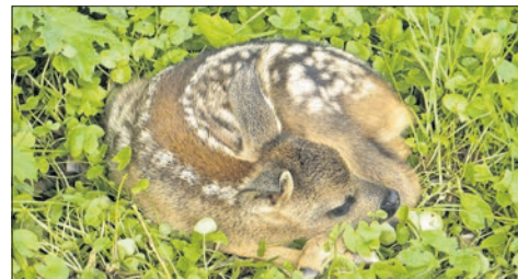
Rehkitz in Bad Soden.

In Naturschutzgebieten müssen Menschen auf den Wegen bleiben und Hunde an der Leine geführt werden; Verstöße werden mit Geldstrafen geahndet. In einigen Kommunen gibt es Regelungen zur Leinenpflicht. Wer picknicken geht, sollte anschließend seine Abfälle mitnehmen, ermahnt Overdick.