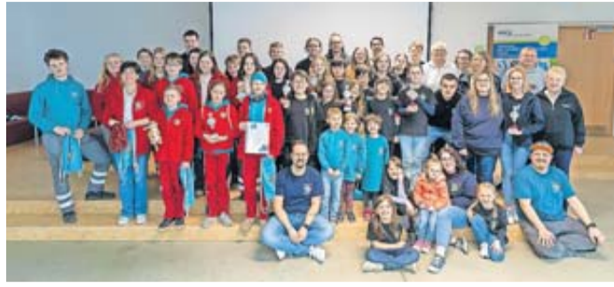
Die Teilnehmerinnen und Teilnehmer des Jugendrotkreuz-Kreiswettbewerbs mit dem Orga-Team sowie den Betreuerinnen und Betreuern.

Die Teilnehmerinnen und Teilnehmer gingen in vier Altersstufen an den Start. Bei den Bambinis (Jahrgänge 2015 bis 2018) siegte die Gruppe aus