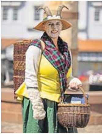
Offene Märchenstadtführung für Kinder mit Mutter Geiß.

Bis der Wolf am Ende im Stadtborn ertrinkt, haben die Besucher so einiges über die Familie Grimm und das einstige Amtshaus erfahren, über die Stadtbefestigung, den Schnappkorb und vieles mehr. Die kurzweilige Führung beginnt um 14 Uhr am Märchen-