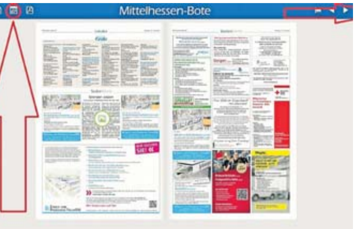
Das E-Paper des BOTEN hat viel zu bieten, wie den Zugriff auf alte Ausgaben über das Kalendersymbol oder die Volltextsuche.

Die Übersichtsseite bringt Sie zu den einzelnen Ausgaben, die wir wöchentlich für Sie produzieren. Hier können Sie auch Blicke zu den Nachbarn riskieren und sich beispielsweise über Veranstaltungen zwischen Hanau und Fulda informieren. Sie können bequem in Ihrem Browser durch die Texte und Angebote blättern oder über die Navigationsleiste direkt Seiten auswählen, interes-