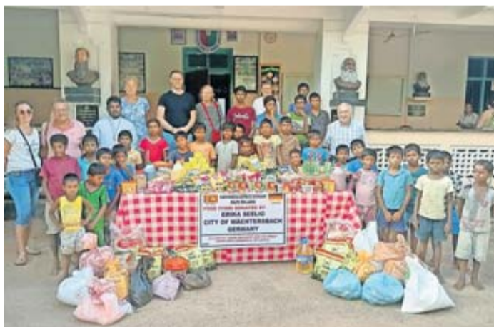
Die Lebensmittelspende an das Waisenhaus Don Bosco.

Wer die Hilfsaktion „Main-Kinzig-Kreis hilft Beruwala“ unterstützen möchte, kann auf folgende Konten spenden, entsprechende Sonderkonten sind bei allen drei Sparkassen im Main-Kinzig-Kreis eingerichtet (Stichwort „Beruwala“): Sparkasse Hanau: BIC HELADEF1HAN, IBAN DE47 5065 0023 0000 0999 94 Kreissparkasse Gelnhausen: BIC HELADEF1GEL, IBAN DE56 5075 0094 0000 0999 94 Kreissparkasse Schlüchtern: BIC HELADEF1SLÜ, IBAN DE27 5305 1396 0000 0999 94