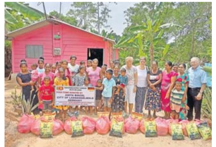
Lebensmittelübergaben an zwölf notleidende Familien im Stadtteil Karandagoda.