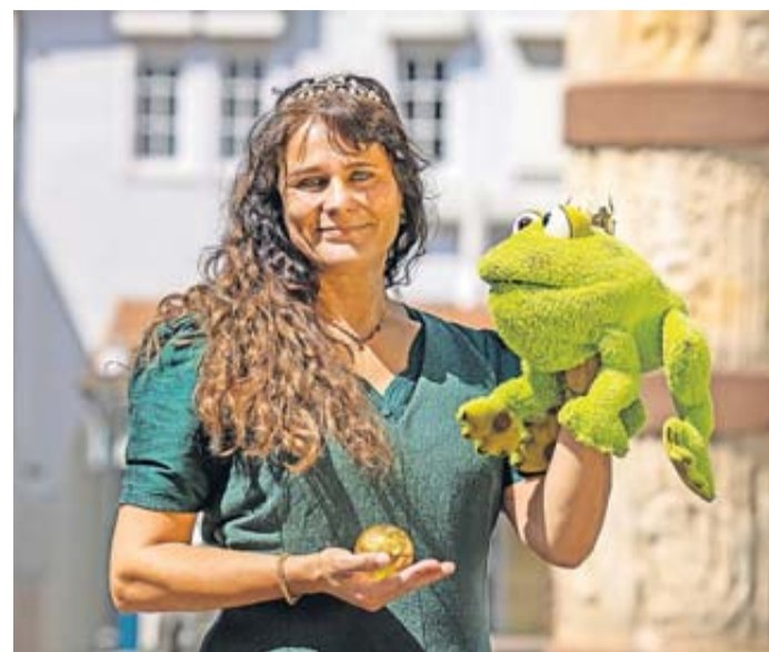
Spannende Mitmach-Stadtführung für Kinder.