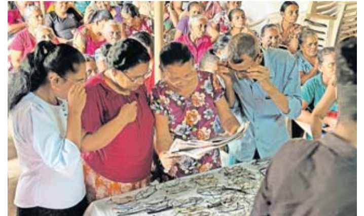
Brillenspenden im Dorf Anandagama: Hunderte von Menschen suchten geduldig eine für sie in der Sehstärke passende Sehhilfe und können jetzt wieder besser am gesellschaftlichen Leben teilnehmen.

Am dritten Tag ging es noch in den Wilpattu Nationalpark. Die Fahrt, die den Kindern sehr viel Freude bereitete, wurde ermöglicht durch die Spenden von Familie Krucker aus Maintal und Familie Conen/Zach aus Niederdorfelden. Ein ebenso wichtiger Teil der Hilfsreise war die Versorgung der von der Hilfsaktion betreuten fünf Waisenhäuser mit Lebensmitteln und der Main-Kinzig-Kindergärten mit Lehr- und Lernmitteln. Die Maradana-Frauenklinik und die Naleem-Zahnklinik erhielten medizinische Ausstattung. In den Schulen „Colors of Islam“ und Wisdom International Panadura konnten die Auszeichnungen zum Schuljahresabschluss an alle Schülerinnen und Schüler mit übergeben werden.