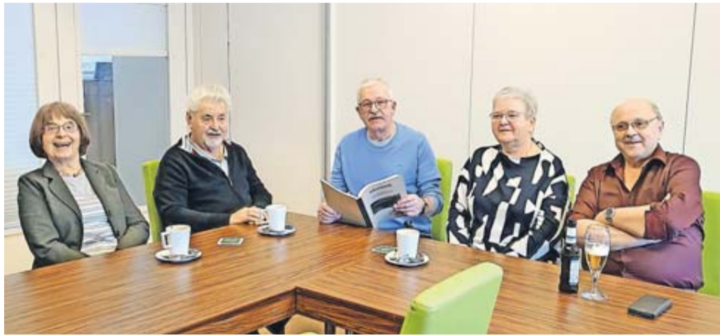
Es gab einiges zu besprechen.