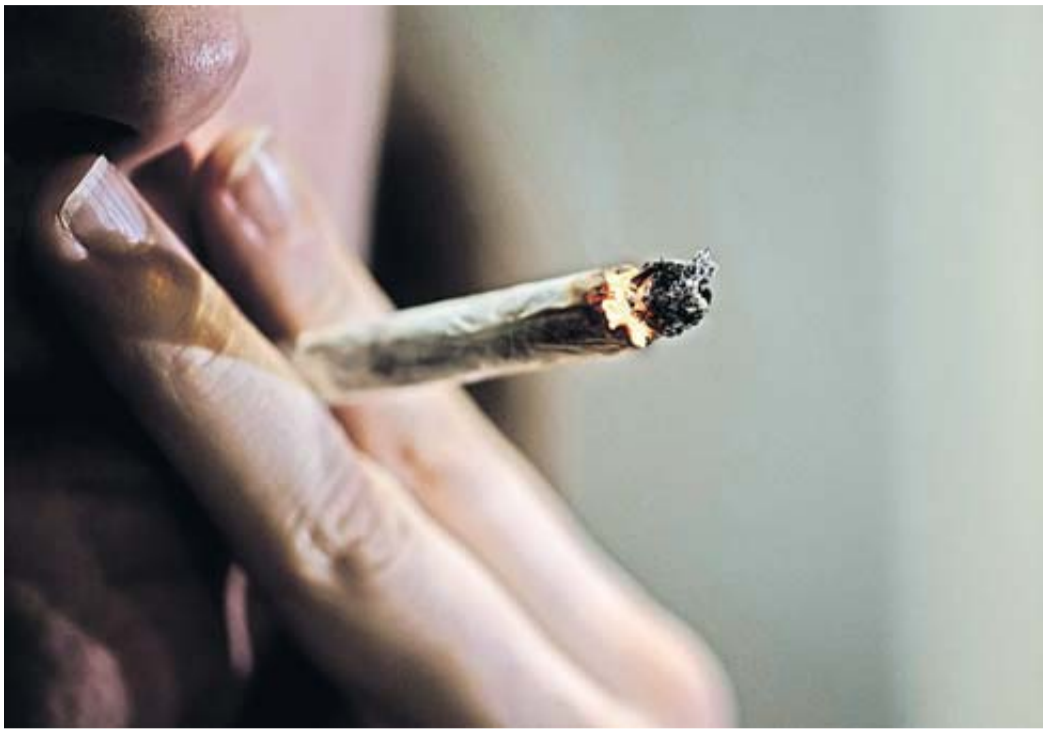
Arbeitnehmer schulden ihre ungetrübte Arbeitsleistung.

Ist künftig Kiffen am Arbeitsplatz erlaubt?