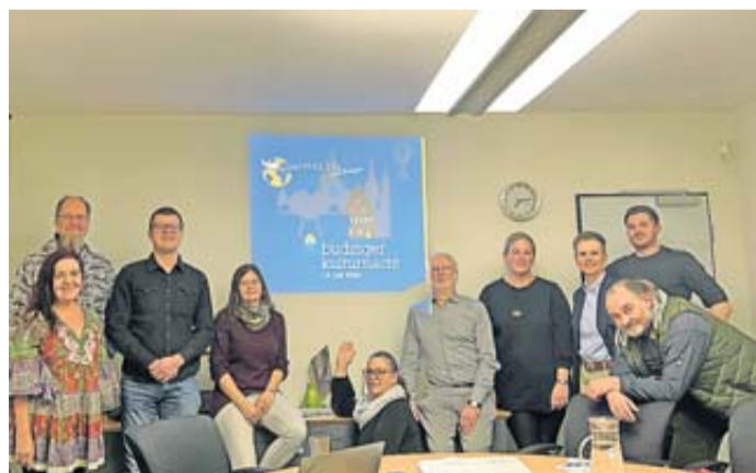
Der Planungskreis verspricht bereits jetzt eine einzigartige Nacht, welche den Besuchern in Erinnerung bleiben wird.

Büdingen. Die Vorbereitungen für die Büdingen Kulturnacht im Jahr 2024 laufen auf Hochtouren. Alle zwei Jahre verwandelt sich die Büdingen Altstadt für eine Nacht in das kulturelle Zentrum der Region. Am 13. Juli 2024 ist es wieder so weit: Kunst- und Kulturschaffende, kulinarische Highlights, kreative Köpfe und begeisterte Besucher treffen innerhalb der Stadtmauern aufeinander, um gemeinsam ein unvergessliches Fest für alle Sinne zu erleben. Über 7.000 Menschen konnte die Kulturnacht im Jahr 2022 in der historischen Altstadt begeistern und sorgte mit einem für die Region einzigartigen Programm noch lange für Begeisterung. Um den Besuchern auch in diesem Jahr wieder ein hochkarätiges Angebot bieten zu können, laufen die Planungen auf Hochtouren. Das Motto und das Konzept stehen fest, nun geht es an die Ausarbeitung aller Details, welche diese Veranstaltung so außergewöhnlich machen.