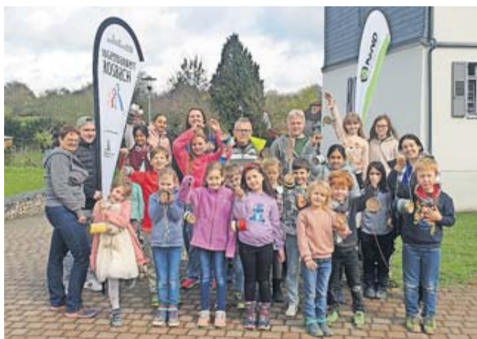
Kinder bauen mit Begeisterung Wildbienenhotels während der Osterferienspiele in der Wasserburg Nieder-Rosbach.

Jugendarbeit Rosbach und BUND organisieren Tag zur Wildbienenförderung