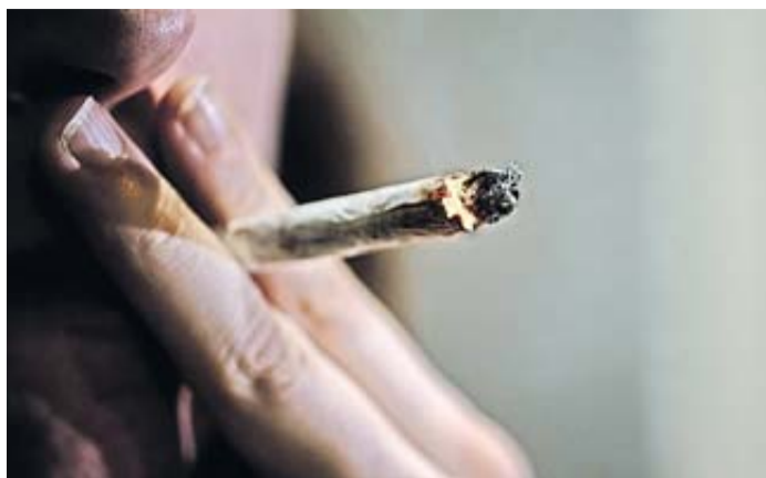
Arbeitnehmer schulden ihre ungetrübte Arbeitsleistung.

Ist künftig Kiffen am Arbeitsplatz erlaubt?