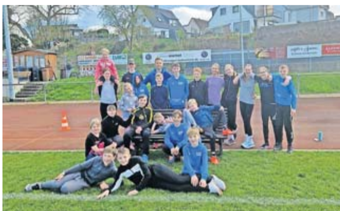
Die Leichtathletik-Teens des TV Echzell haben sich während ihres fünf-tägigen Trainingslagers intensiv auf die bevorstehenden Wettkämpfe der Freiluftsaison vorbereitet.

wöhnte strahlender Sonnenschein die Sportler, bevor das Wetter umschlug und wechselhafter wurde. Doch trotz der widrigen Bedingungen zeigte sich eine hohe Trainingsbeteiligung. Von Montag bis Freitag standen jeweils morgens und nachmittags 90-minütige Trainingseinheiten auf dem Programm, in denen sämtliche Disziplinen der Leichtathletik intensiv trainiert wurden – der ein oder