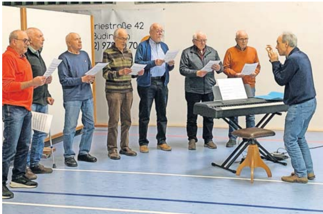
Mitglieder des Männergesangverein 1884 Wolferborn.