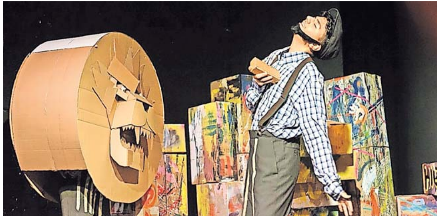
Junge Theatergruppe probt für ihre bevorstehenden Aufführungen im Rahmen des Bundes-Förderprogramms „Wege ins Theater“.

Das Bundes-Förderprogramm „Wege ins Theater“ bietet Raum für die Auseinandersetzung mit vielen Themen und Kulturbereichen. Gefördert werden durch das Programm außerschulische Theaterprojekte für 3- bis 18-jährige Kinder und Jugendliche, die in sozialen, finanziellen oder bildungsbezogenen Risikolagen aufwachsen. Dabei müssen es nicht zwingend die Theater sein, die den Förderantrag einreichen. Auch Vereine oder Jugendzentren, die Thea-