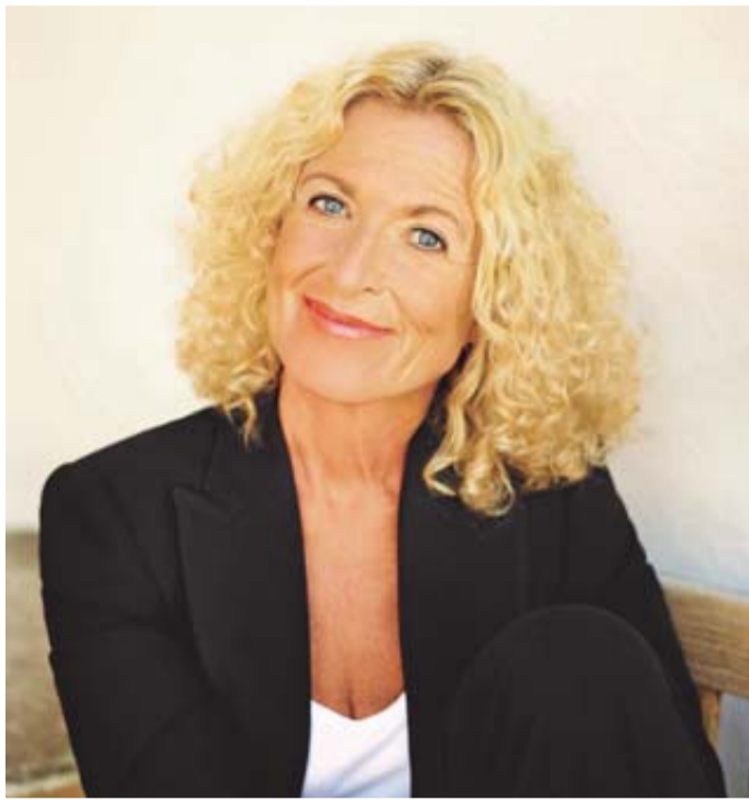
Zum zweiten Mal veranstaltet Möbel Höffner sein Lesefest und freut sich auf viele Besucher.