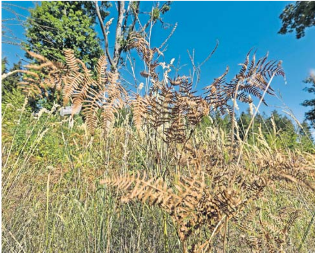
Das Klimaanpassungs-Konzept des Kreises und der 17 beteiligten Kommunen soll als Entscheidungsgrundlage für die nächsten Jahre dienen. Ziel ist, mit kleineren und größeren Maßnahmen die Auswirkungen der Erderwärmung auf Mensch und Natur vor Ort abzufedern.

Die Federführung für das Gesamtkonzept liegt beim Klimateam des Main-Kinzig-Kreises. Tamara Rexroth, die die Workshops mit den Verwaltungen in den vergangenen Monaten begleitet und mitmoderiert hat, freut sich, dass die gemeinsame Strategie zur Klimaanpassung nun auf die Zielgerade einbiegt.