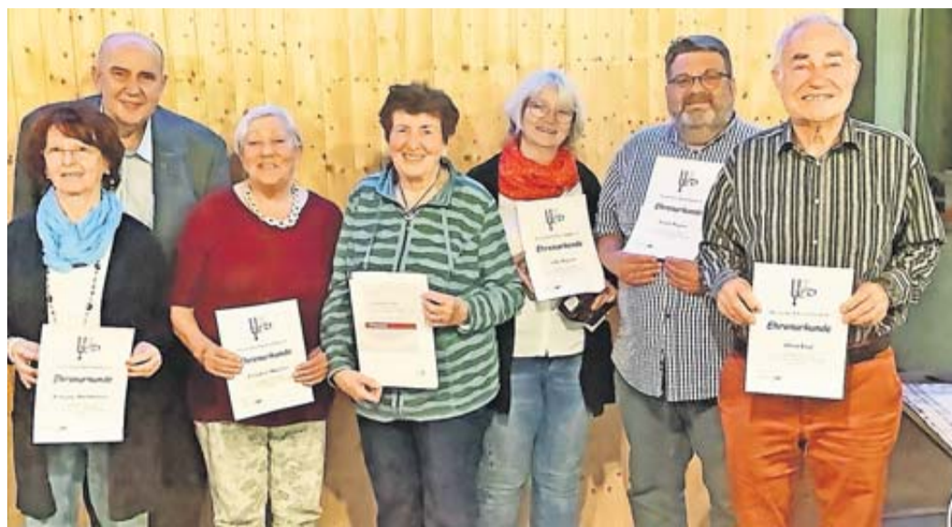
Die geehrten Mitglieder.