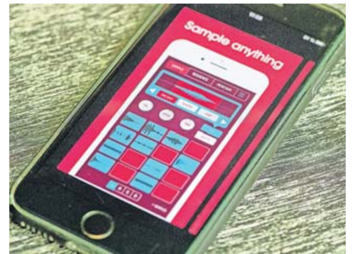
Gut für Anfänger: Übers Sampeln finden auch alle einen Zugang, die bisher wenig oder gar nichts mit Musikmachen am Hut hatten.

Der Koala Sampler ist aber längst nicht nur für Einsteiger interessant. Auch erfahrenen Telefonmusikanten bietet die App unzählige Möglichkeiten, auch für aufwendigere Produktionen. Wer Fragen zum Koala Sampler hat oder sich über die App und damit produzierte Tracks austauschen möchte, findet eine große Community auf diversen Plattformen.