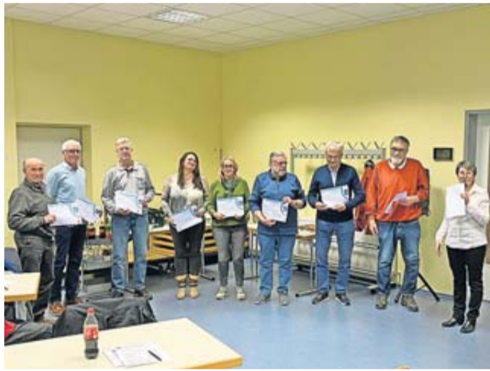
Die geehrten Mitglieder.

Nach der musikalischen Eröffnung durch das Ensemble wurde in den Jahresberichten des Vorstands auf die Höhepunkte des vergangenen Jahres zurückgeblickt. Besonders hervorgehoben wurde das große Musical-Projekt „Chattanooga“ im Amtshof, das ein voller Erfolg war. Im September feierte man außerdem das zehnjährige Bestehen von Erhards Bläserklasse mit einem karibischen Fest im Vereinsheim, zu dem auch die Erwachsenenbläserklassen aus Schlüchtern und Elm eingeladen waren.