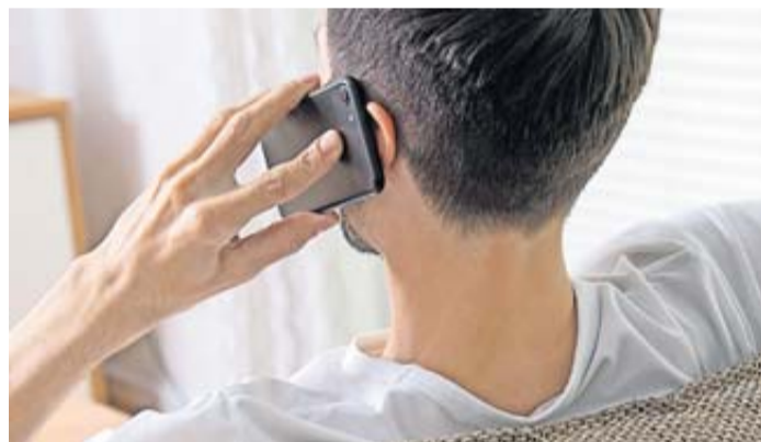
Kriminelle nutzen künstliche Intelligenz, um die Stimme von Verwandten und Bekannten täuschend echt für betrügerische Anrufe zu imitieren.

Das gilt selbst und gerade, wenn es sich bei den Anrufern um vermeintliche Familienmitglieder oder Freunde handelt. Denn Betrüger nutzen inzwischen immer öfter künstliche Intelligenz, um die Stimme eines Menschen täuschend echt für solche Anrufe zu imitieren, warnt die Verbraucherzentrale Bremen – und gibt folgende Tipps: Versuchen Sie trotz der Stresssituation ruhig zu bleiben, auch wenn Sie am Telefon unter Druck gesetzt werden, und geben Sie keine persönlichen Informationen preis. Das