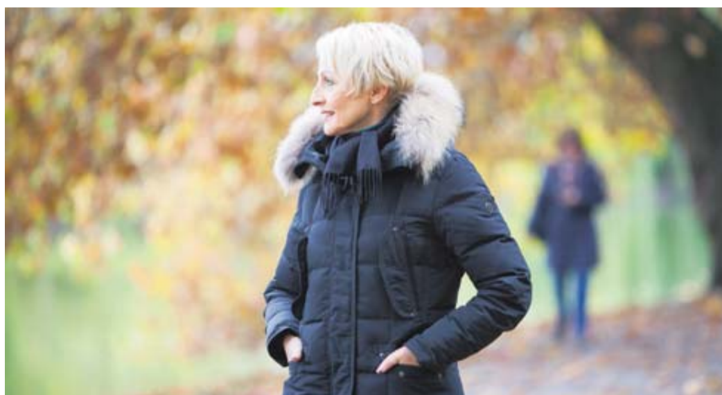
Was wollte ich immer schon machen? Ein Spaziergang kann helfen, die eigenen Gedanken zu sortieren und Pläne für den Ruhestand zu entwickeln.

Damit Menschen sehen, wo sie gerade in ihrem Leben stehen, empfehlen die Experten, Bilanz zu ziehen und zurückzuschauen –