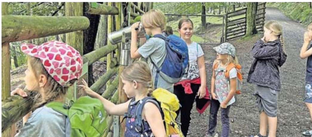
Beim Wetterauer Familiensommer gibt es noch freie Plätze.

Eine spannende Entdeckungsreise erwartet die Teilnehmenden des Tagesausfluges der Kinderfarm Jimbala e.V. am 18. Mai (Samstag) zu den Burgfestspielen in Bad Vilbel. Besucht wird die Generalprobe des Schauspiels „Ronja Räubertochter“, in dem sich