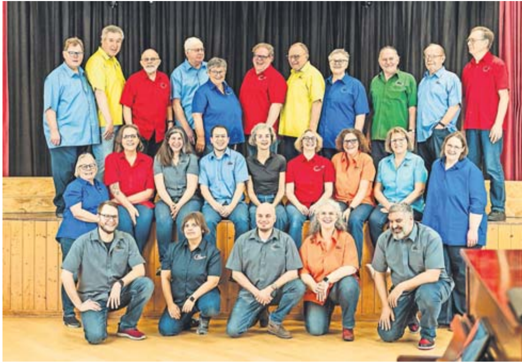
Mitglieder der Germania Sängerkunst Bönstadt e.V. feiern den Jahresauftakt beim Neujahrsempfang und ehren langjährige Vereinsmitglieder.

Wie in vielen Vereinen, war es auch für die Germania Sängerkunst Bönstadt e.V. schwierig neue Personen für die ehrenamtliche Tätigkeit im Vorstand zu begeistern. So blieben