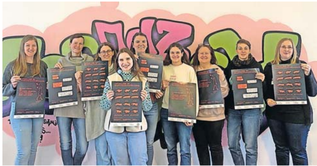
Die Initiatorinnen präsentieren die Plakate zur Kampagne gegen „Catcalling“.

zu kontaktieren. Im Wetteraukreis bieten Wildwasser Wetterau e.V. in Bad Nauheim (Telefon (06032) 9495760), der Frauen-Notruf in Nidda (Telefon (06043) 4471), oder pro familia in Friedberg (Telefon (06031) 2336) Beratungen an. Kampagnenplakate bestellen Interessierte können die Din