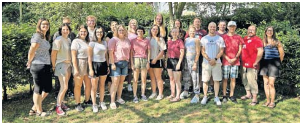
Die Fachstelle Jugendarbeit des Wetteraukreises sucht weitere Betreuerinnen und Betreuer für Ferienfreizeiten und Bildungsangebote.

Engagierte Betreuerinnen und Betreuer für Ferienfreizeiten und Bildungsangebote gesucht