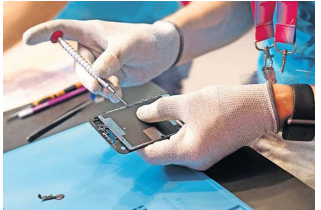
Auch wenn es von außen meist nicht so aussieht: Smartphones lassen sich öffnen und reparieren.

Bürger sollten prüfen, ob es vom Land einen Reparaturbonus gibt - dies ist in manchen Bundesländern umgesetzt oder im Gespräch.