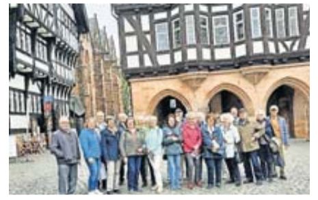
Die Senioren besuchten Alsfeld.