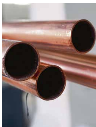
Mit speziellen Kupferlegierungen sind Handwerk und Industrie gut vorbereitet auf den Ausbau einer Wasserstoff-Infrastruktur.

vor allem an der mangelnden Verfügbarkeit. Denn bisher stammt er überwiegend aus der Industrie und ist damit nicht klimaneutral. Klar ist jedoch auch: Handwerk, Energieversorger und die Kupferbranche sind auf den Einsatz des klimaneutralen Energieträgers gut vorbereitet, wenn er in Zukunft einmal ausreichend zur Verfügung steht.