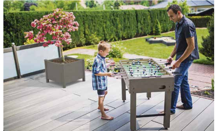
Ansprechende Holzoptik in nachhaltigem Gewand: Moderne Verbundmaterialien zeichnen sich durch Langlebigkeit und Kreislauffähigkeit aus.

rasse möglich. Zu den Vorreitern in diesem Bereich zählt etwa megawood mit dem Werkstoff German Compact Composite (GCC). Der Holzwerkstoff enthält bis zu 75 Prozent Naturfasern, Restholz aus der Hobel- und Sägeindustrie, die mit Polymeren besonders widerstandsfähig und langlebig werden. So bleibt die charakteristische Haptik und Optik erhalten, allerdings ohne den hohen Pflegeaufwand, den Holz im Außenbereich sonst mit sich bringt. Aufgrund der Veredelung sind die Dielen, die in vielen Designs und Farben erhältlich sind, frei von gefährlichen Splintern, auch ein späteres Streichen und Ölen gegen das Vergrauen des Holzes ist nicht mehr notwendig. Neben Terrassen ist der nachhaltige Holzwerkstoff ebenfalls für Fassaden, Zäune, Sichtschutz oder als Bauholz geeignet. Aufgrund der hohen Widerstandsfähigkeit lassen sich auch Pools oder Teiche mit dem Holzverbundmaterial umfassen.