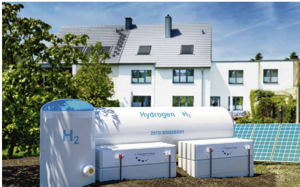
Wasserstoff gilt als saubere Energie der Zukunft. Wann sich der Einsatz im privaten Haushalt lohnt, ist noch nicht absehbar.

Handwerk, Energieversorger und Kupferindustrie sind vorbereitet