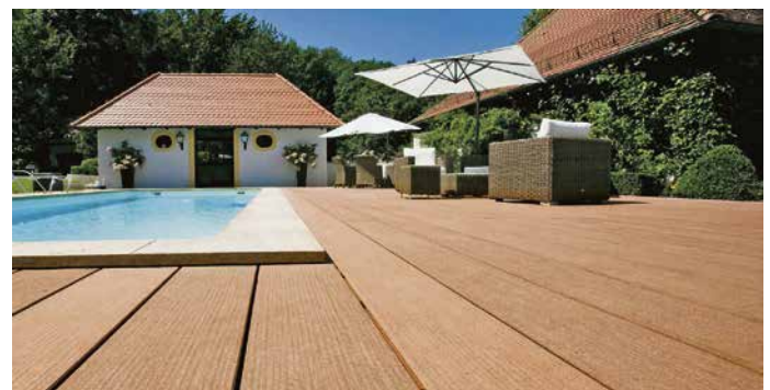
Der Lieblingsplatz für sonnige Tage: Die regenerativen Terrassendielen werten jeden Garten optisch auf.

Seifer Weg 21 · 65232 Taunusstein Tel. 06128.741 564 · www.planungsbuero-matiebe.de