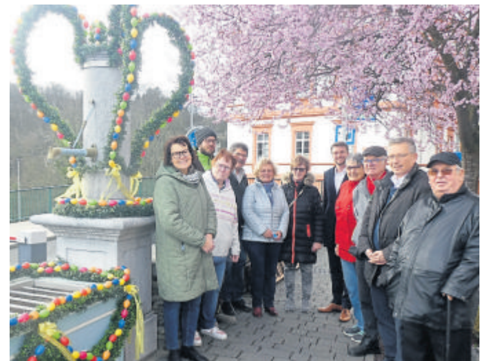
So präsentierte sich der Osterbrunnen im letzten Jahr nachdem er geschmückt worden war.

Bestellte Gutscheine können bei Copy & Print (Neugasse 14, Weilburg) abgeholt werden. Dabei ist zu beachten, dass eine taggleiche Abholung größerer Mengen nicht immer möglich ist. Die Gutscheine der WWW sind drei Jahre nach Ausstellung gültig (eine Barauszahlung oder Einlösen des Werts auf das Girokonto ist nicht möglich). Weitere Informationen sind unter www.wirtschafts-werbung-weilburg.de erhältlich.