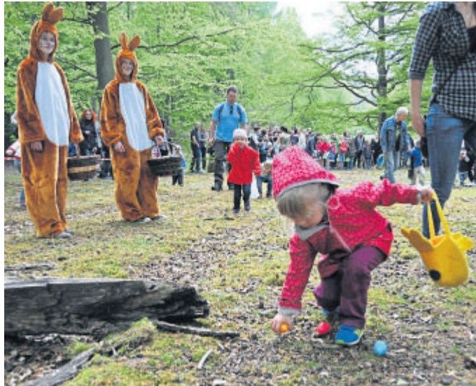
Die Ostereiersuche ist ein großer Spaß für Groß und Klein.

Annahmeschluss für Manuskripte sowie Fotos ist am Montag, 18. März 2024