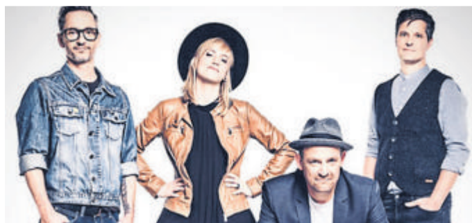
Wait for June

Kontakt: LindenCult, Lindenhof 2, 35781 Weilburg Hasselbach, www.lindencult.de.