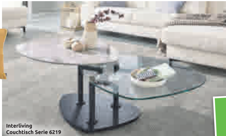
Interliving Couchtisch Serie 6219