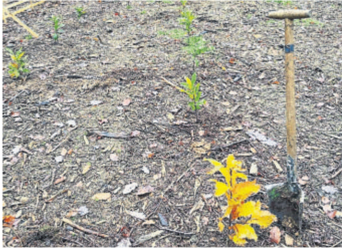
Elsbeeren und Kastanien wurden hier gepflanzt.

(red). Wenn im März die Sonne scheint und es bereits nach Frühling duftet, kribbelt es in den Fingern etwas im Garten zu tun. Während in Gärten die Beete vorbereitet und Obstbäume gepflanzt werden, braucht auch der Wald unsere Aufmerksamkeit. Seit dem Som-