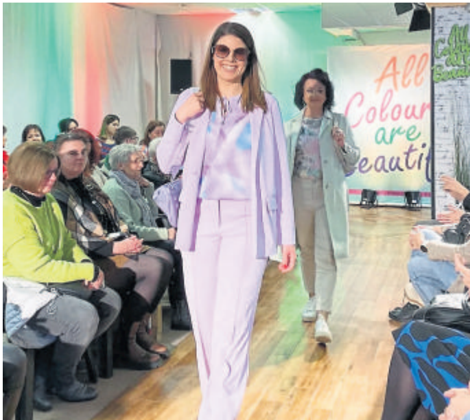
Die Modenschauen bei Horne sind sehr beliebt.

Kontakt: Theatergemeinde Weilburg, Schlossplatz 1, 35781 Weilburg, Telefon 06471-9125409, E-Mail an theater@weilburg.de, www.theater-weilburg.de.