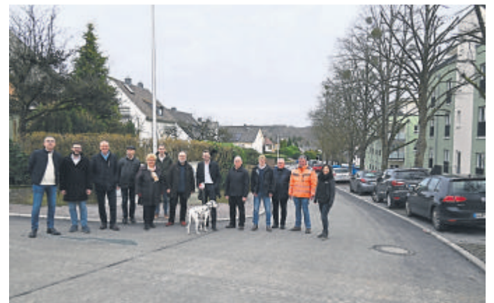
Pressetermin nach erfolgreicher Baumaßnahme: Neben den Beteiligten ist rechts der gut genutzte Parkstreifen neben der Seniorenwohnanlage zu sehen.