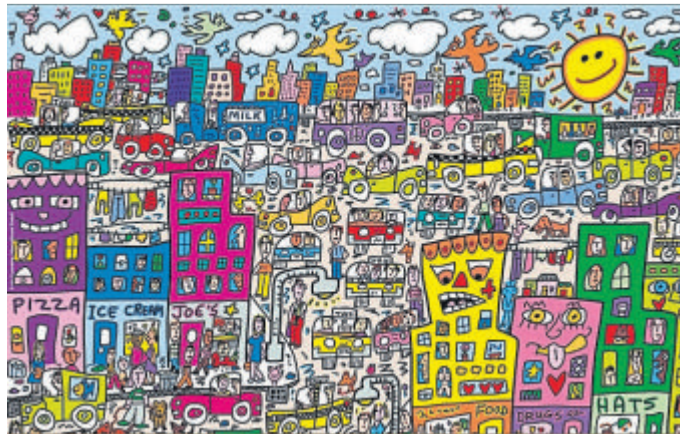
Dieses prachtvolle, bunte Werk von Rizzi lädt zur Ausstellung ein.

liebte die Menschen aber sehr und sie liebten ihn. Vielleicht lag es daran, dass er in einer Großfamilie mit italienisch-irischen Wurzeln und rund vierzig Cousins und Cousinen aufwuchs. Zu seinen vielen Freunden gehörte auch die Musik-Legende Jim Morrison von den „Doors“, und die Millionen von Anhänger sind rund um die ganze Welt verteilt. Seine vielen Motive, die „Peace“, „Love“, „Friendship“ oder einfach pure Lebensfreude widerspiegeln, erreichen die Herzen der Menschen auf eine ganz direkte Art.