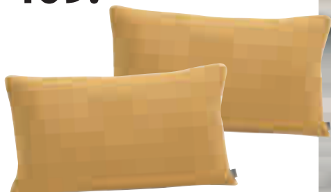
Interliving Kissen Serie 9113 - Kissenhülle, jacquardgewebt, 60% Baumwolle, 40% Polyacryl, versch. Größen, z. B. ca. 30x50 cm.