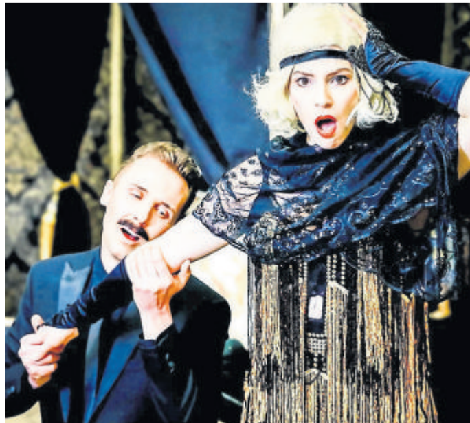
Szene aus „Lily & Lily“

Kontakt: Horne, Mode die Spaß macht, Langgasse 35-37, 35781 Weilburg, www.horne-mode.de.