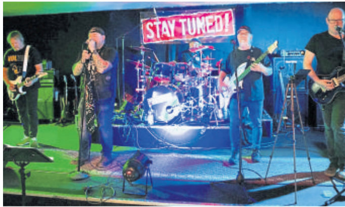
Die Band „Stay tuned“ sorgt für Stimmung.

(bach). Wenn „The Original Andy Sommer“ seine sanfte Stimme erklingen lässt und „Klangbilder“ durch die Lüfte schweben, dann ist wieder die Weilburger Kneipennacht angesagt: am 16. März ab 20 Uhr laden Weilburger Kneipen mit live-Musik oder einem DJ zum Besuch. Und man kann mit dem einmal bezahlten Eintrittspreis in