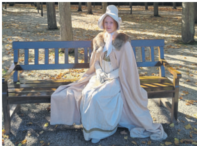
Im Schlossgarten bei einer Themen-Stadtführung mit Prinzessin Henriette.