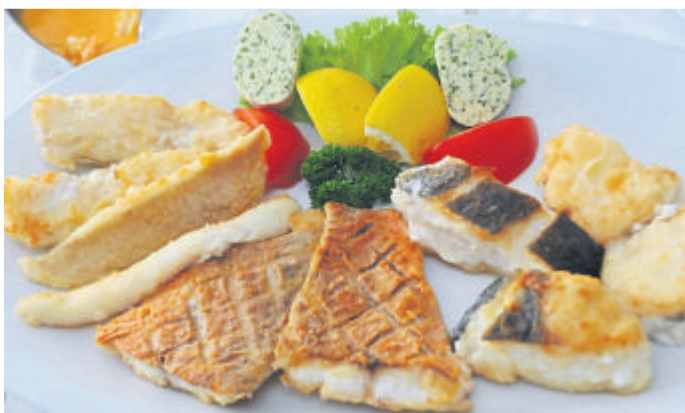
Die Fischplatte Luv'n Lee.

(bach). Im Gasthaus Neu „Zum Westerwald“ stehen im März wieder leckere Speisen auf dem Plan: vom 14. bis 29. März servieren Gud-