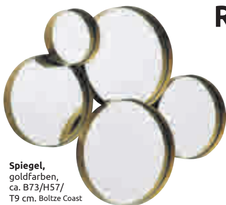
Spiegel, goldfarben, ca. B73/H57/T9 cm. Boltze Coast